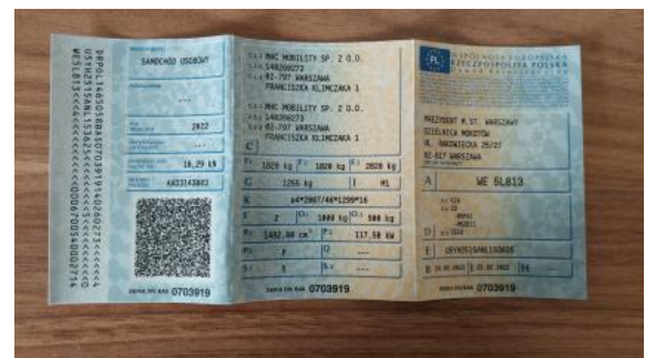
Fot. 32 Dowód rej. Str. 1