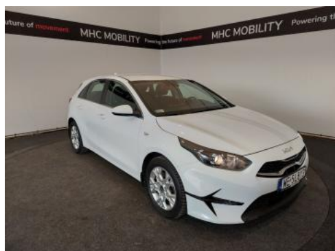
Fot. 3 Przekątna przednia prawa