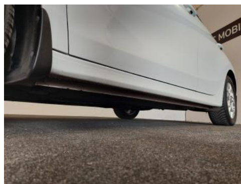
Fot. 12 Próg lewy (widok od przodu)