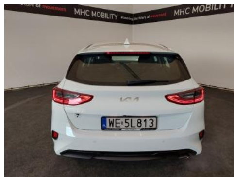
Fot. 8 Tył