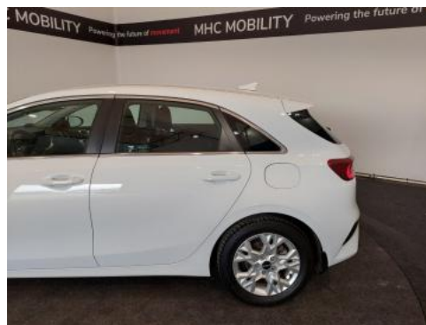
Fot. 10 Bok lewy z tyłu