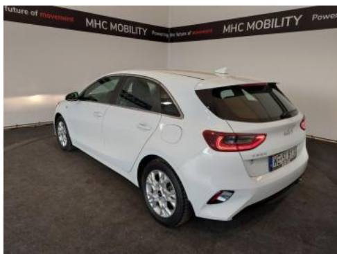
Fot. 9 Przekątna tylna lewa