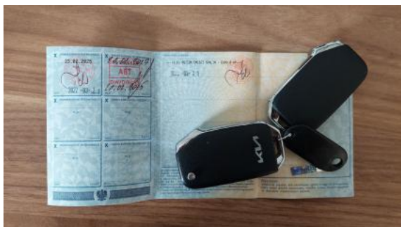
Fot. 33 Dow. Rej. Str.2 i klucze