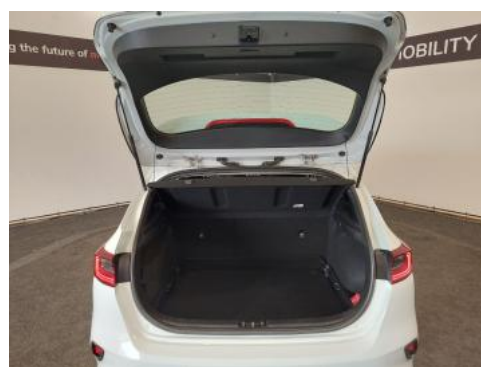
Fot. 24 Bagażnik