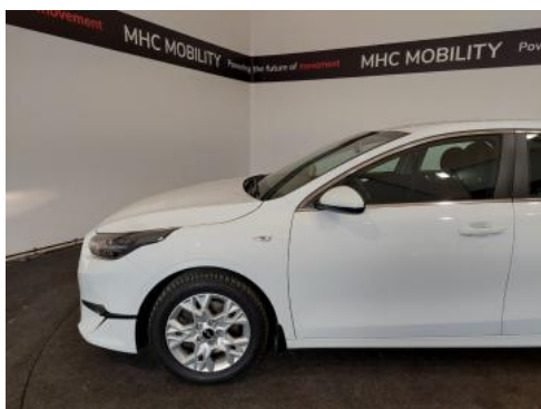
Fot. 11 Bok lewy z przodu