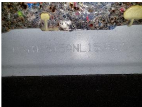
Fot. 13 Numer identyfikacyjny