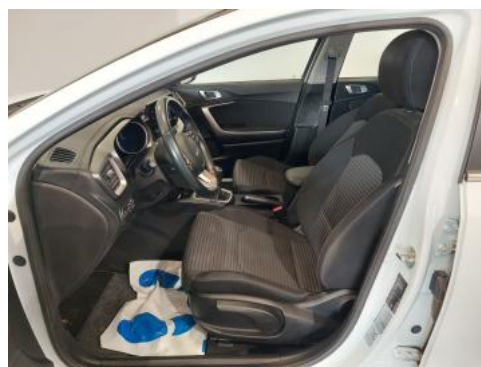
Fot. 16 Widok przez otwarte drzwi przednie lewe