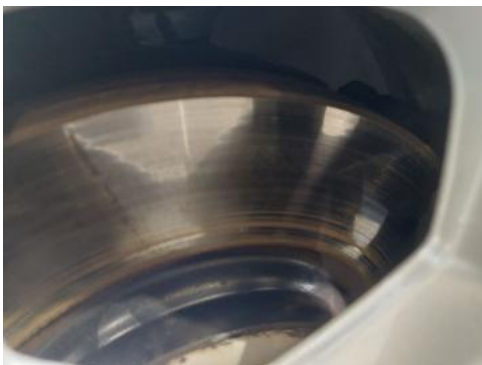
Fot. 29 Tarcza hamulcowa przednia prawa