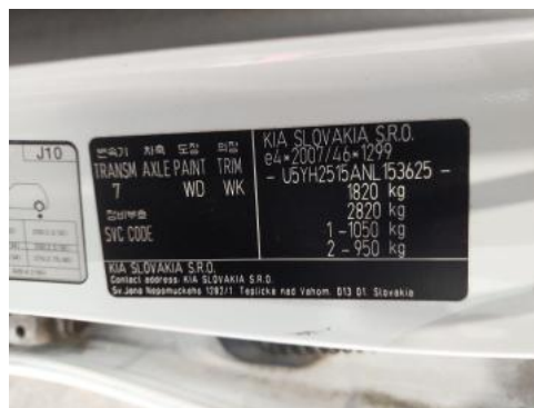
Fot. 14 Tabliczka znamionowa