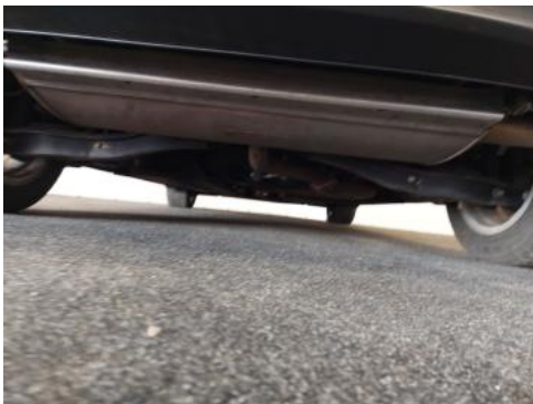
Fot. 27 Spód pojazdu tył