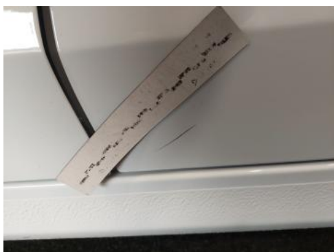
Fot. 35 Drzwi tylne L - Rysa/odprysk 1