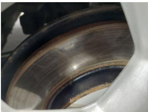
Fot. 31 Tarcza hamulcowa tylna lewa