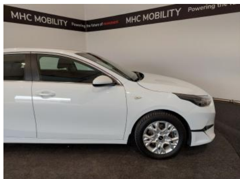
Fot. 5 Bok prawy z przodu