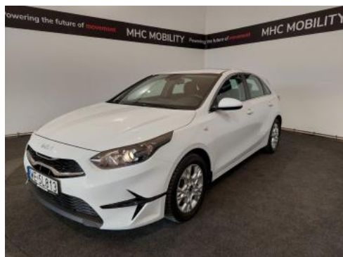
Fot. 1 Przekątna przednia lewa