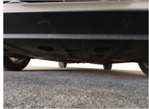
Fot. 26 Spód pojazdu przód