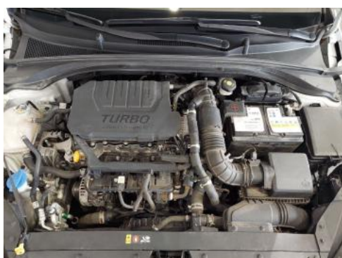
Fot. 23 Komora silnika