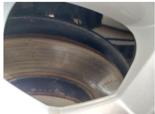
Fot. 30 Tarcza hamulcowa tylna prawa