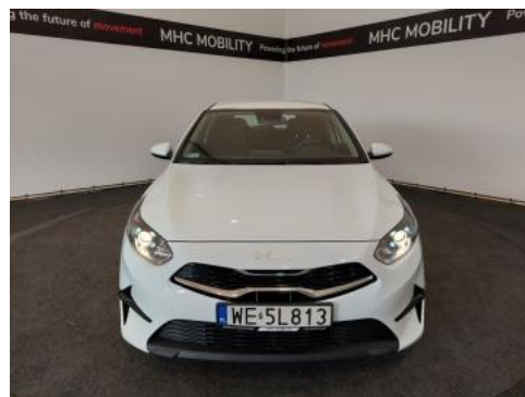
Fot. 2 Przód