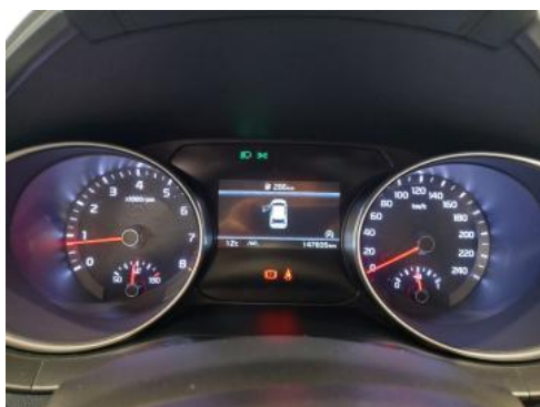
Fot. 15 Zestaw wskaźników - przebieg