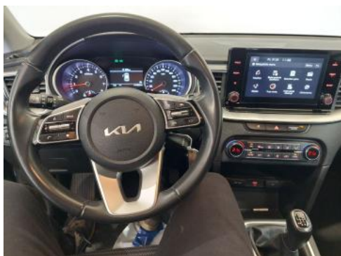
Fot. 21 Kierownica (na wprost)