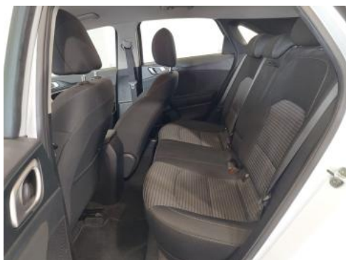
Fot. 17 Widok przez otwarte drzwi tylne lewe