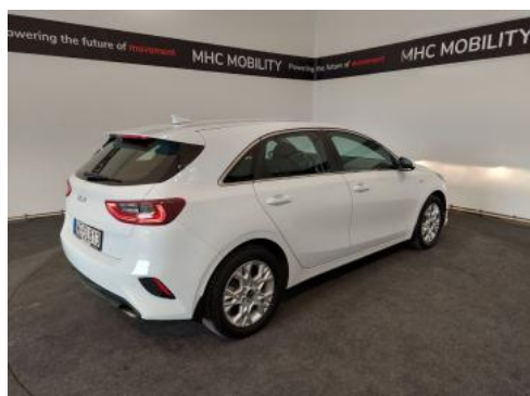
Fot. 7 Przekątna tylna prawa