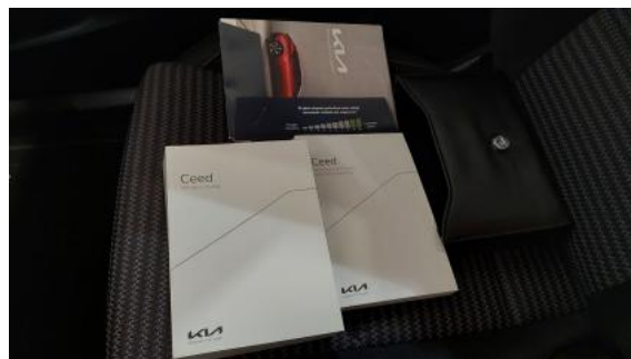
Fot. 34 Instrukcje