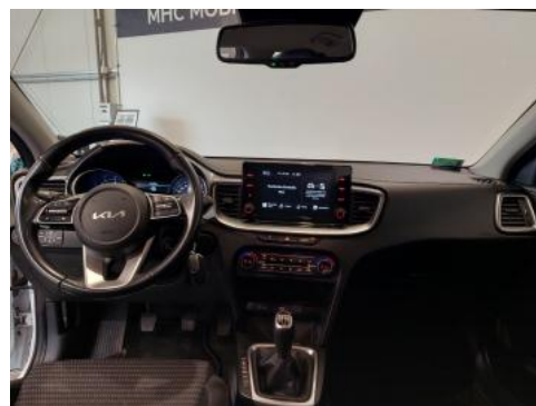
Fot. 18 Widok z tylnej kanapy na deskę rozdzielczą