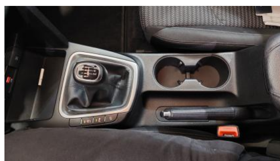
Fot. 20 Tunel środkowy