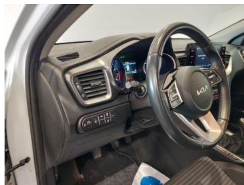
Fot. 22 Kierownica z lewej strony