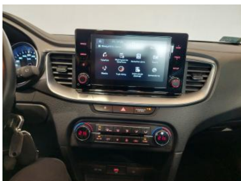
Fot. 19 Konsola środkowa