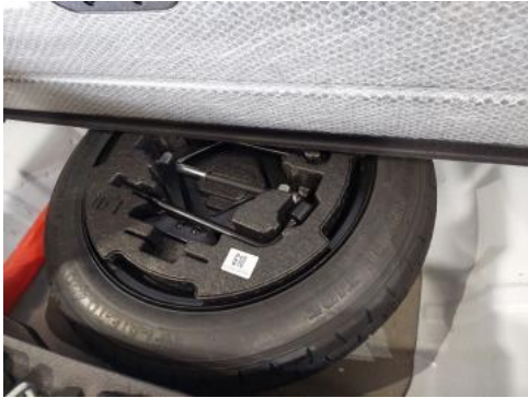
Fot. 25 Koło zapasowe