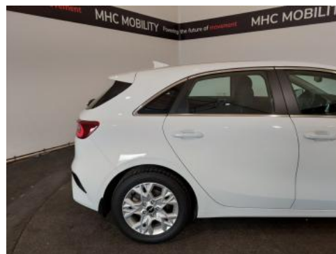
Fot. 6 Bok prawy z tyłu