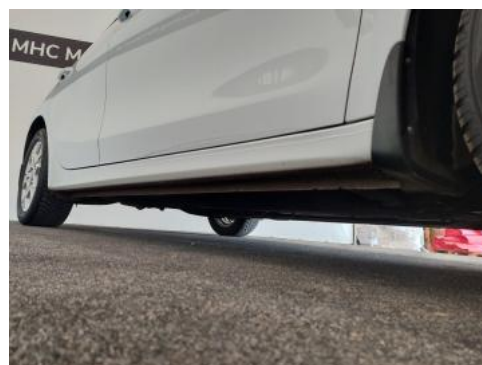
Fot. 4 Próg prawy (widok od przodu)