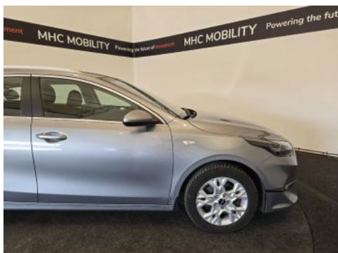
Fot. 5 Bok prawy z przodu