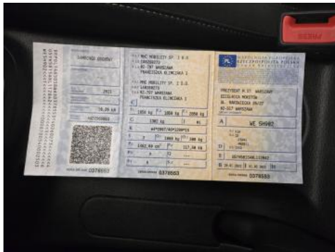
Fot. 33 Dowód rej. Str. 1