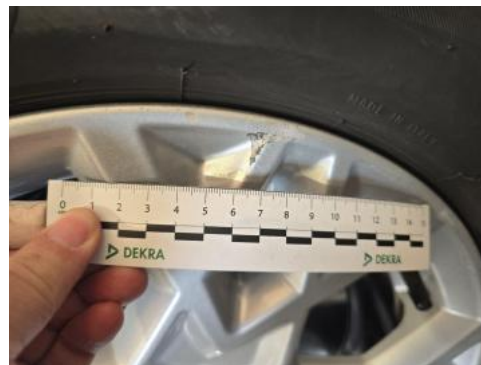
Fot. 58 Felga Aluminiowa przednia L - Rysa/odprysk 1