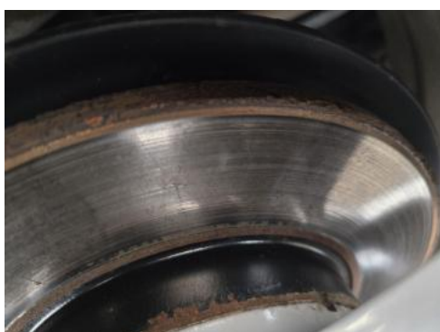
Fot. 31 Tarcza hamulcowa tylna prawa