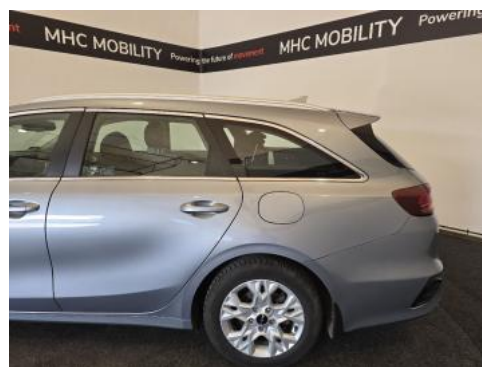
Fot. 10 Bok lewy z tyłu