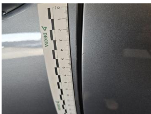
Fot. 55 Drzwi przed L - Rysa/odprysk 1