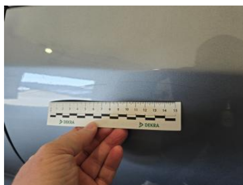
Fot. 56 Drzwi tylne L - Rysa/odprysk 1