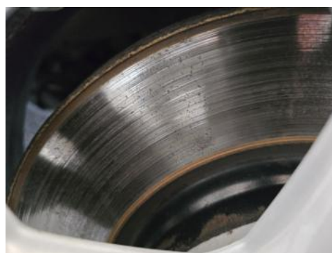
Fot. 30 Tarcza hamulcowa przednia prawa