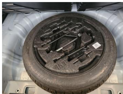
Fot. 26 Koło zapasowe