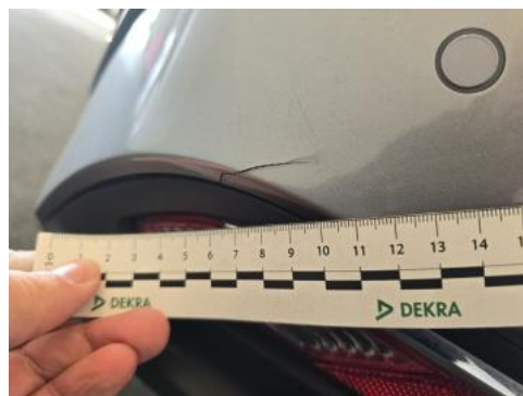
Fot. 50 Zderzak tylny - zdjęcie poglądowe 2