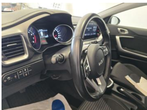
Fot. 23 Kierownica z lewej strony