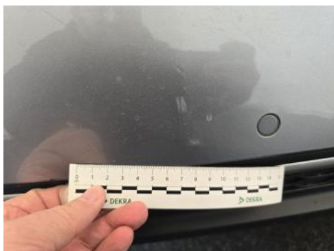
Fot. 49 Zderzak tylny - zdjęcie poglądowe 1