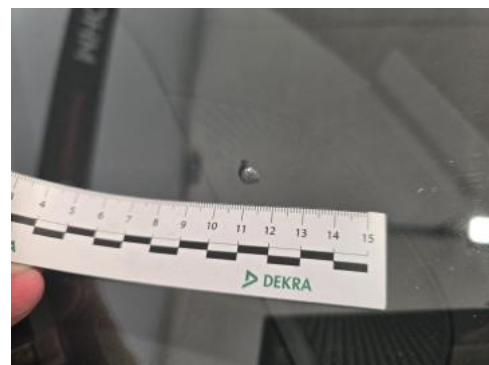
Fot. 38 Szyba czołowa - Pęknięcie/rozerwanie 1