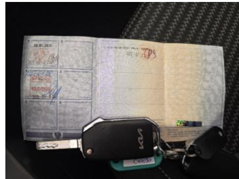
Fot. 34 Dow. Rej. Str.2 i klucze