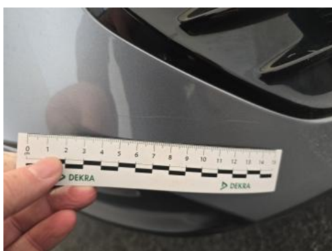
Fot. 51 Zderzak tylny - Rysa/odprysk 1