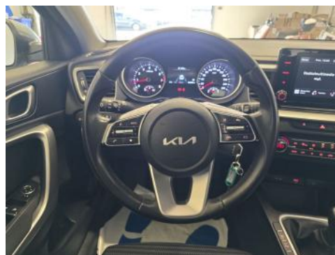
Fot. 22 Kierownica (na wprost)