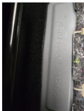
Fot. 13 Numer identyfikacyjny