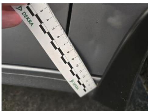
Fot. 43 Błotnik przedni P - Wgniecenie/odkształcenie 1