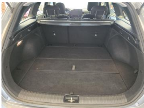
Fot. 25 Bagażnik