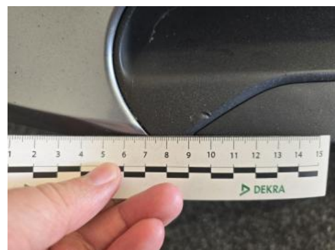
Fot. 40 Zderzak - Rysa/odprysk 1