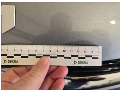
Fot. 39 Zderzak - zdjęcie poglądowe 2