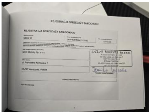
Fot. 35 Książka serwisowa – dane