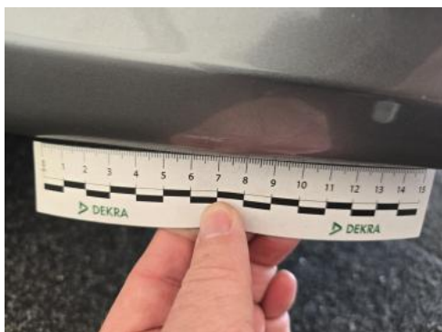
Fot. 41 Zderzak - Rysa/odprysk 2