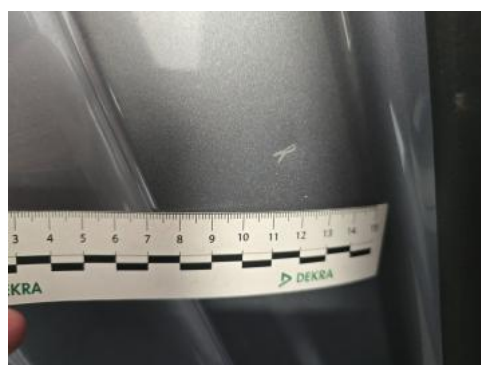
Fot. 48 Próg P - Rysa/odprysk 1