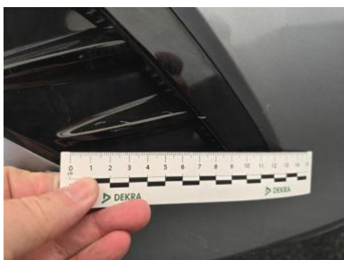
Fot. 53 Zderzak tylny() - Rysa/odprysk 3