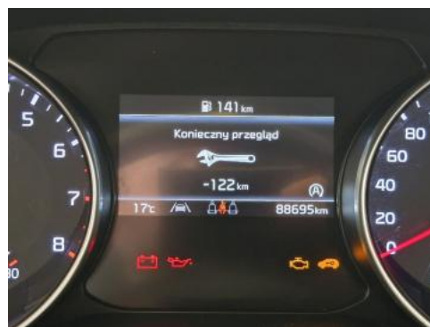
Fot. 16 Zestaw wskaźników - serwis