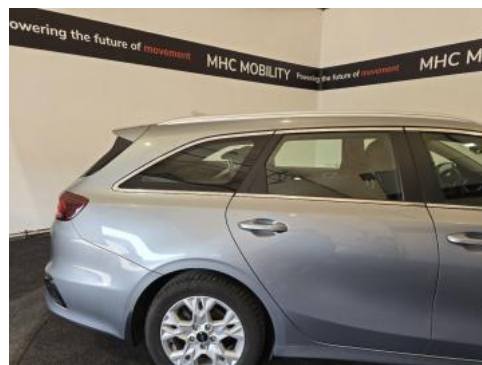
Fot. 6 Bok prawy z tyłu