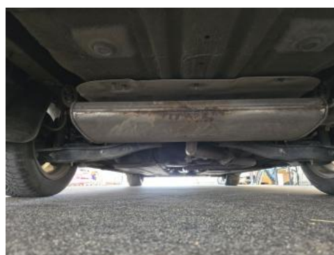
Fot. 28 Spód pojazdu tył