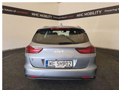
Fot. 8 Tył