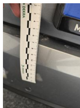
Fot. 52 Zderzak tylny - Rysa/odprysk 2