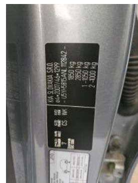
Fot. 14 Tabliczka znamionowa