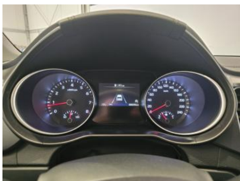
Fot. 15 Zestaw wskaźników - przebieg