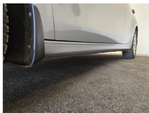
Fot. 12 Próg lewy (widok od przodu)