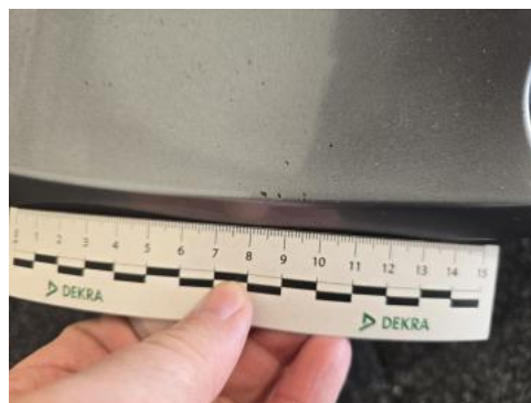
Fot. 42 Zderzak() - Rysa/odprysk 3