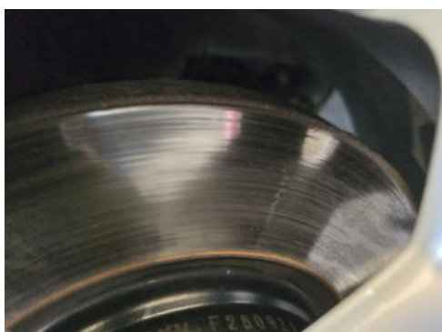
Fot. 29 Tarcza hamulcowa przednia lewa