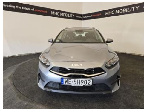
Fot. 2 Przód