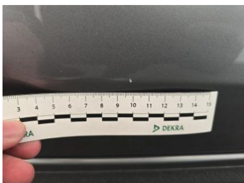
Fot. 45 Drzwi przednie P - Rysa/odprysk 1