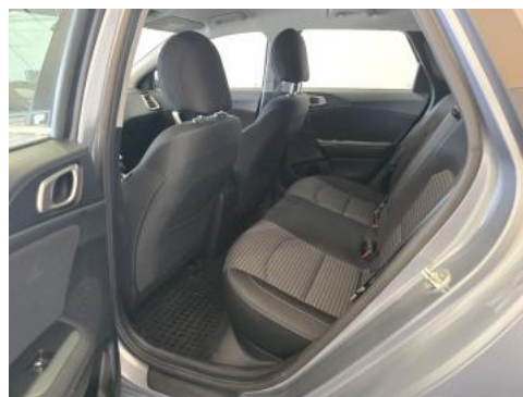
Fot. 18 Widok przez otwarte drzwi tylne lewe