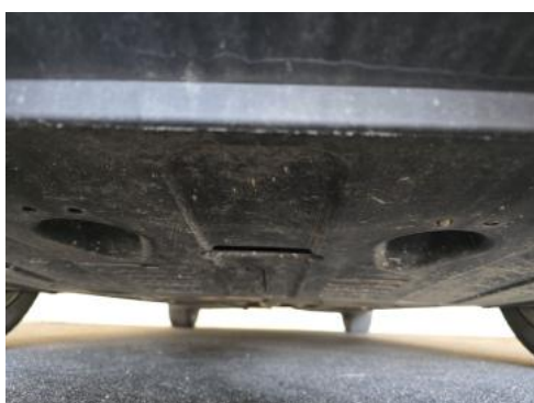
Fot. 27 Spód pojazdu przód