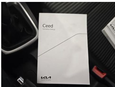
Fot. 37 Instrukcje