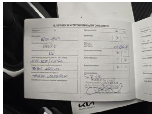
Fot. 36 Książka serwisowa – ostatni przegląd