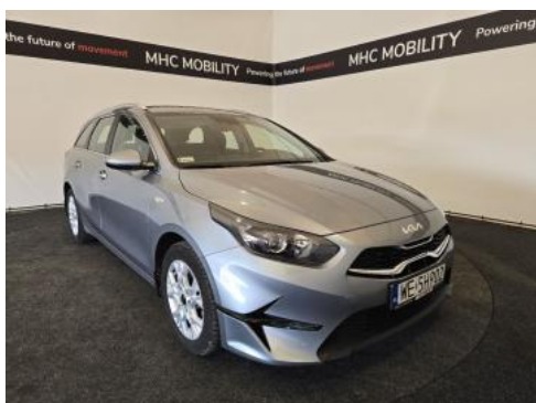
Fot. 3 Przekątna przednia prawa