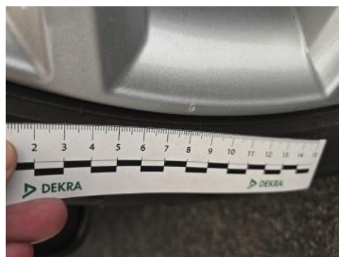
Fot. 44 Felga aluminiowa przednia P - Rysa/odprysk 1