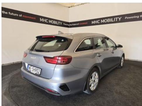
Fot. 7 Przekątna tylna prawa