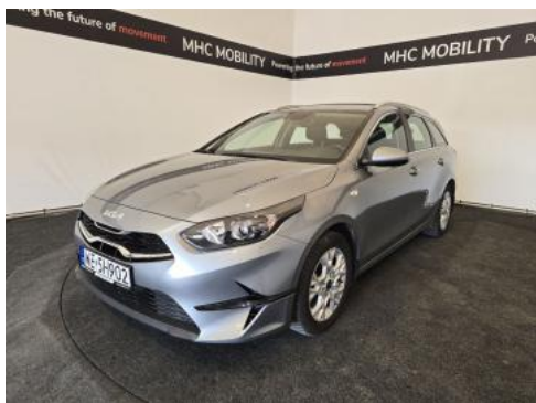
Fot. 1 Przekątna przednia lewa