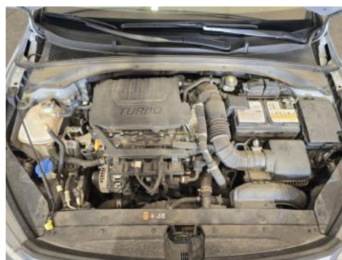
Fot. 24 Komora silnika