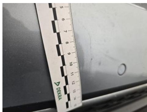
Fot. 54 Zderzak tylny - Pęknięcie/rozerwanie 1