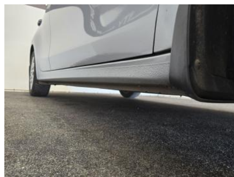
Fot. 4 Próg prawy (widok od przodu)