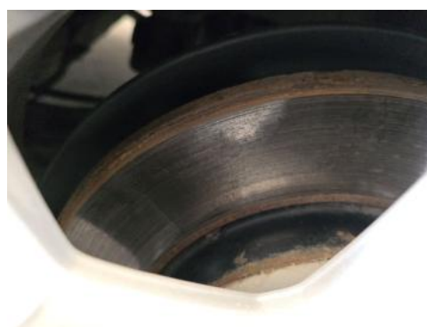
Fot. 32 Tarcza hamulcowa tylna lewa