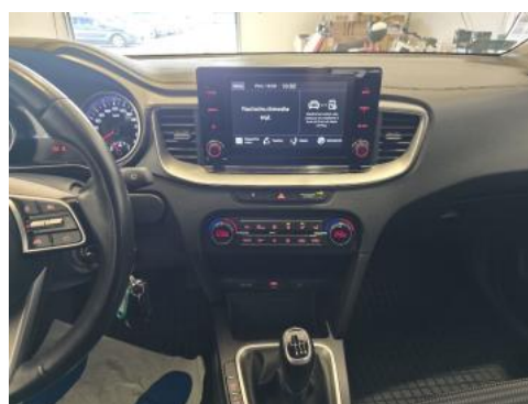
Fot. 20 Konsola środkowa