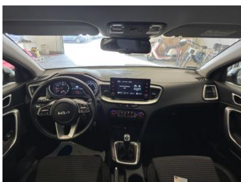
Fot. 19 Widok z tylnej kanapy na deskę rozdź.