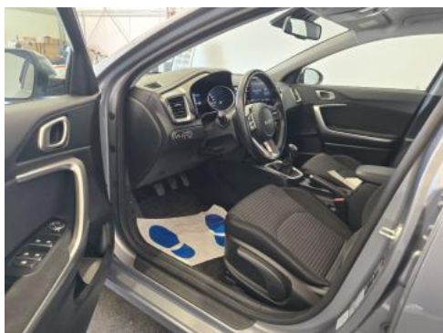
Fot. 17 Widok przez otwarte drzwi przednie lewe