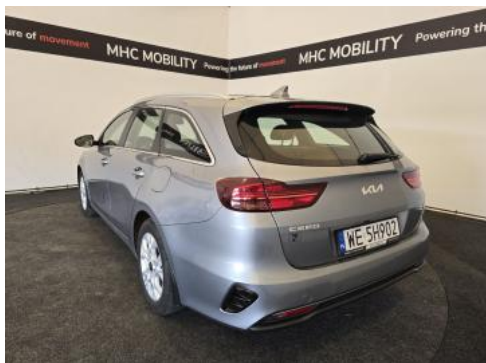
Fot. 9 Przekątna tylna lewa