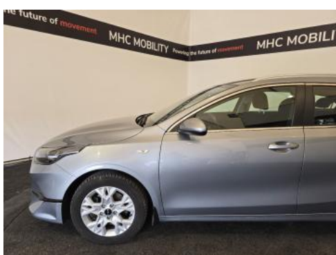
Fot. 11 Bok lewy z przodu