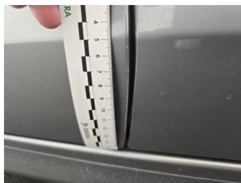
Fot. 46 Drzwi tylne P - Rysa/odprysk 1