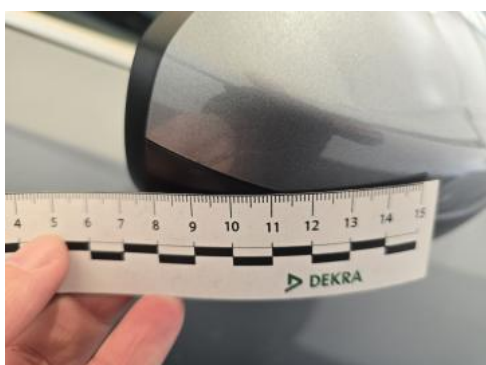
Fot. 47 Obudowa lusterka zew P - Rysa/odprysk 1