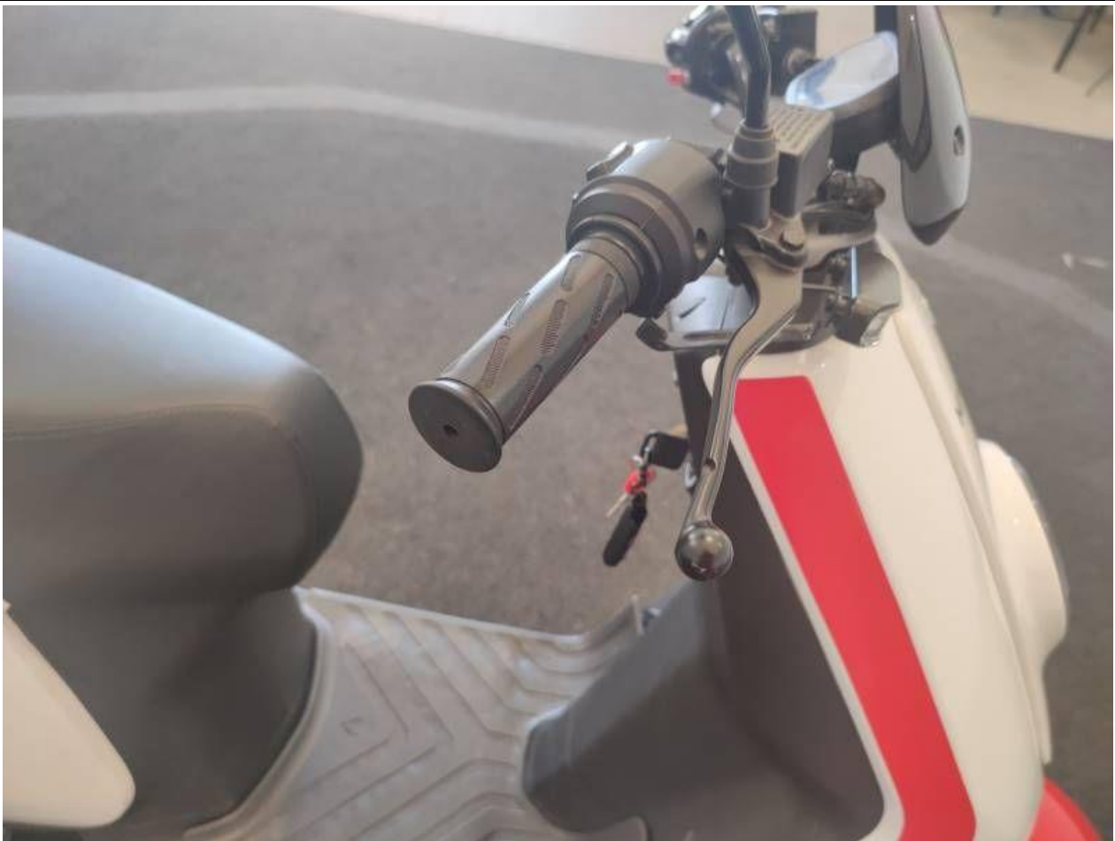
Fot. nr 49