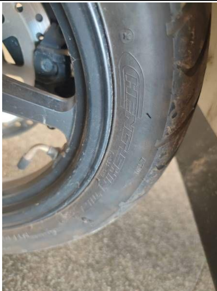
Fot. nr 27