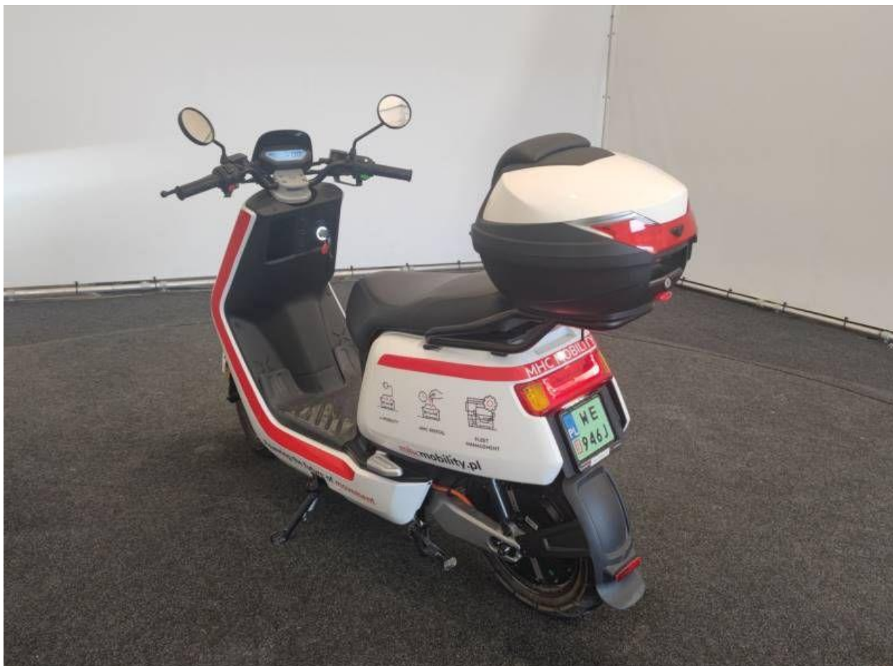
Fot. nr 2