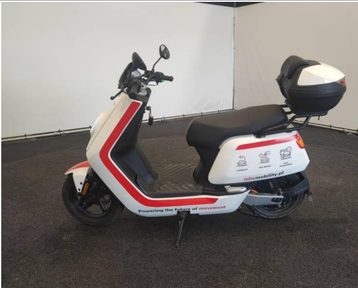
Fot. nr 3