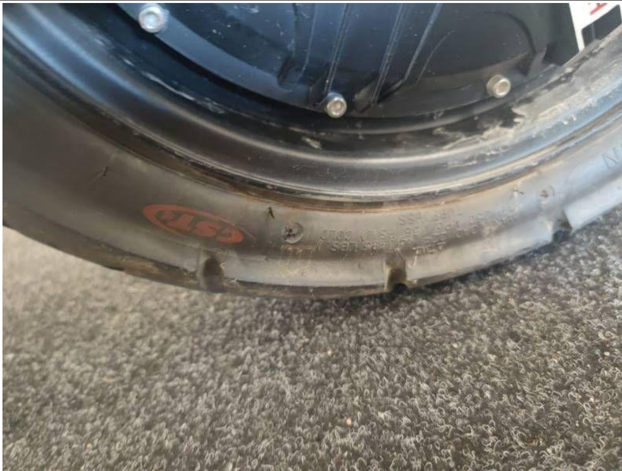
Fot. nr 31