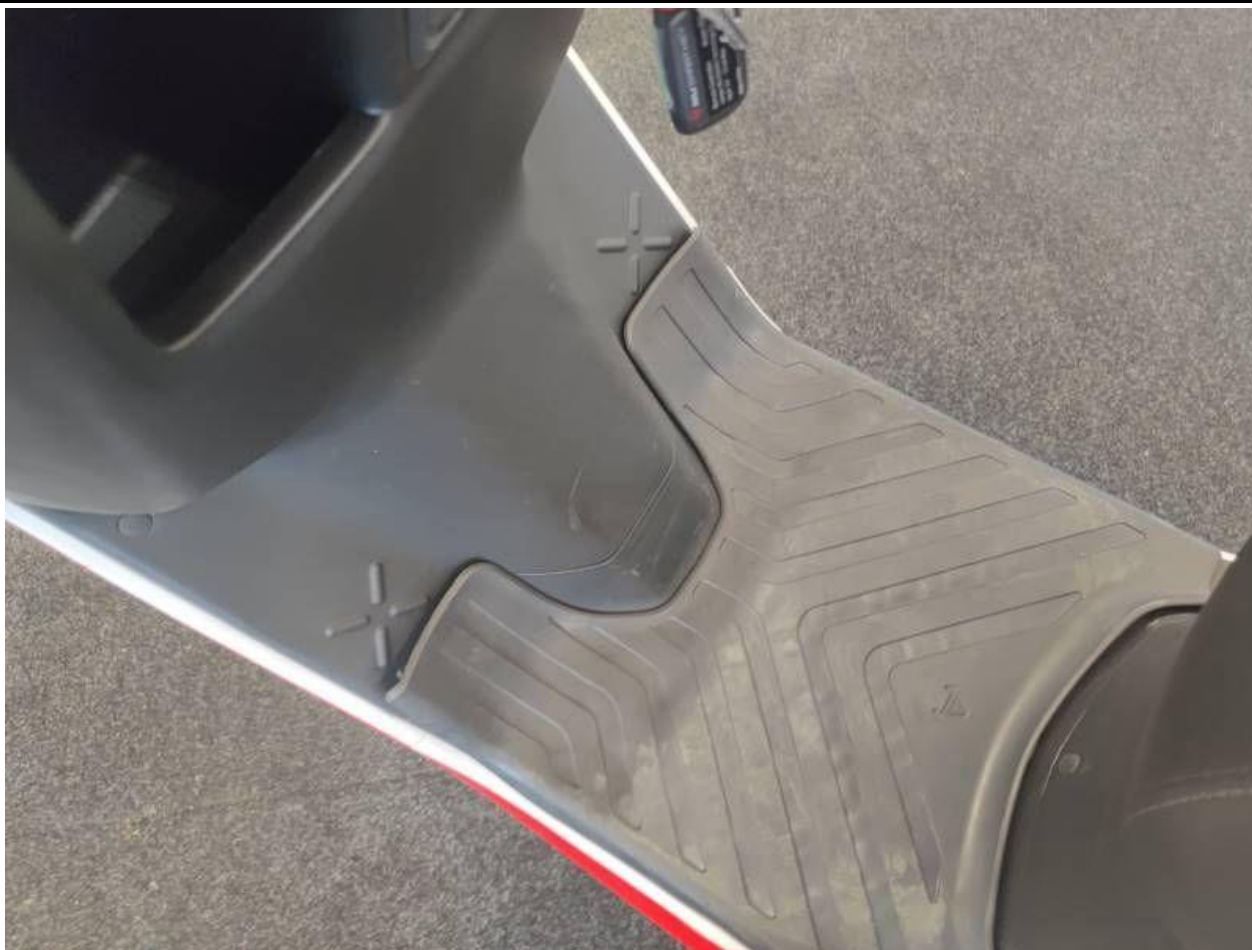
Fot. nr 53