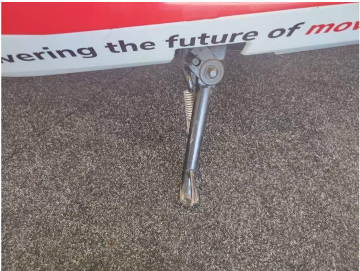
Fot. nr 41