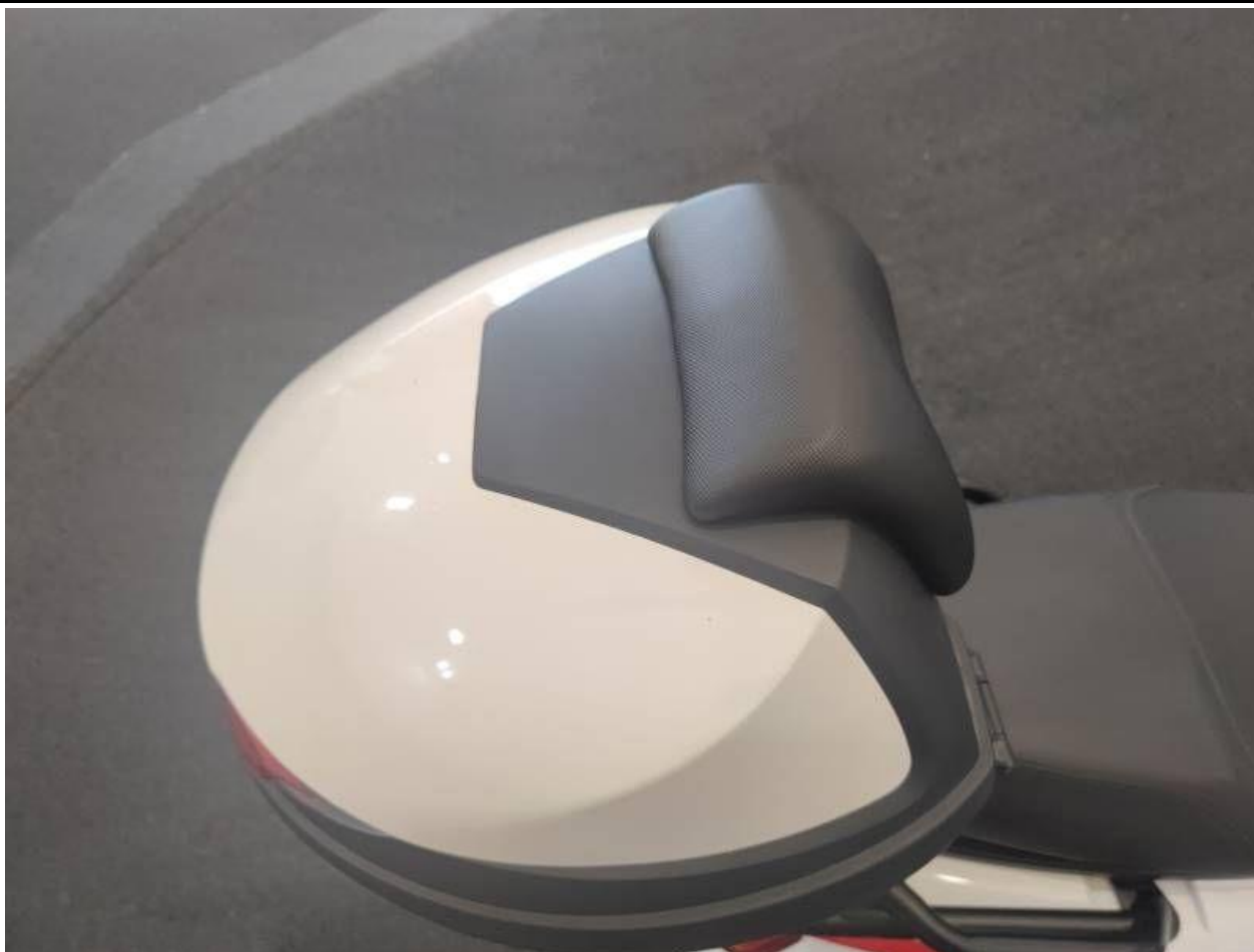
Fot. nr 55