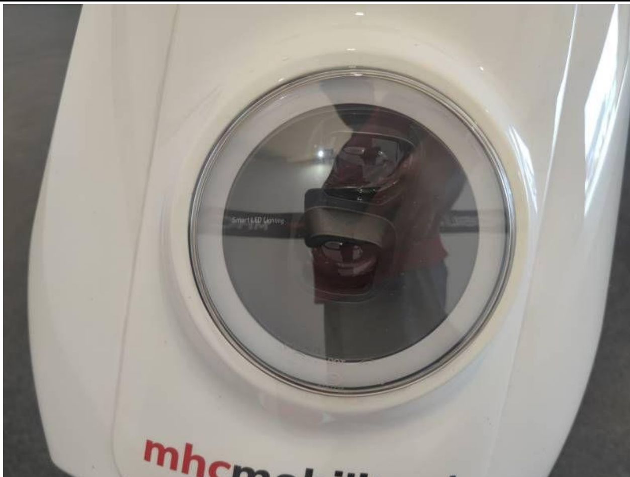
Fot. nr 25