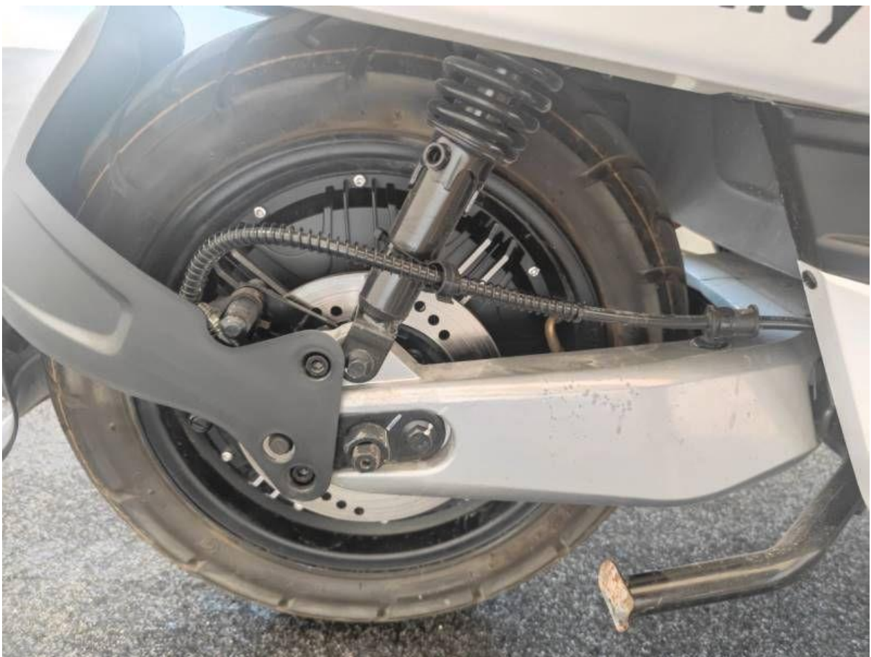
Fot. nr 22