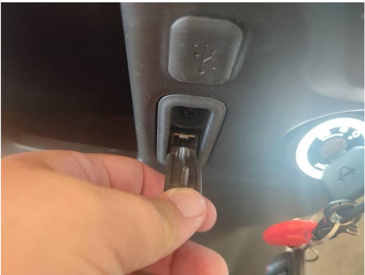
Fot. nr 20