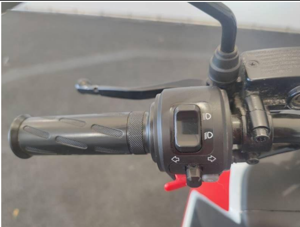
Fot. nr 17