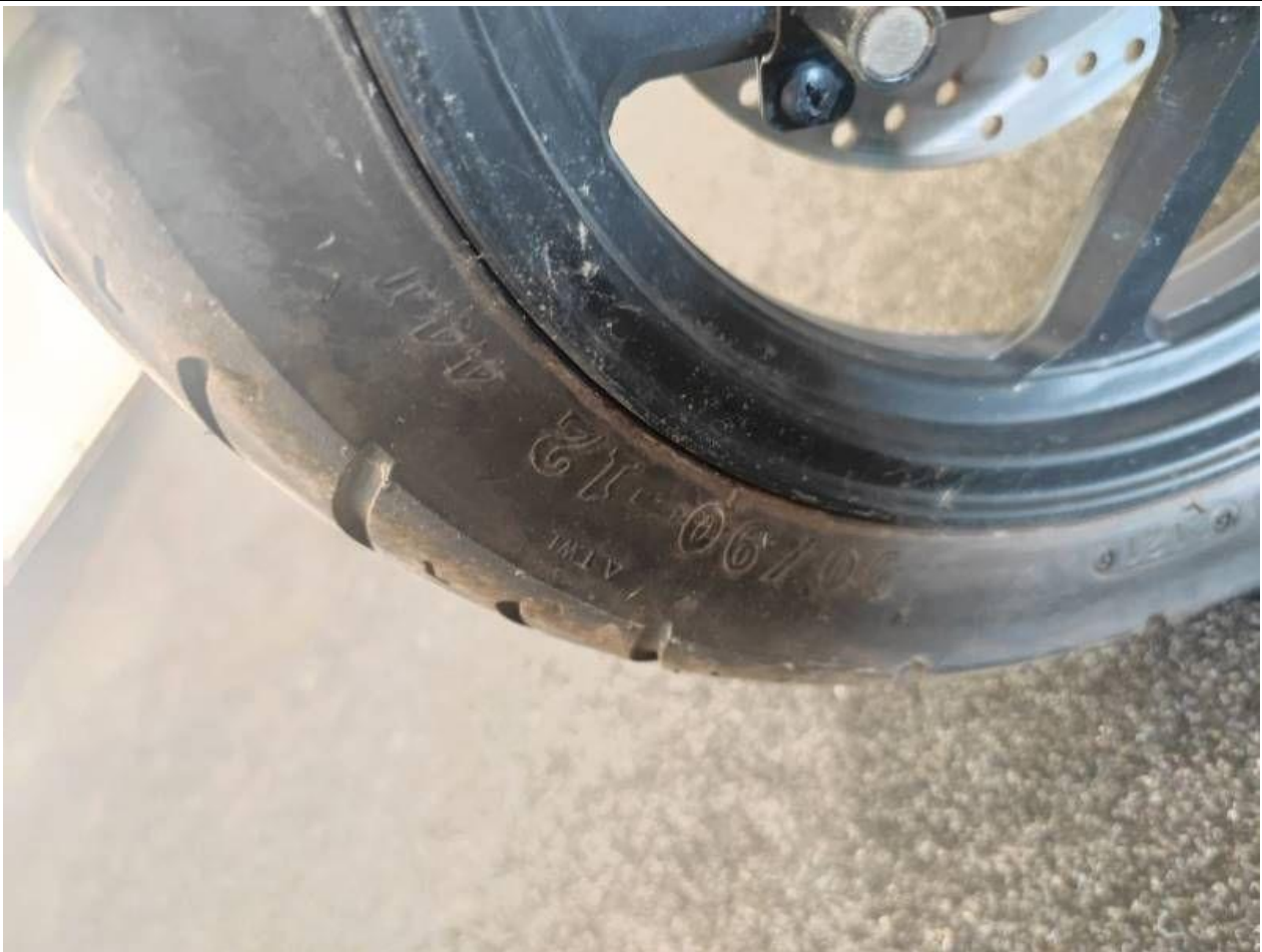
Fot. nr 29