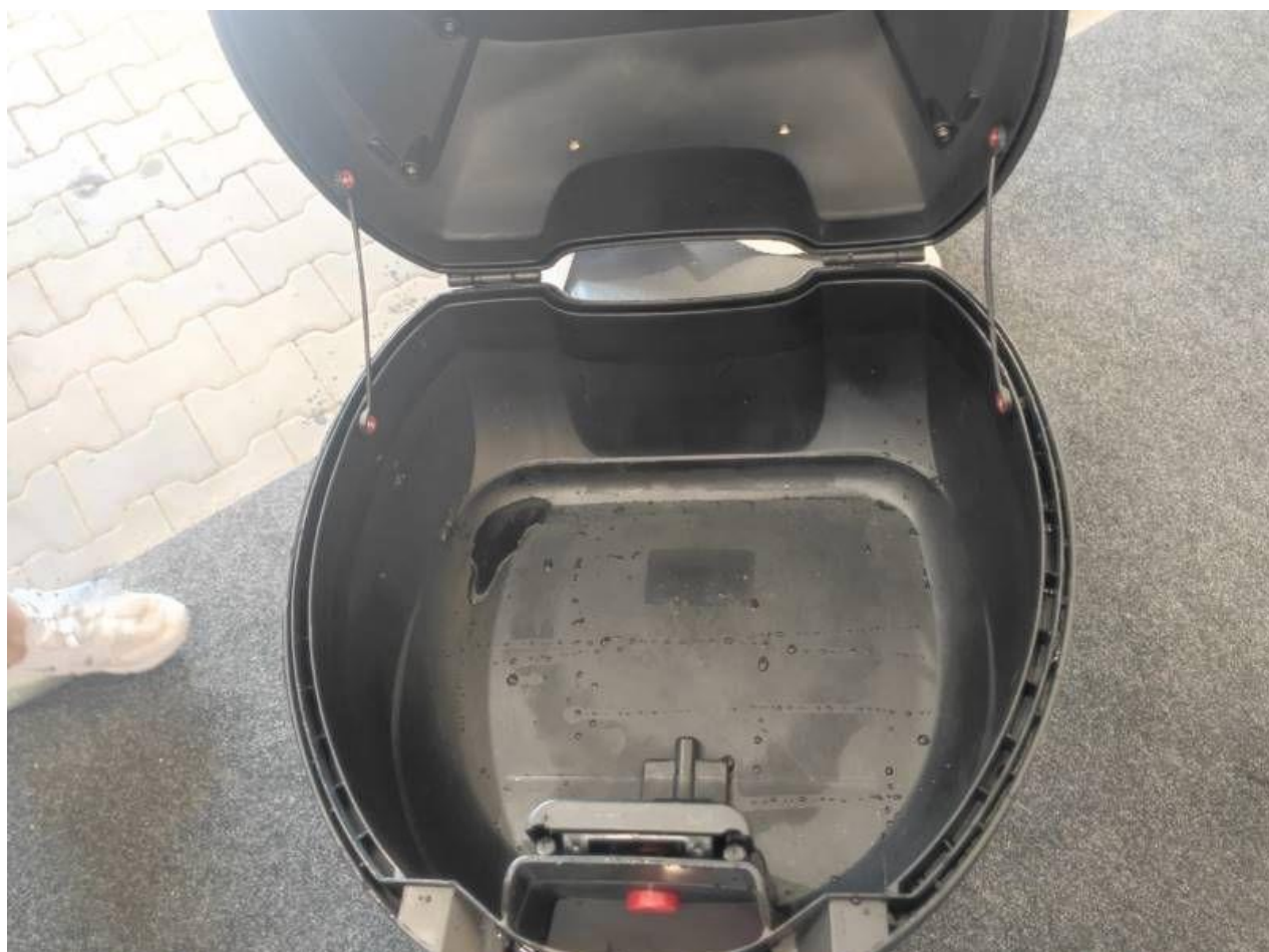
Fot. nr 16