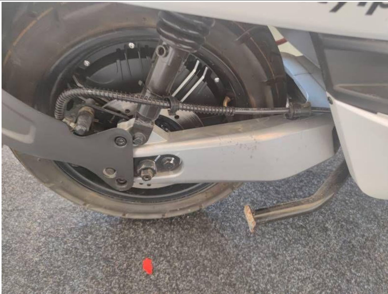
Fot. nr 45