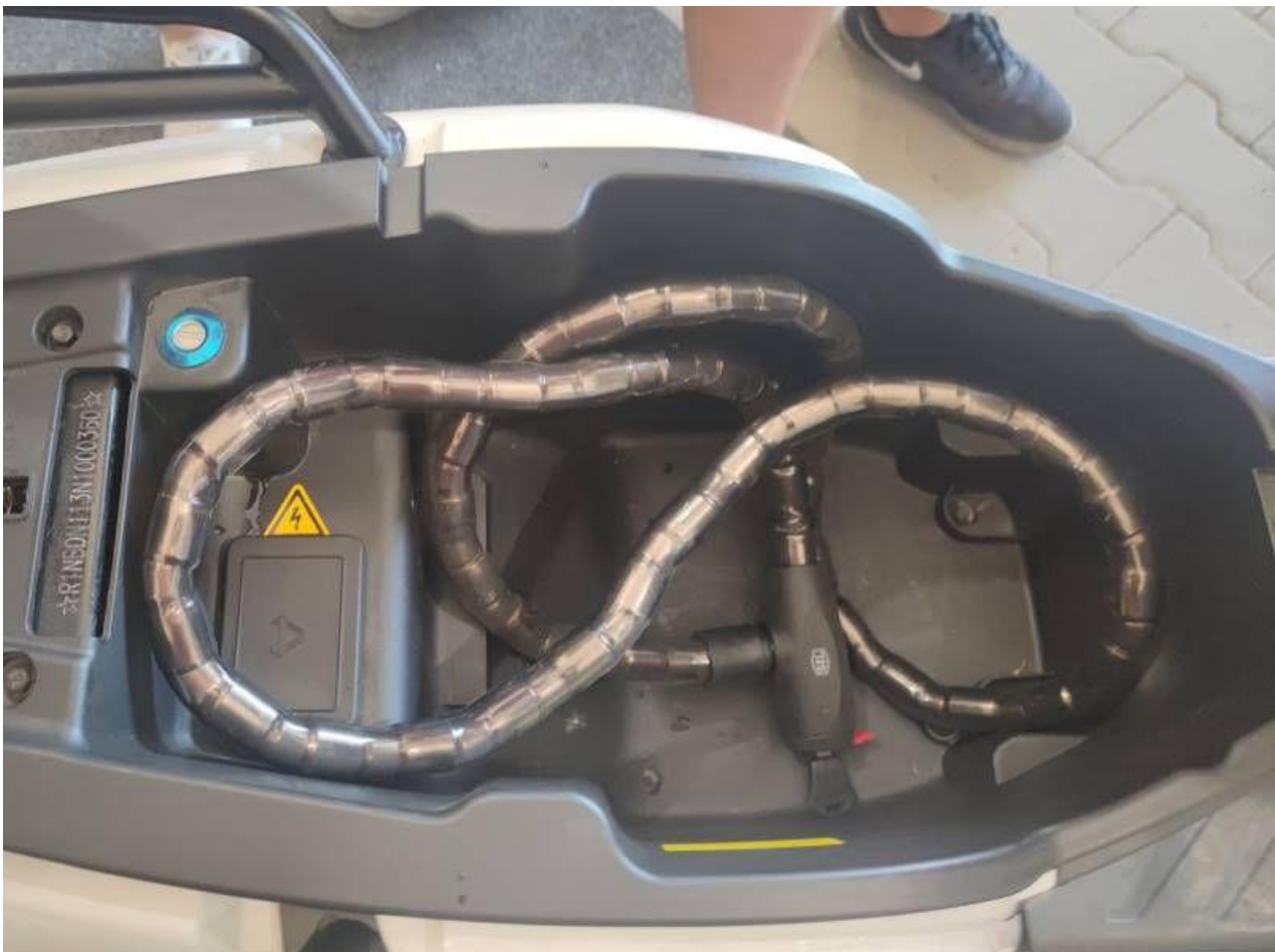
Fot. nr 12