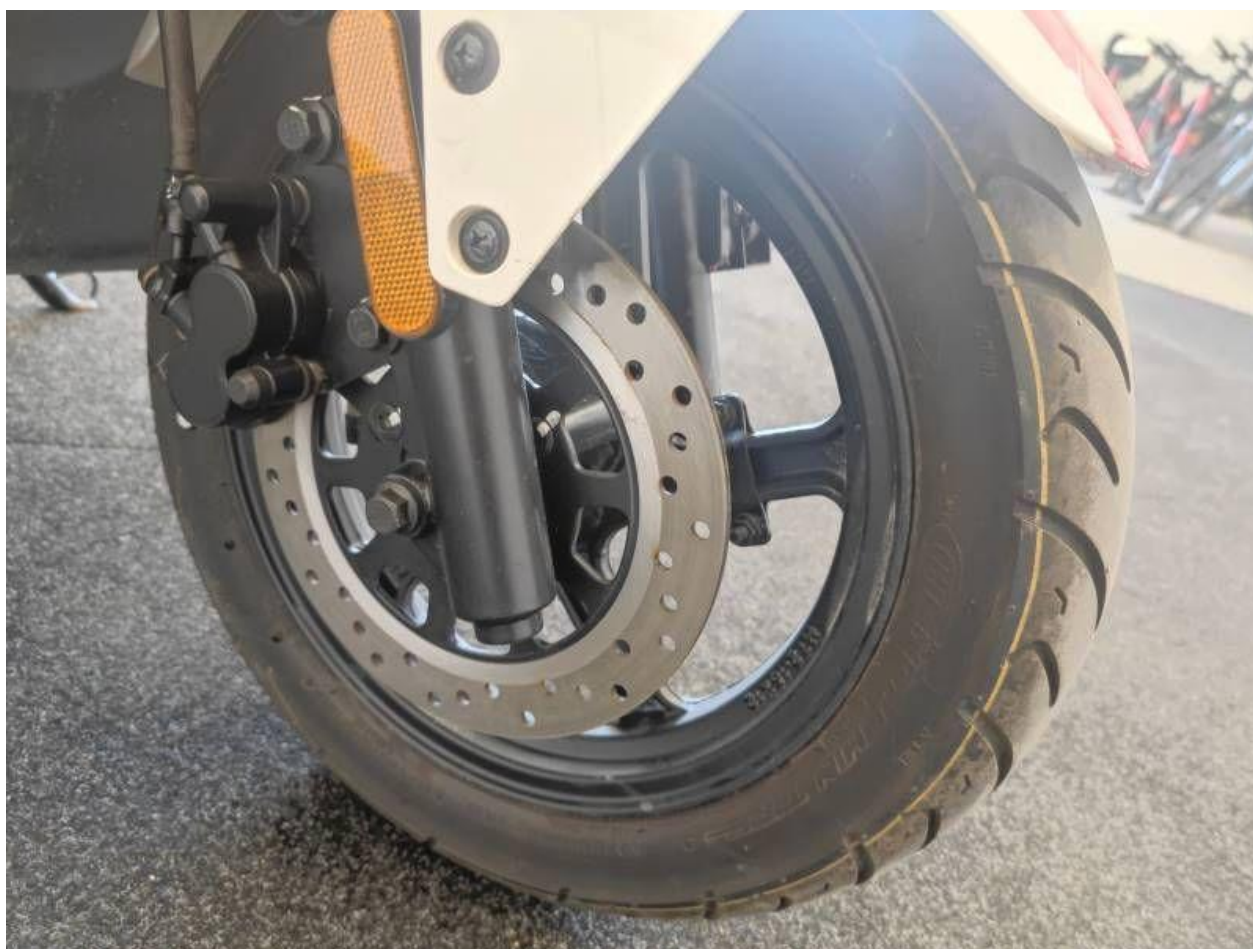
Fot. nr 26