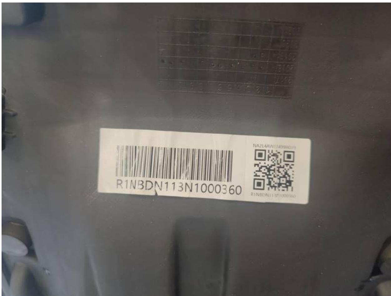
Fot. nr 14