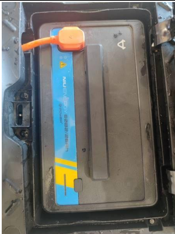
Fot. nr 15