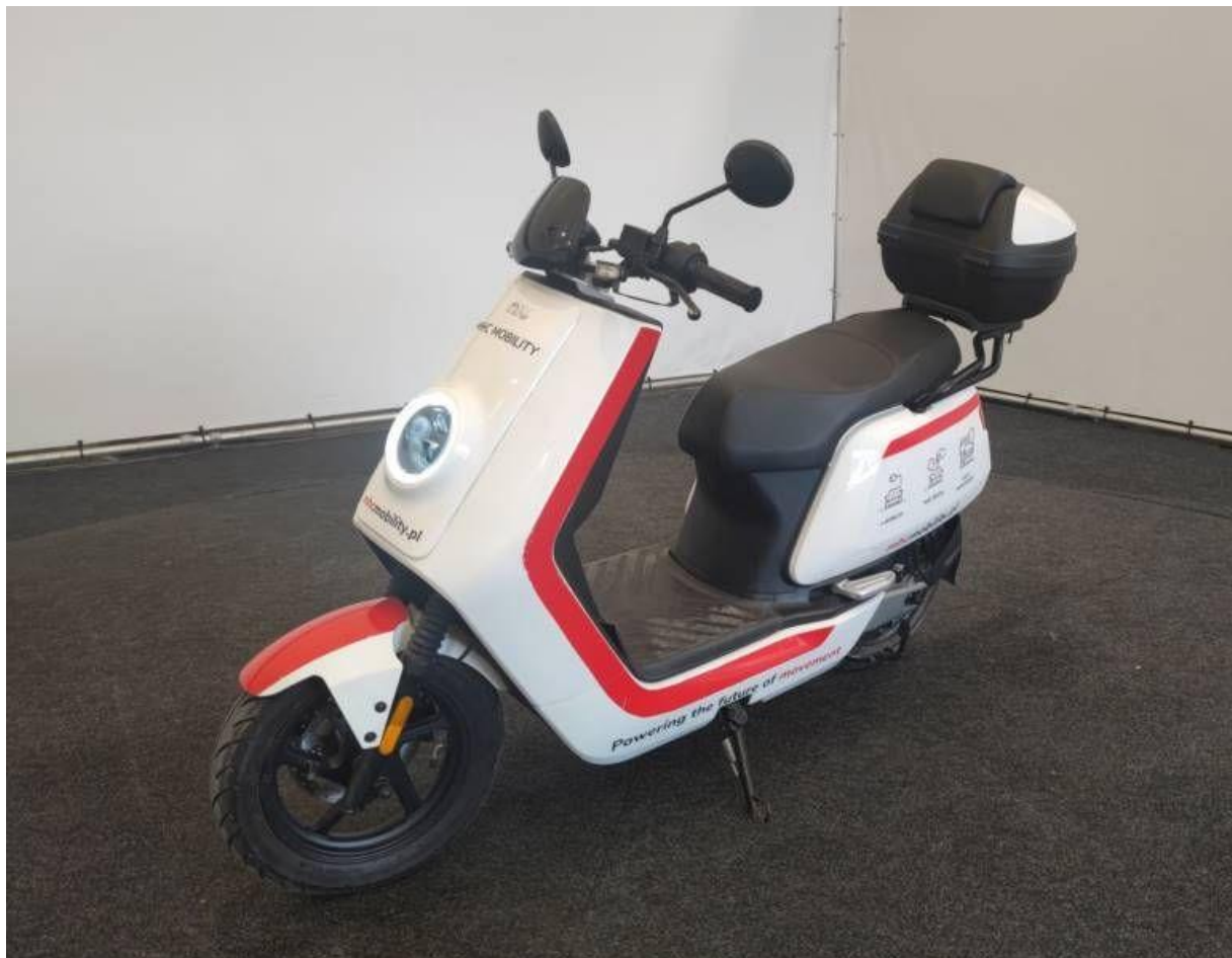
Fot. nr 1