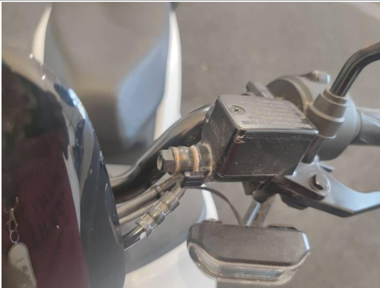
Fot. nr 37