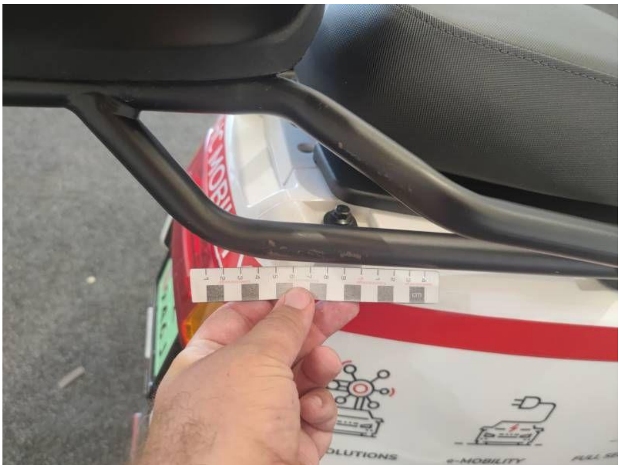
Fot. nr 52