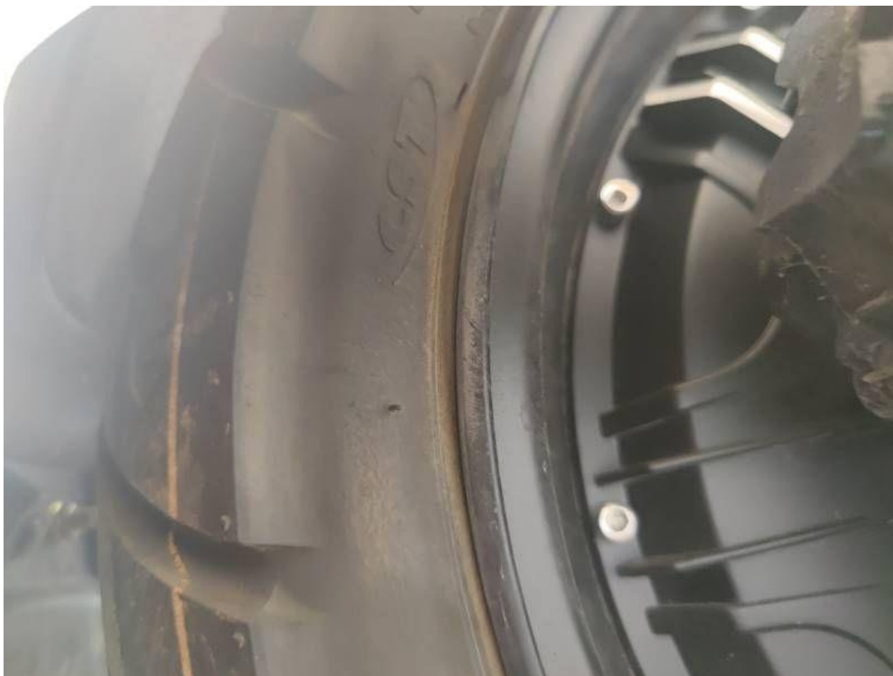
Fot. nr 32