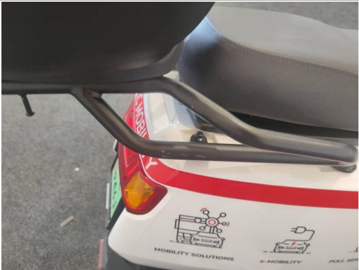
Fot. nr 51