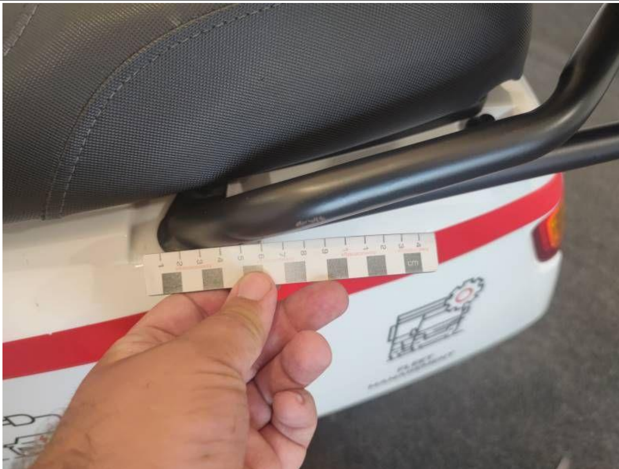
Fot. nr 43