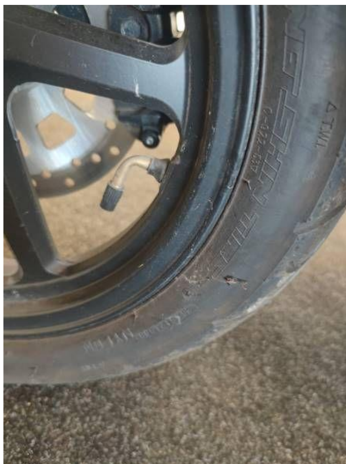
Fot. nr 28