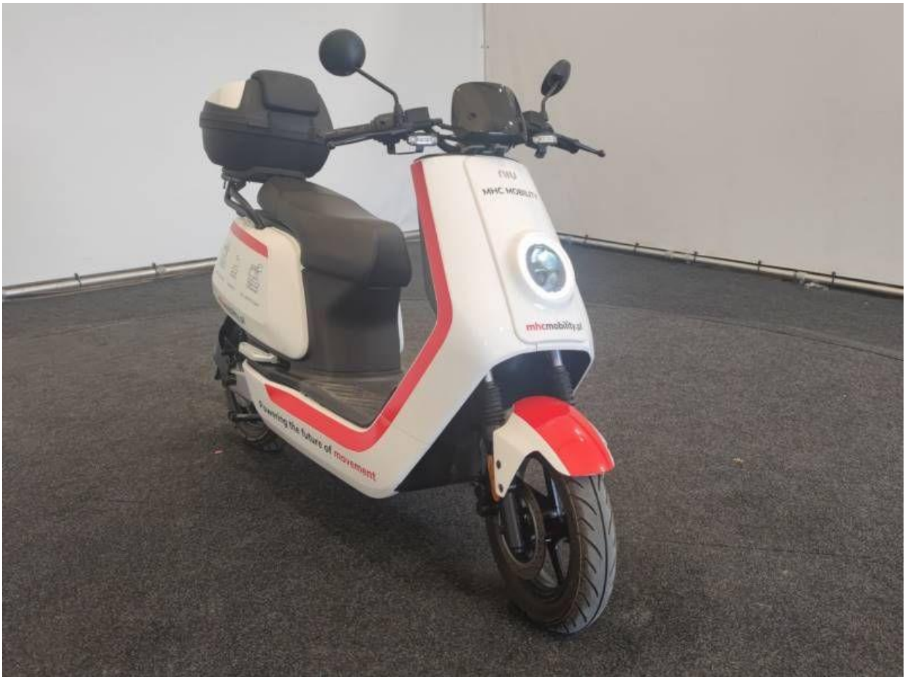
Fot. nr 5