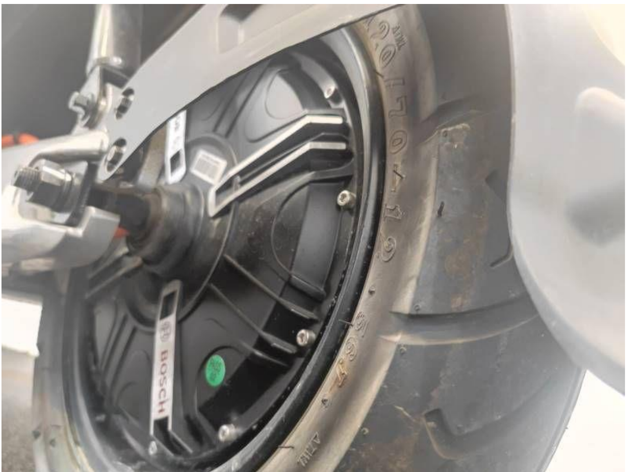
Fot. nr 30