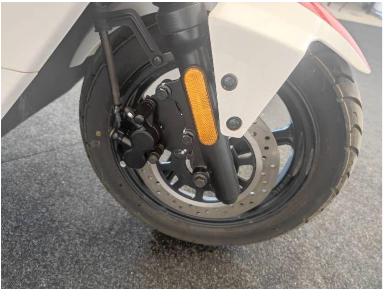
Fot. nr 23