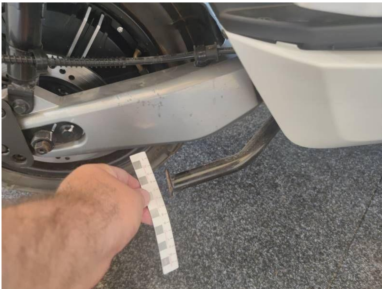
Fot. nr 46