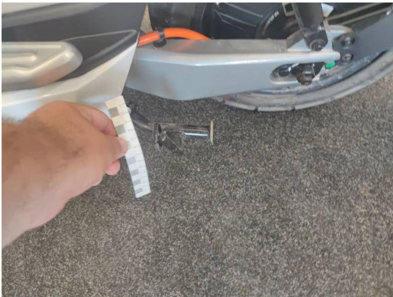
Fot. nr 44