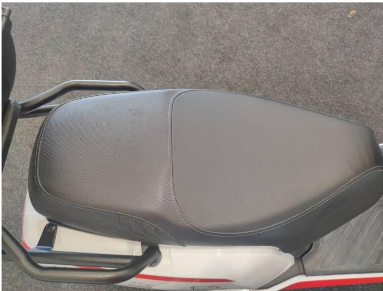
Fot. nr 54