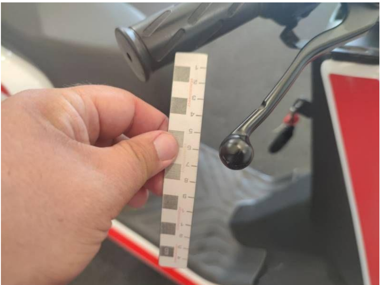
Fot. nr 50