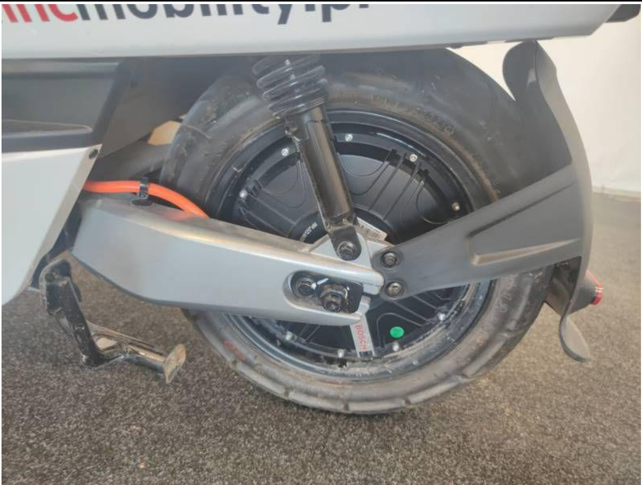
Fot. nr 21