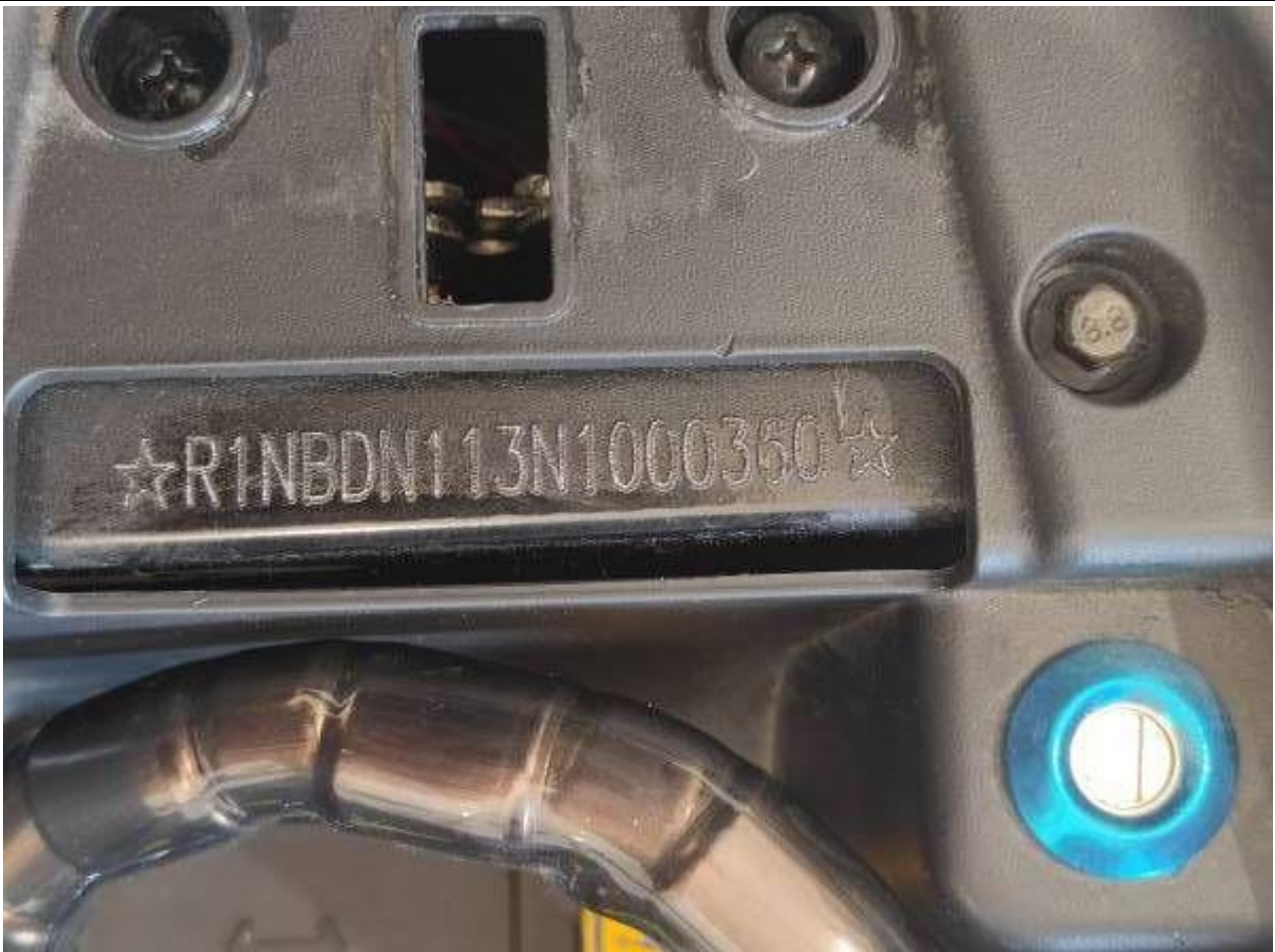
Fot. nr 9