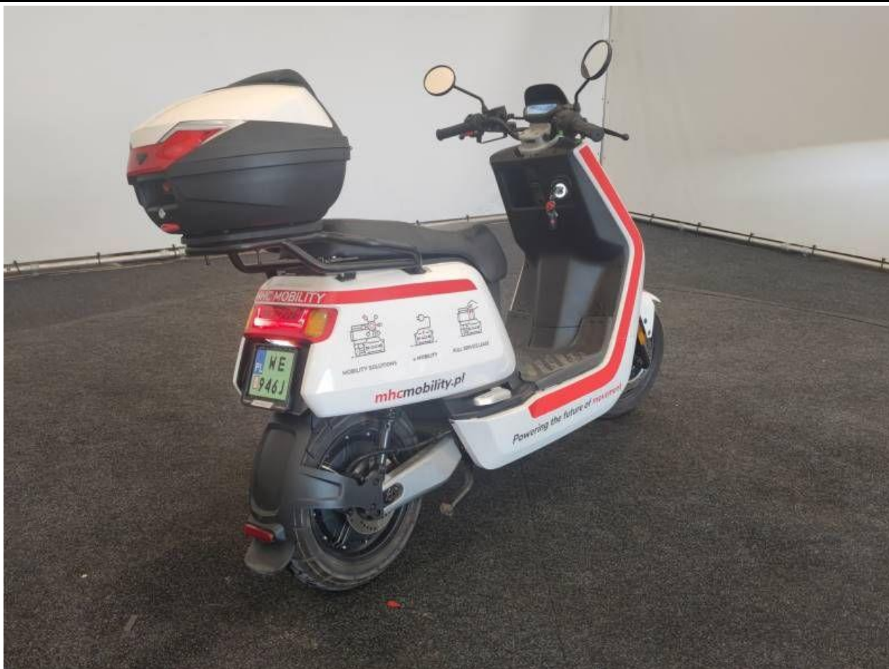
Fot. nr 7