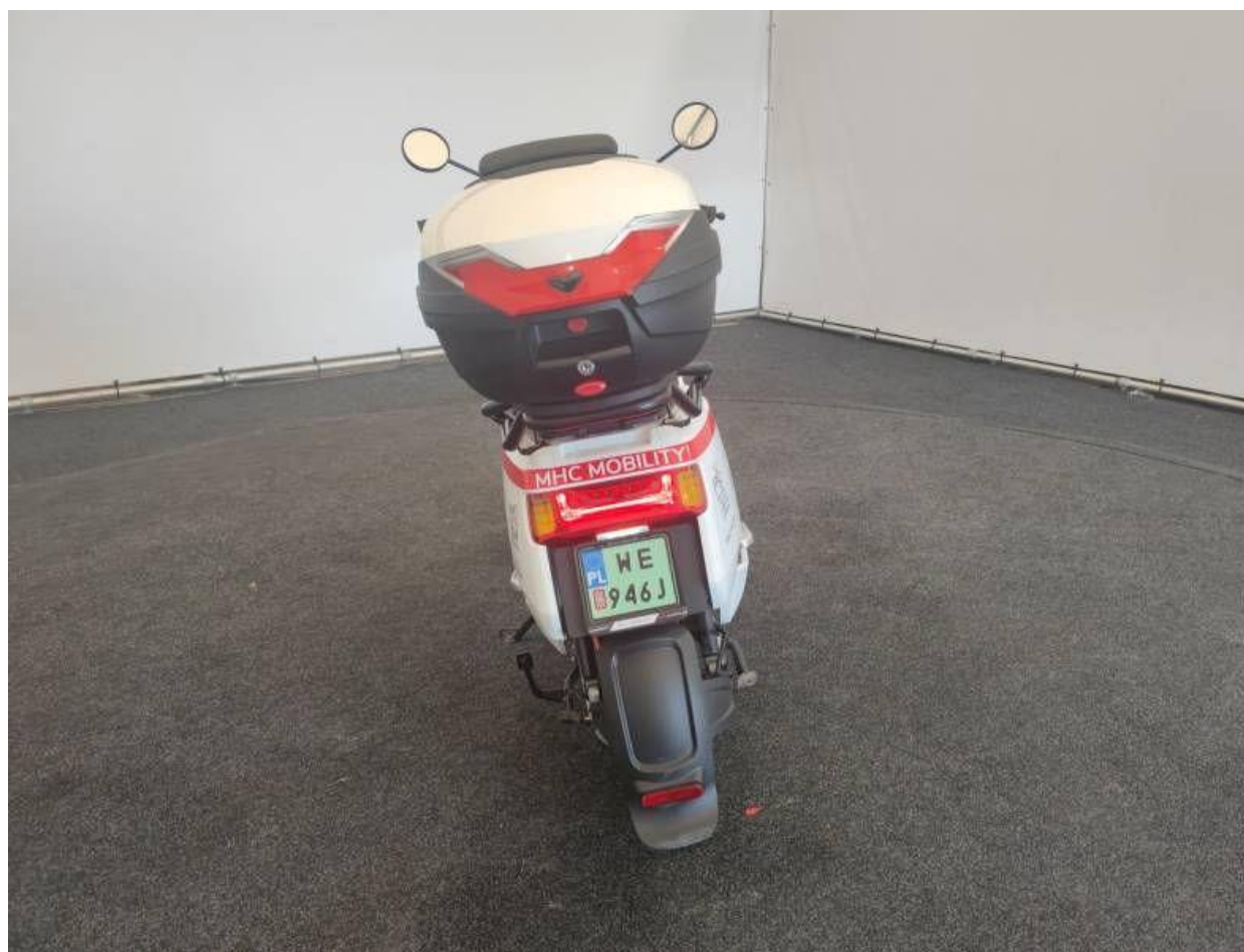
Fot. nr 8