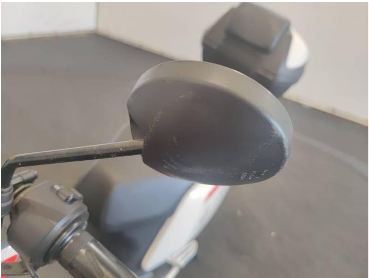
Fot. nr 35