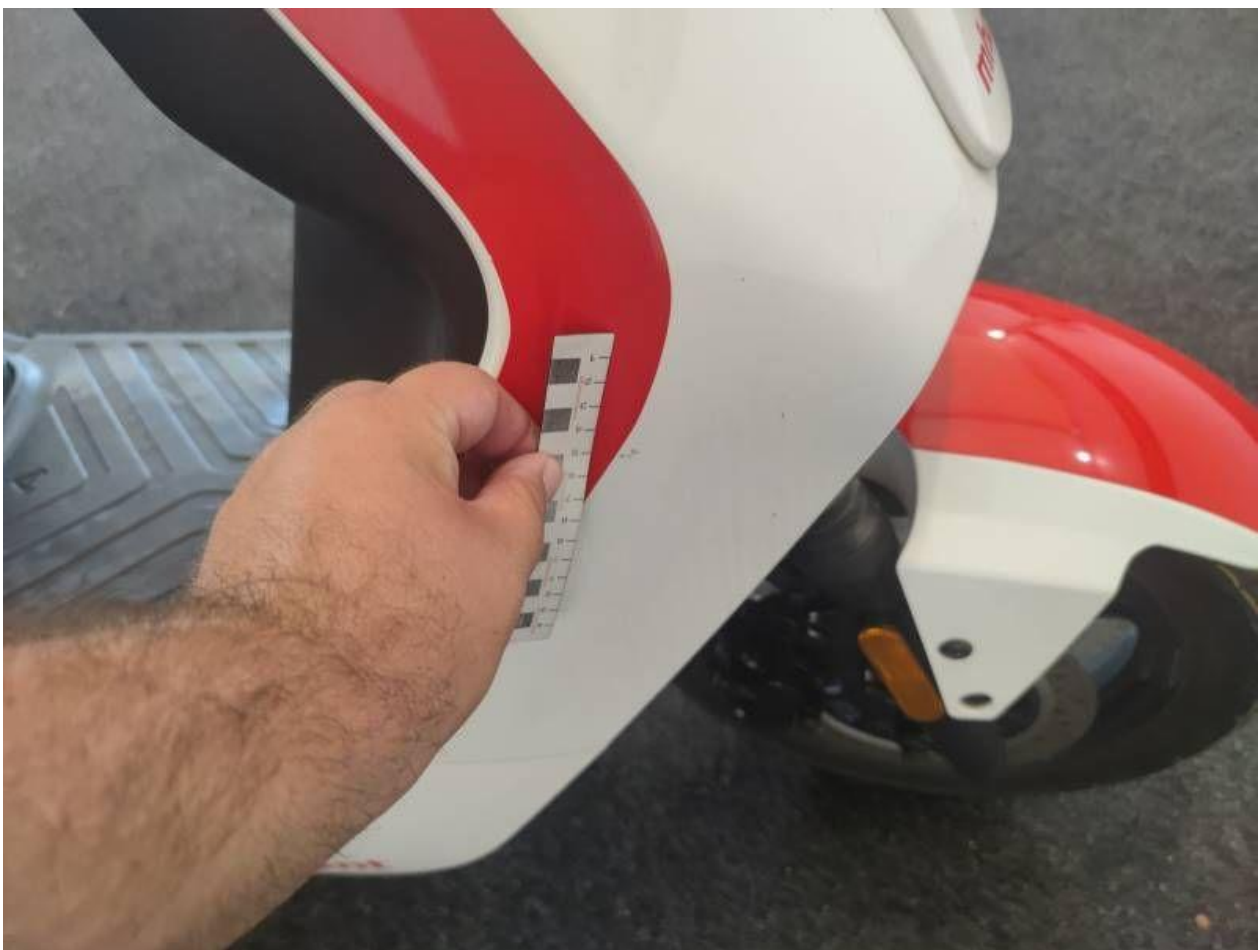
Fot. nr 48