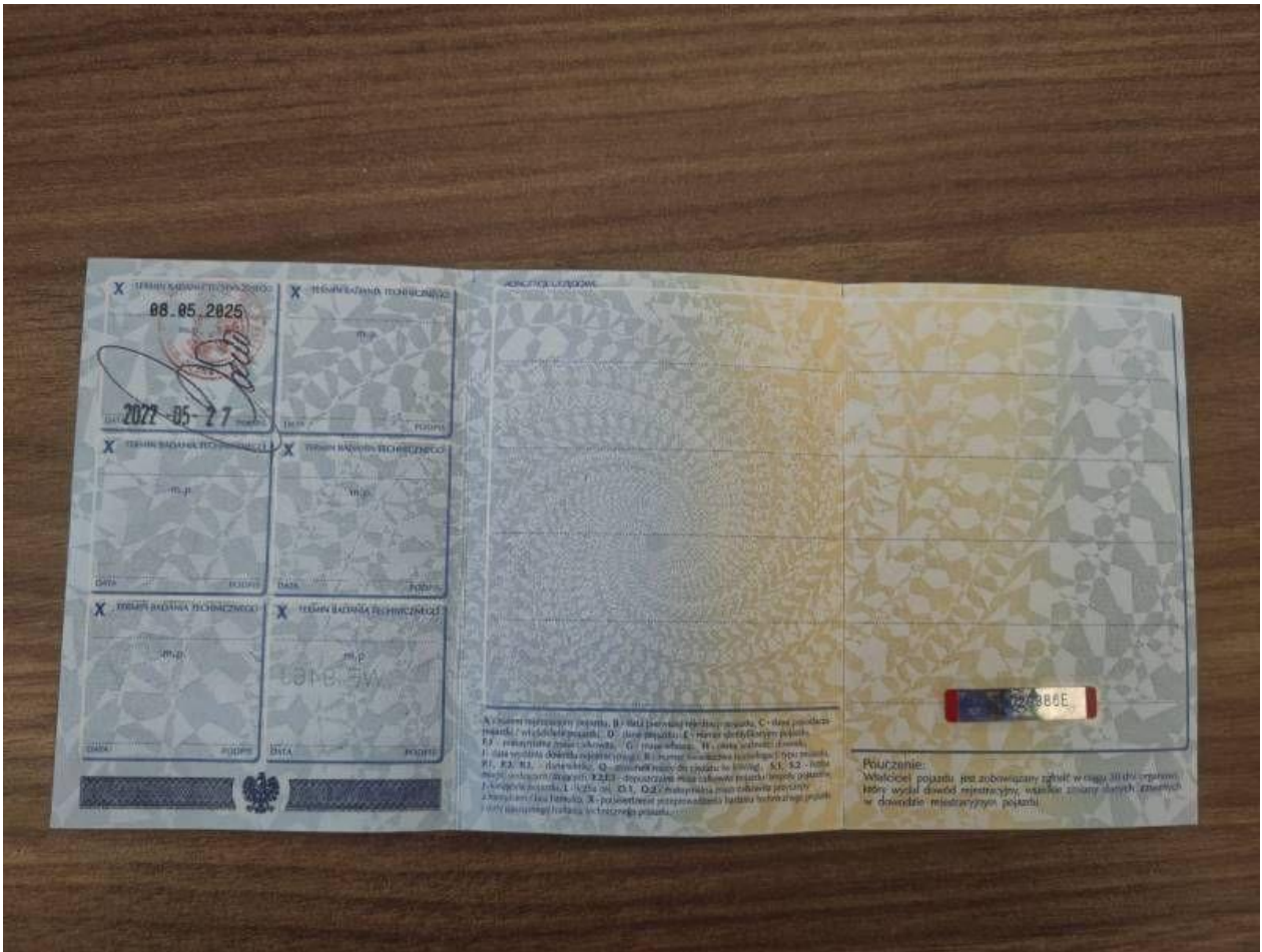
Fot. nr 57

Dokument wystawiony elektronicznie, wa ny bez podpisu