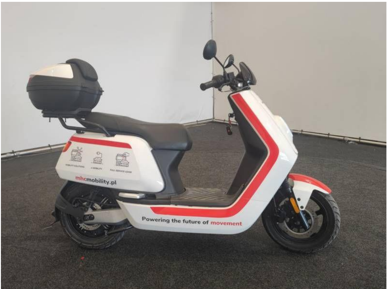
Fot. nr 6