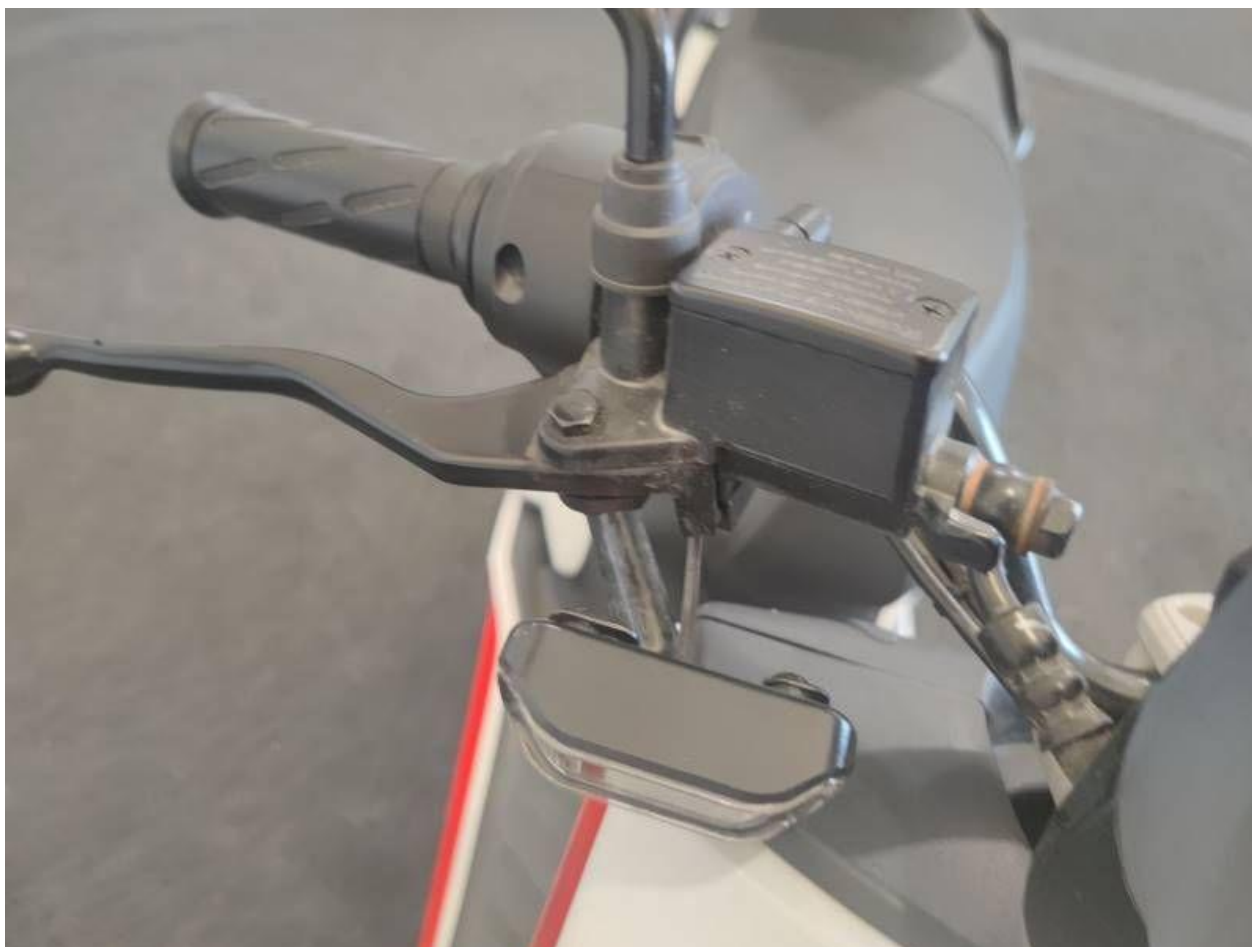
Fot. nr 38