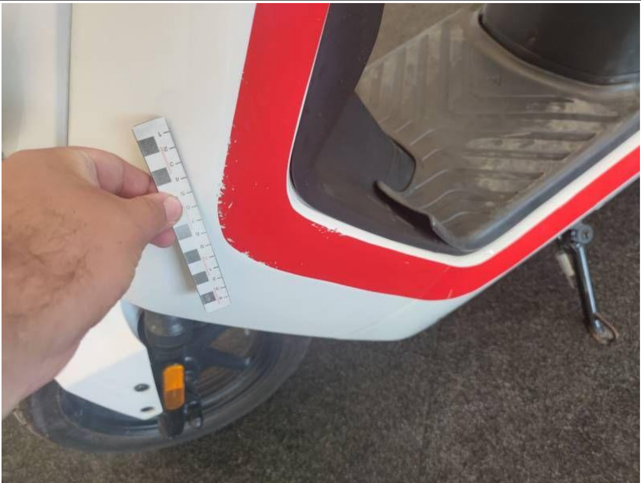
Fot. nr 39