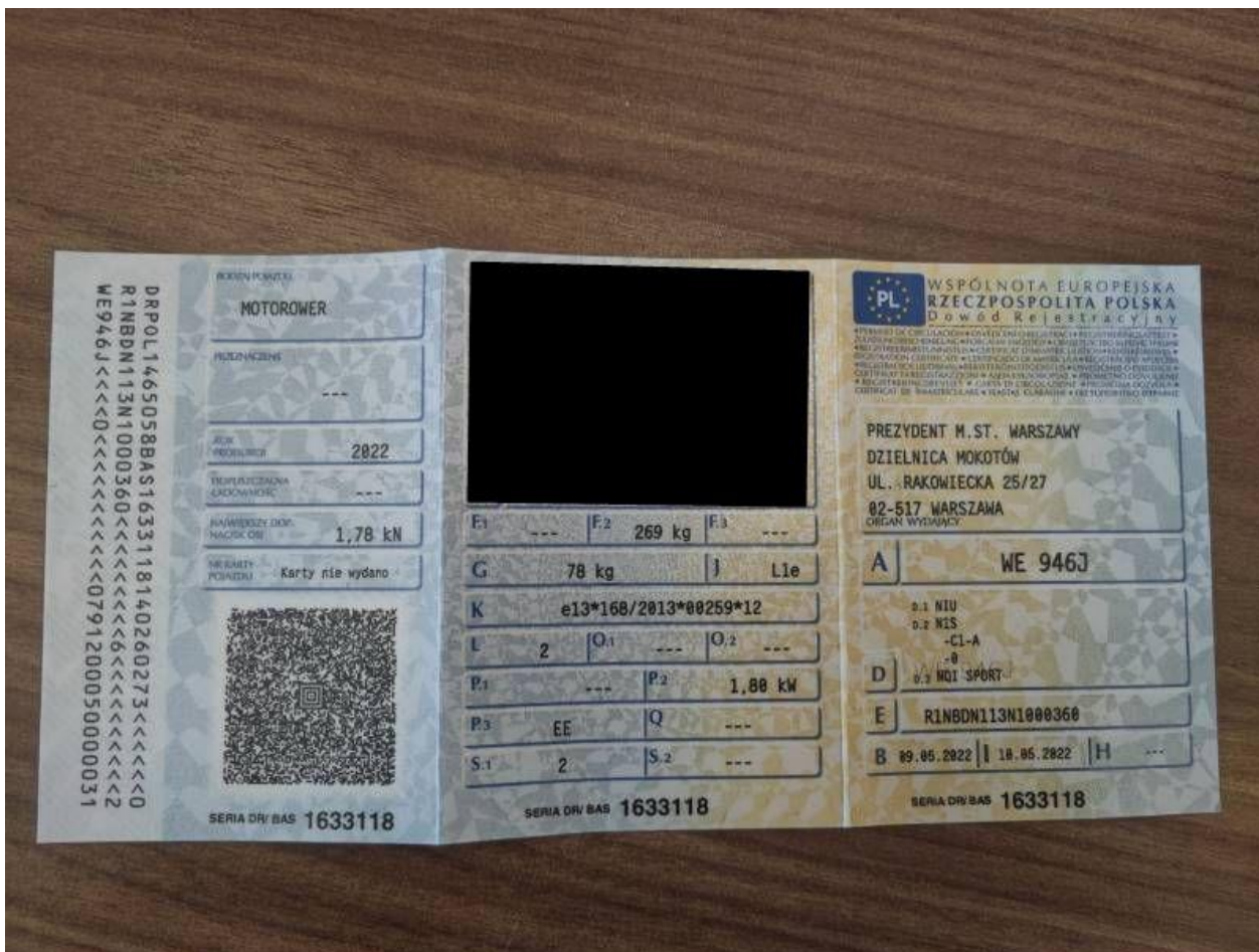
Fot. nr 56