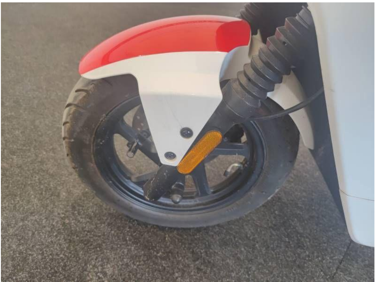
Fot. nr 24