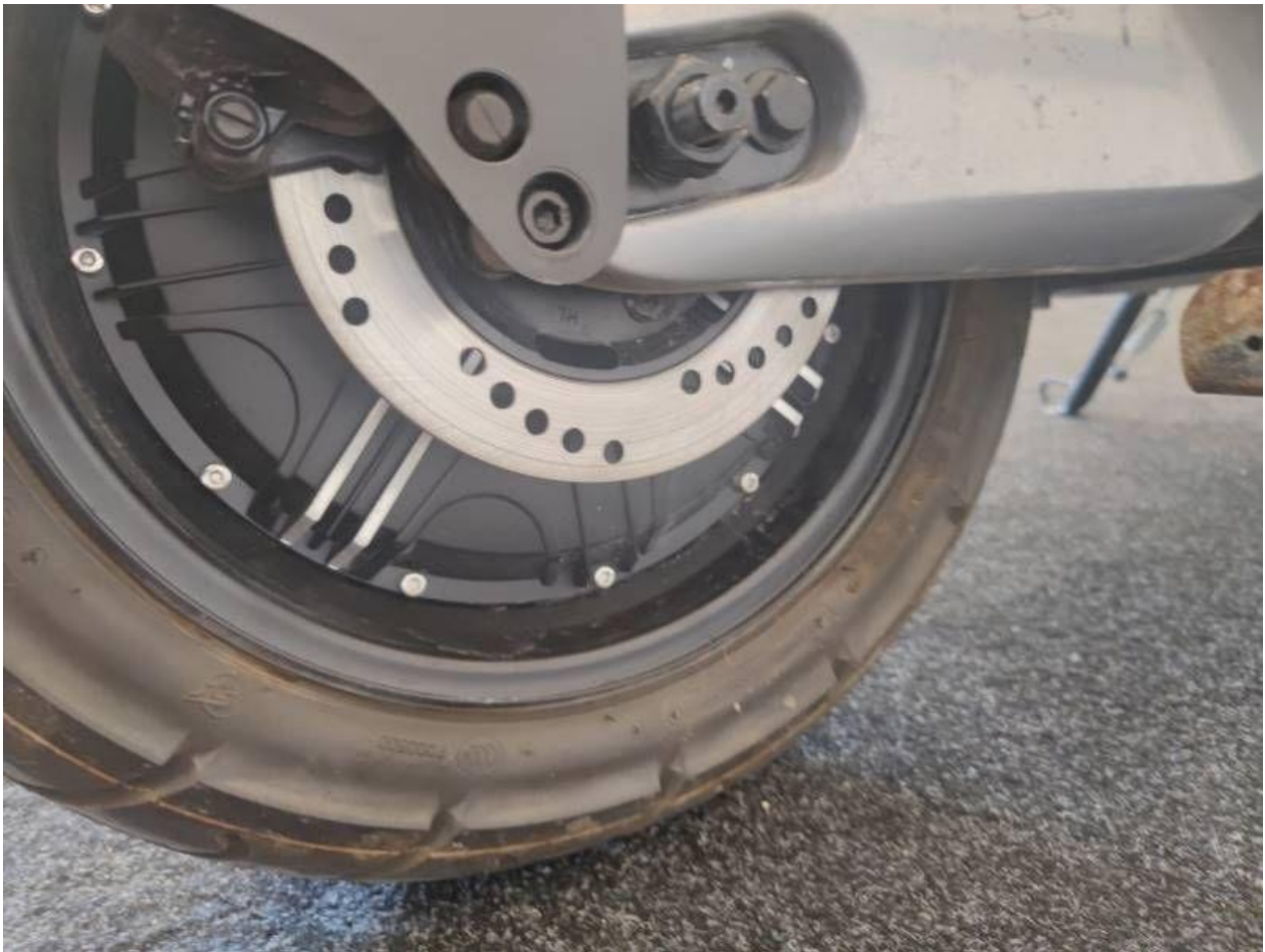
Fot. nr 33