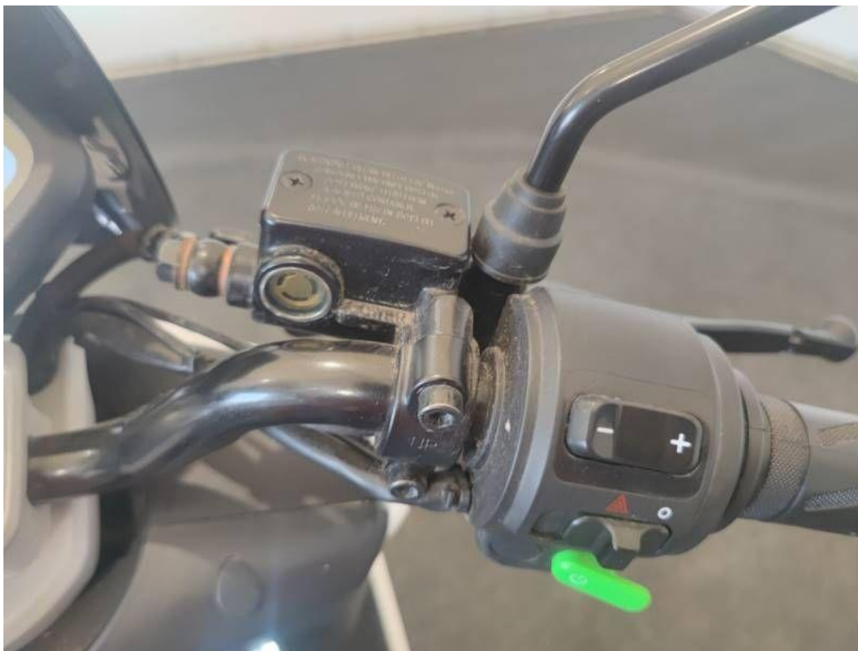
Fot. nr 18