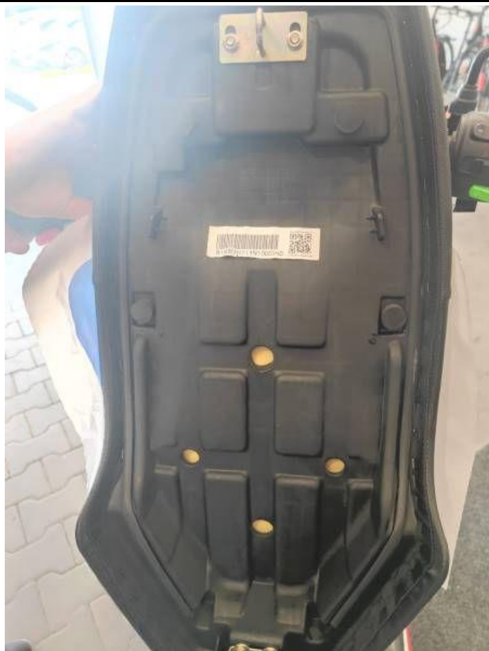
Fot. nr 13