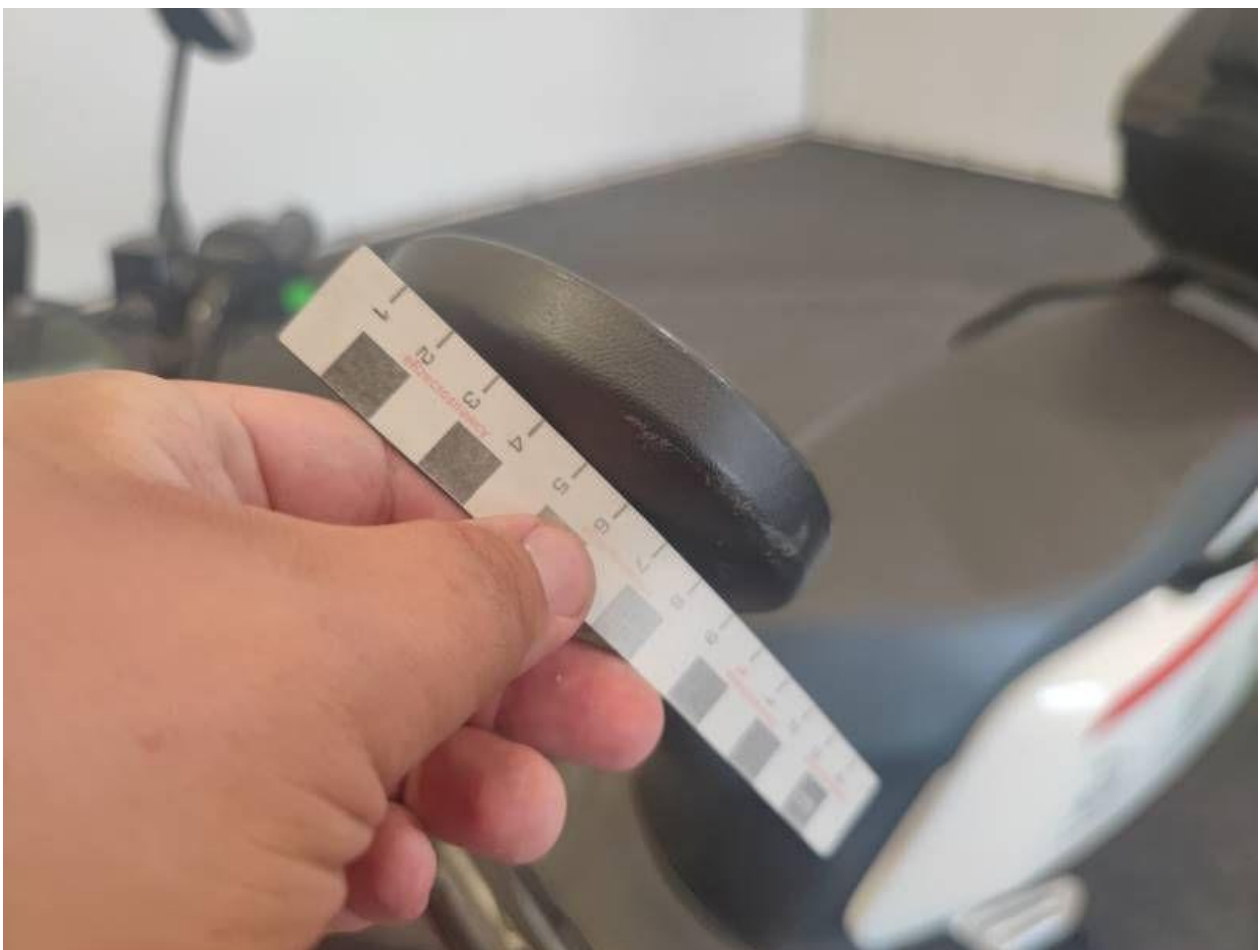
Fot. nr 36