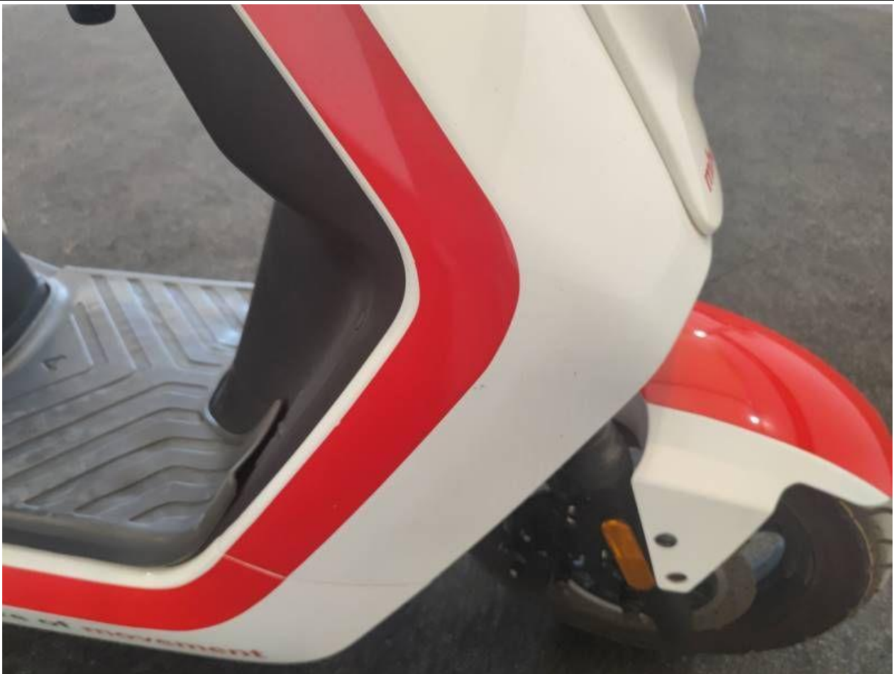
Fot. nr 47