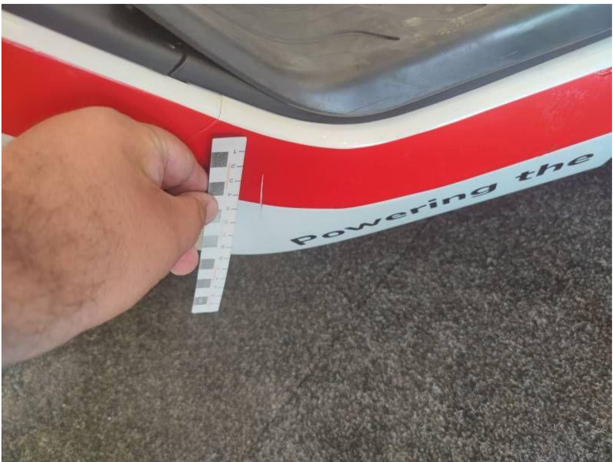
Fot. nr 40