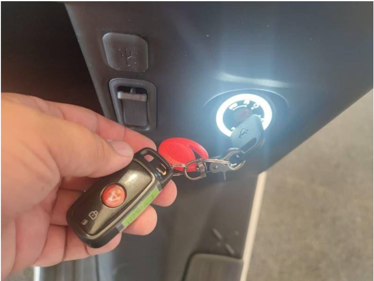
Fot. nr 19