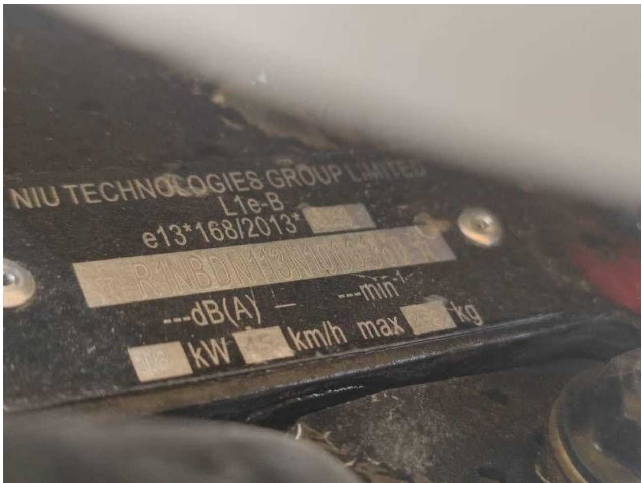
Fot. nr 10