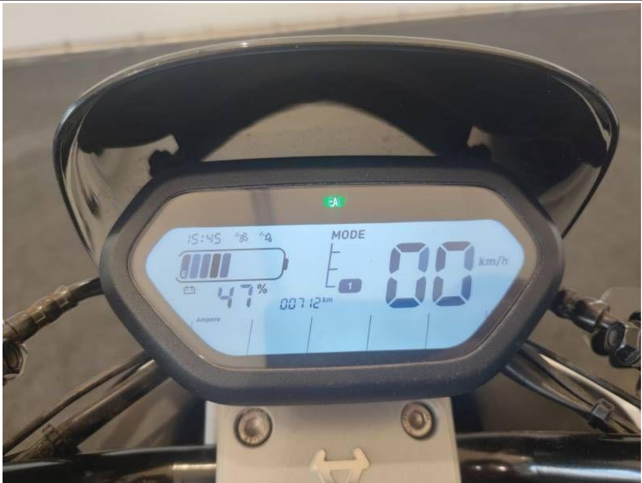
Fot. nr 11