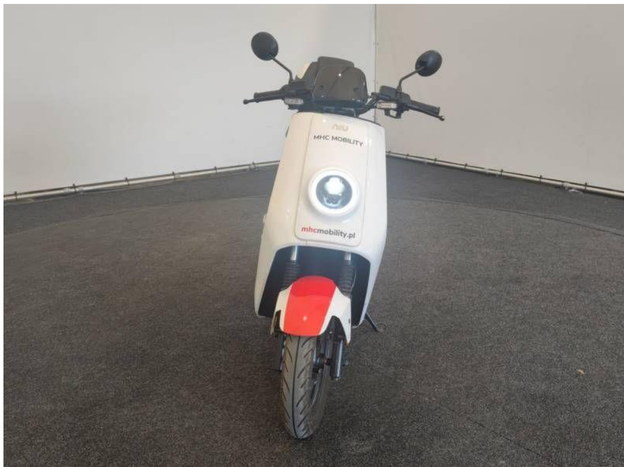
Fot. nr 4