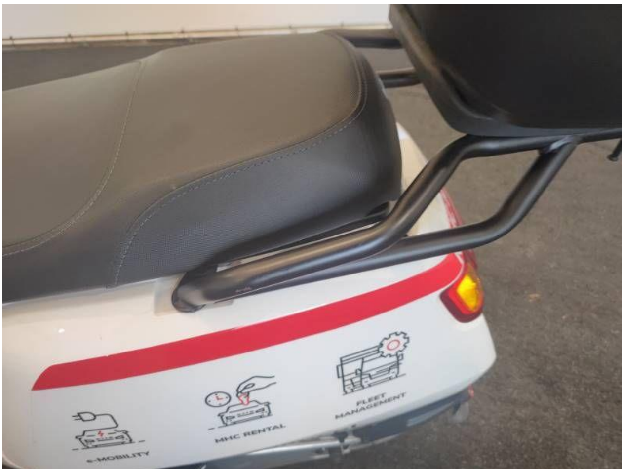
Fot. nr 42