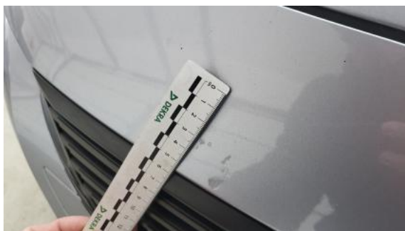
Fot. 37 Zderzak - Rysa/odprysk 1