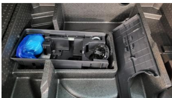
Fot. 35 Zdjęcie do protokołu