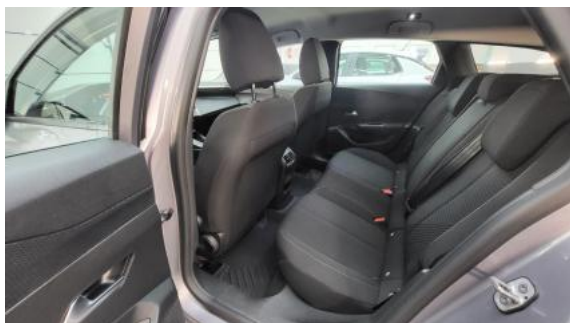
Fot. 17 Widok przez otwarte drzwi tylne lewe