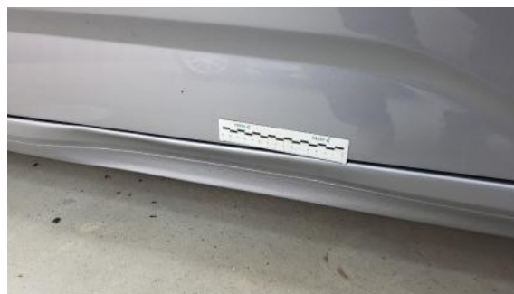
Fot. 38 Próg P - Wgniecenie/odkształcenie 1