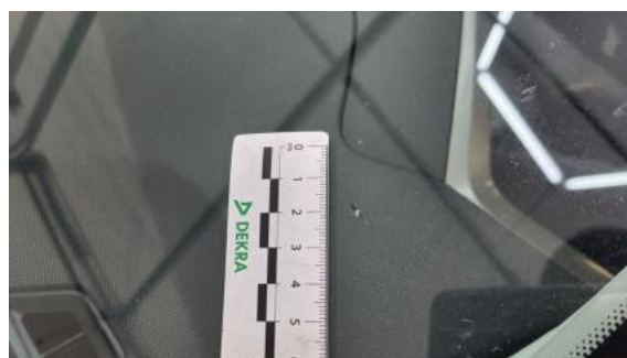
Fot. 36 Szyba czołowa - Pęknięcie/rozerwanie 1