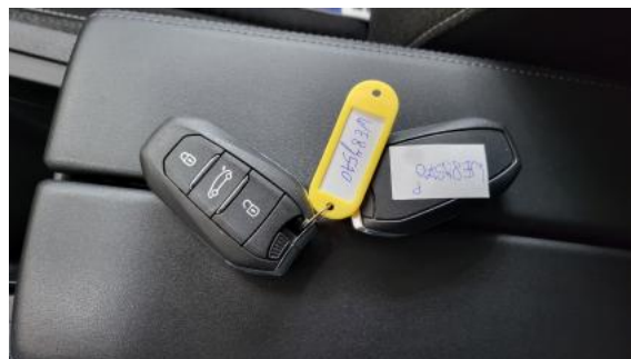
Fot. 34 Kluczyki