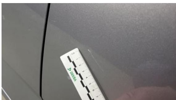
Fot. 39 Drzwi tylne L - Rysa/odprysk 1