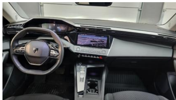
Fot. 18 Widok z tylnej kanapy na deskę rozd.