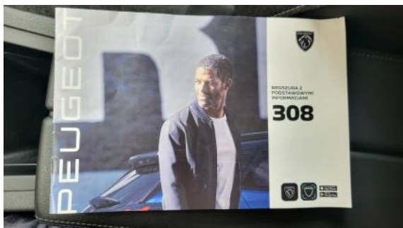
Fot. 33 Instrukcje