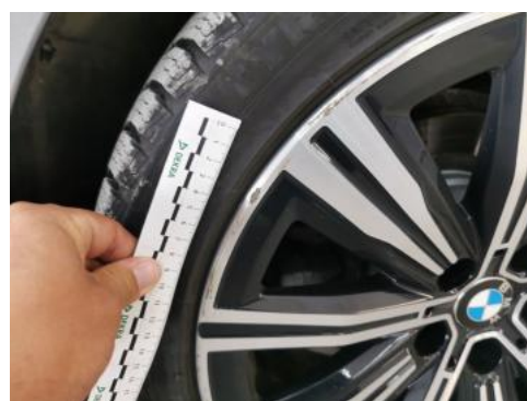
Fot. 44 Felga aluminiowa tylna L - Rysa/odprysk 1