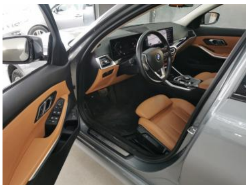
Fot. 17 Widok przez otwarte drzwi przednie lewe