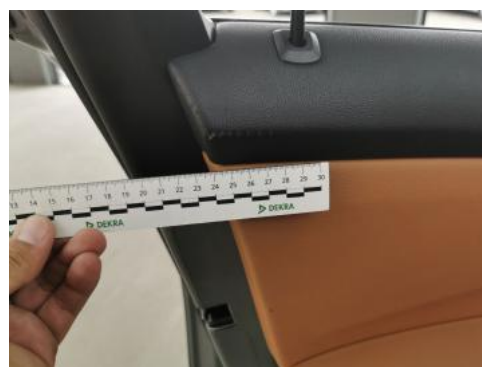
Fot. 46 Tapicerka drzwi przednich L - Pęknięcie/rozerwanie 1