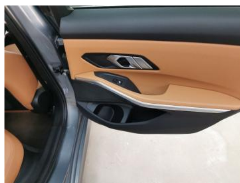
Fot. 48 Tapicerka drzwi tylnych P - zdjęcie poglądowe 1