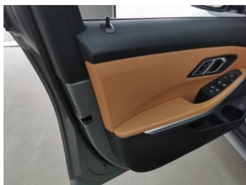
Fot. 45 Tapicerka drzwi przednich L - zdjęcie poglądowe 1