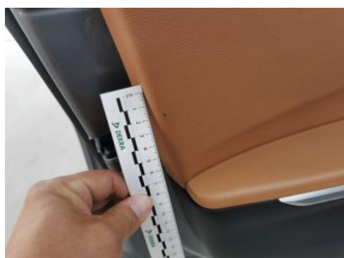
Fot. 47 Tapicerka drzwi przednich L - Pęknięcie/rozerwanie 2