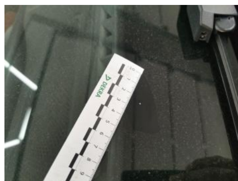
Fot. 38 Szyba czołowa - Rysa/odprysk 1