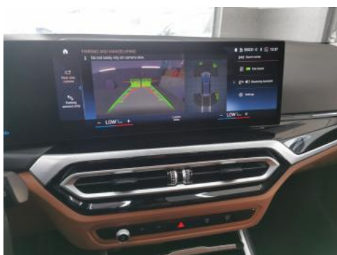
Fot. 37 Zdjęcie do protokołu