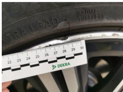
Fot. 41 Felga aluminiowa tylna P - Pęknięcie/rozerwanie 1