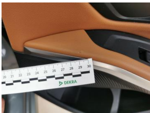
Fot. 49 Tapicerka drzwi tylnych P - Pęknięcie/rozerwanie 1