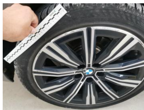
Fot. 40 Felga aluminiowa tylna P - Rysa/odprysk 1