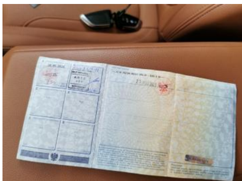
Fot. 33 Dowód rej. str. 2