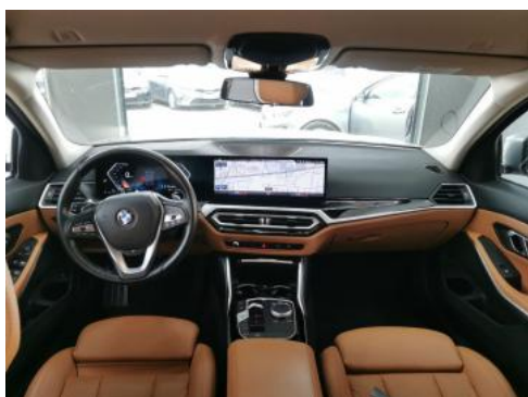
Fot. 19 Widok z tylnej kanapy na deskę rozdzielczą