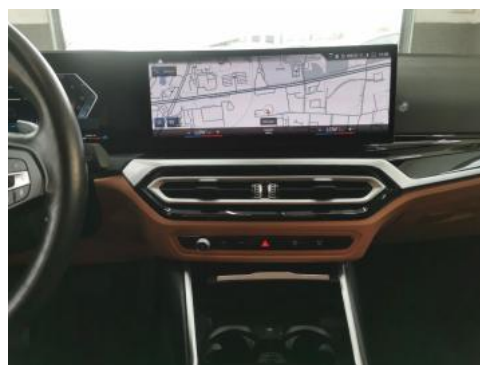
Fot. 20 Konsola środkowa