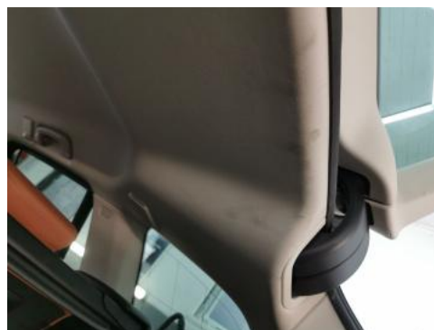
Fot. 50 Podsufitka - Inne 1