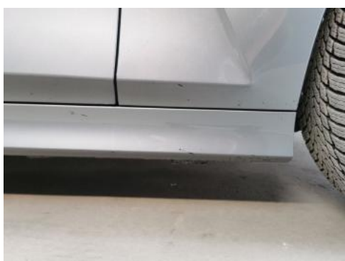
Fot. 39 Próg P - Inne 1