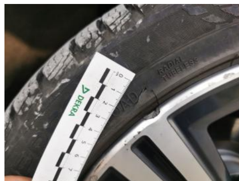
Fot. 42 Opona tylna P - Pęknięcie/rozerwanie 1