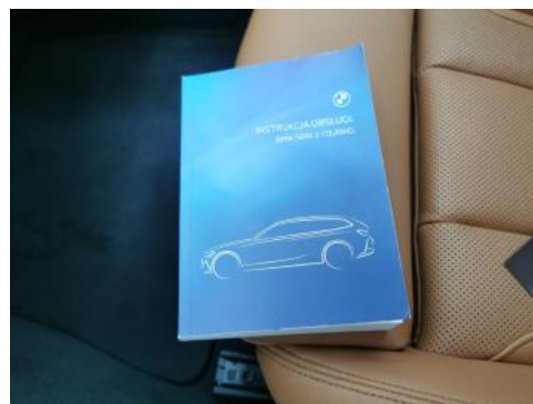
Fot. 34 Instrukcje