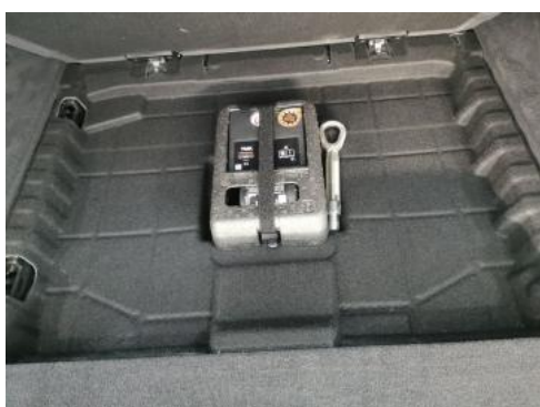
Fot. 35 Zestaw naprawczy koła