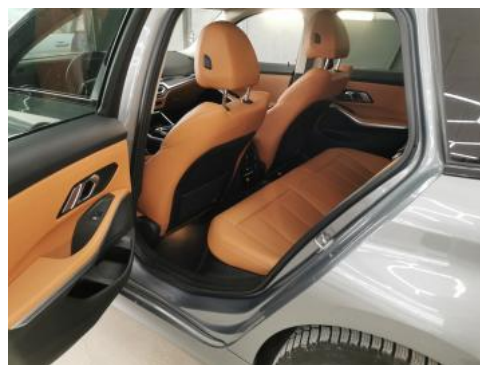
Fot. 18 Widok przez otwarte drzwi tylne lewe