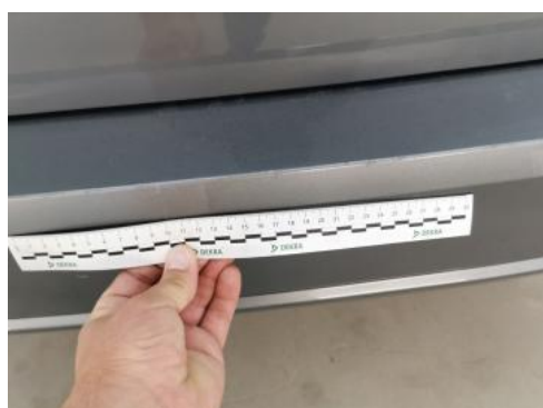
Fot. 43 Zderzak tylny - Rysa/odprysk 1