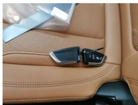
Fot. 36 Kluczyki