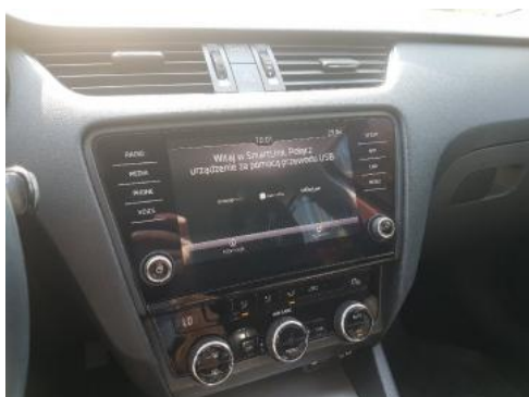
Fot. 13 Konsola środkowa