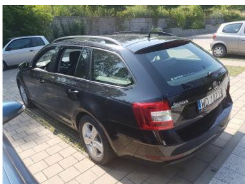
Fot. 5 Lewy bok tył