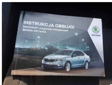
Fot. 24 Instrukcja obsługi