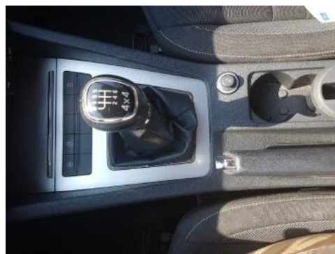
Fot. 14 Tunel środkowy