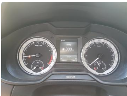
Fot. 9 Wskaźniki /przebieg/paliwo