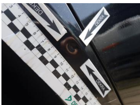
Fot. 27 Błotnik tylny prawy/ściana boczna prawa (Wgniecie./Odształ. 1)