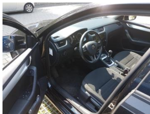
Fot. 10 Widok przez lewe przednie drzwi