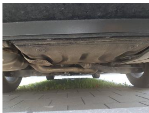
Fot. 20 Spód pojazdu tył