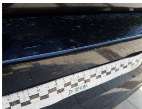
Fot. 28 Zderzak tylny (Rysa/Odprysk)