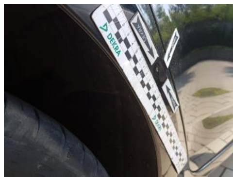
Fot. 26 Błotnik tylny prawy/ściana boczna prawa (Wgniecie./Odształ.)