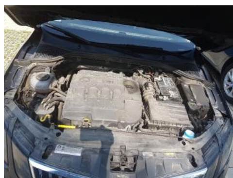
Fot. 16 Komora silnika