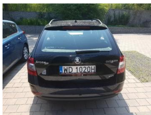
Fot. 4 Tył