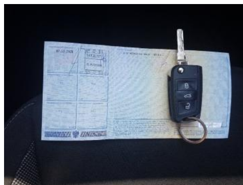
Fot. 22 Dowód rejestracyjny 2. strona / klucze