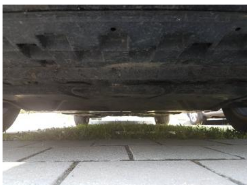
Fot. 19 Spód pojazdu przód