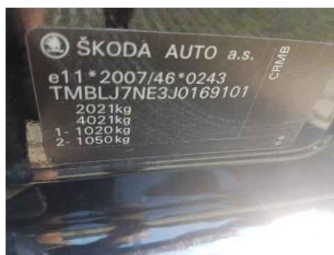
Fot. 8 Tabliczka