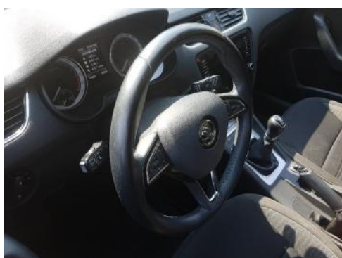
Fot. 15 Kierownica widok z lewej strony (widoczne przełączniki)