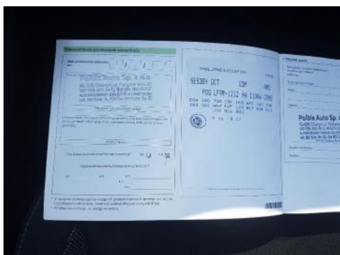
Fot. 23 Książka serwisowa (dane pojazdu)