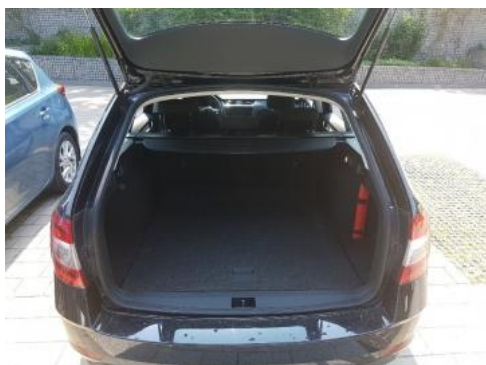
Fot. 17 Bagażnik