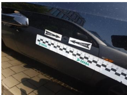
Fot. 25 Drzwi przednie prawe (Wgniecie./Odształ.)