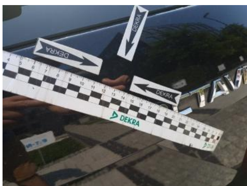
Fot. 29 Pokrywa bagażnika (Wgniecie./Odształ.)