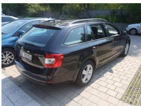
Fot. 3 Prawy bok tył