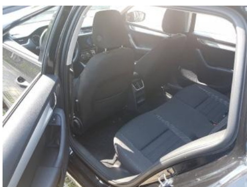
Fot. 11 Widok przez lewe tylne drzwi