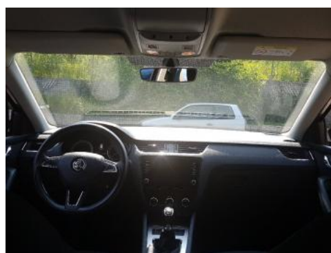
Fot. 12 Widok z tylnego siedzenia