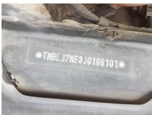
Fot. 7 Pole numerowe