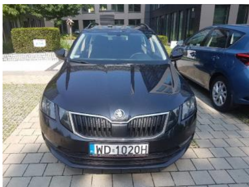
Fot. 1 Przód