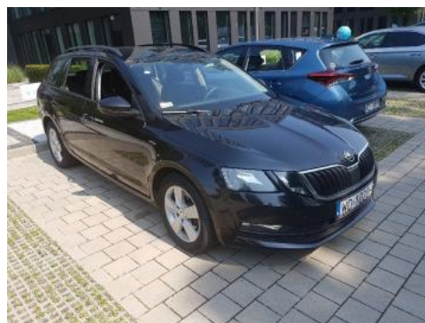
Fot. 2 Prawy bok przód