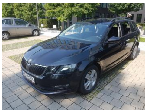
Fot. 6 Lewy bok przód