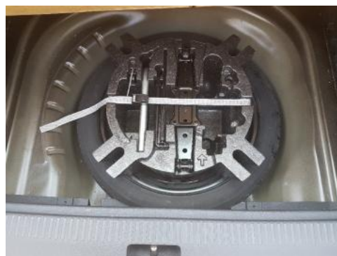
Fot. 18 Koło zapasowe/trójkąt/gaśnica