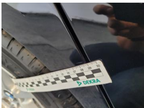
Fot. 27 Błotnik tylny prawy/ściana boczna prawa (Rysa/Odprysk)