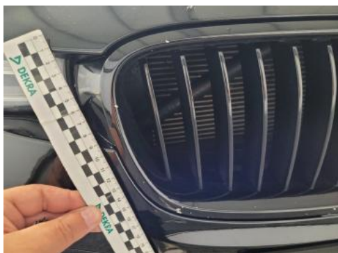
Fot. 25 Przednia atrapa (Rysa/Odprysk)