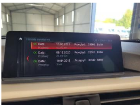
Fot. 23 Książka serwisowa - ostatni przegląd