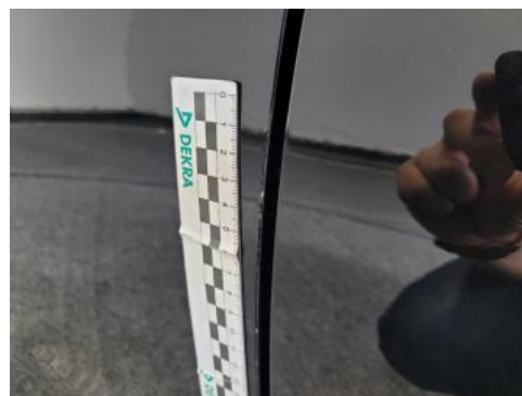
Fot. 30 Drzwi przednie lewe (Rysa/Odprysk)