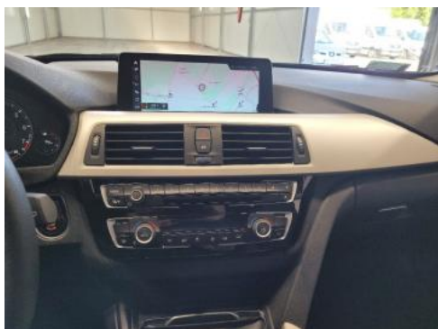
Fot. 13 Konsola środkowa