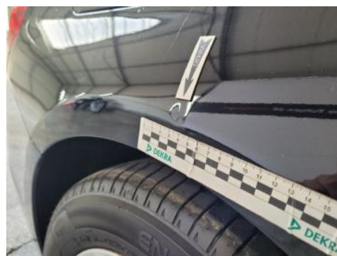
Fot. 28 Błotnik tylny prawy/ściana boczna prawa (Wgniecie./Odształ.)