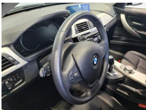
Fot. 15 Kierownica widok z lewej strony (widoczne przełączniki)