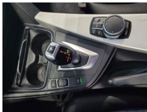
Fot. 14 Tunel środkowy