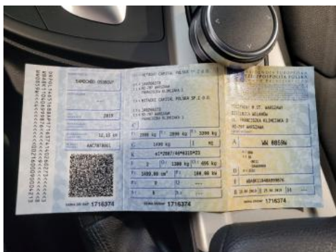
Fot. 21 Dowód rejestracyjny 1. strona