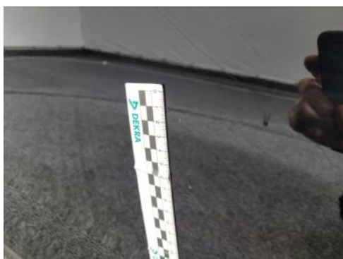
Fot. 31 Drzwi przednie lewe (Rysa/Odprysk 1)