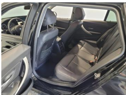
Fot. 11 Widok przez lewe tylne drzwi