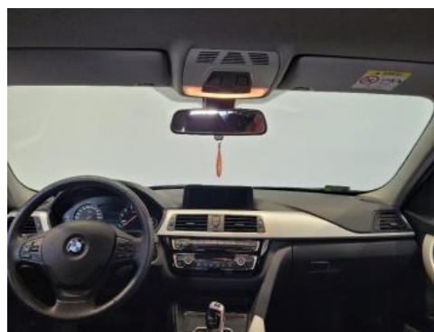
Fot. 12 Widok z tylnego siedzenia