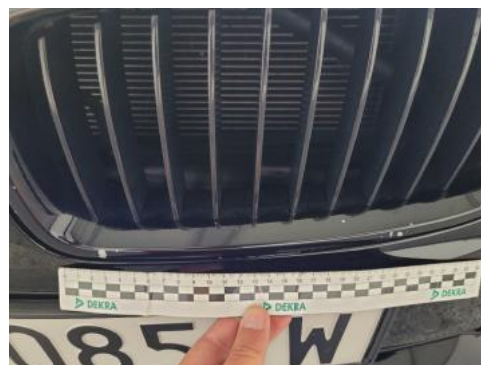
Fot. 26 Przednia atrapa (Rysa/Odprysk 1)