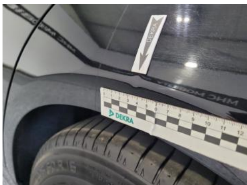
Fot. 29 Błotnik tylny lewy/ściana boczna lewa (Wgniecie./Odształ.)