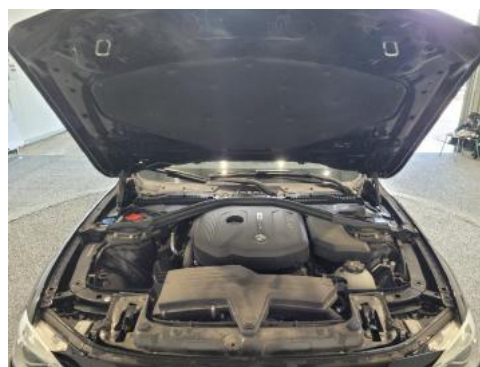
Fot. 16 Komora silnika