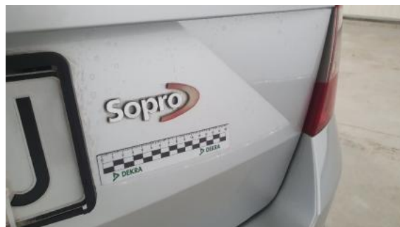
Fot. 42 Pokrywa bagażnika (Inne)