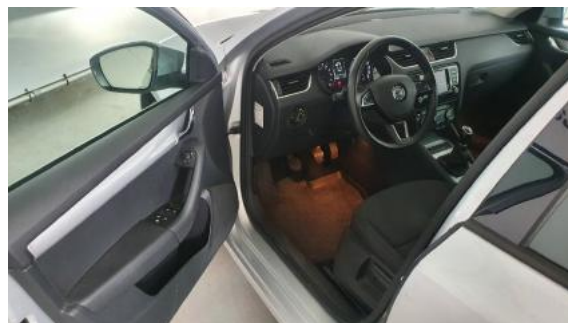
Fot. 10 Widok przez lewe przednie drzwi