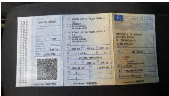
Fot. 21 Dowód rejestracyjny 1. strona