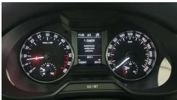
Fot. 9 Wskaźniki /przebieg/paliwo