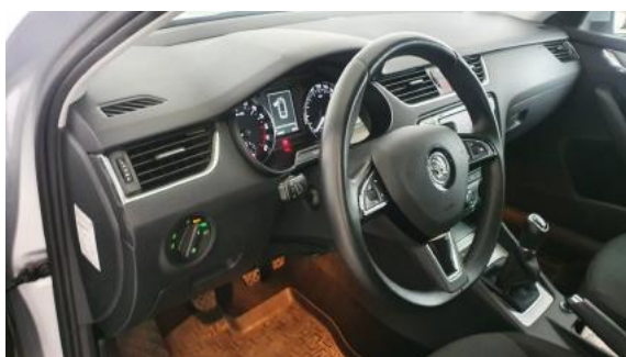
Fot. 15 Kierownica widok z lewej strony (widoczne przełączniki)