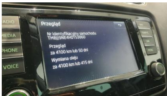
Fot. 24 Książka serwisowa - ostatni przegląd