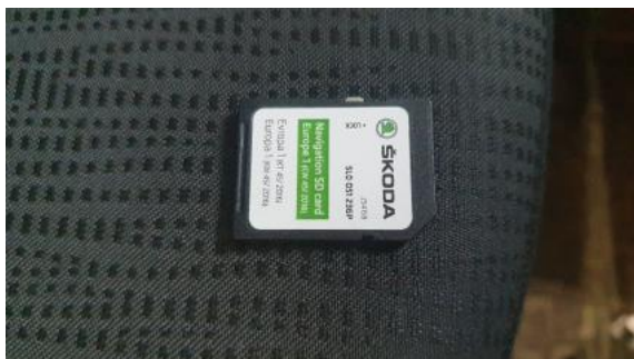
Fot. 61 _2