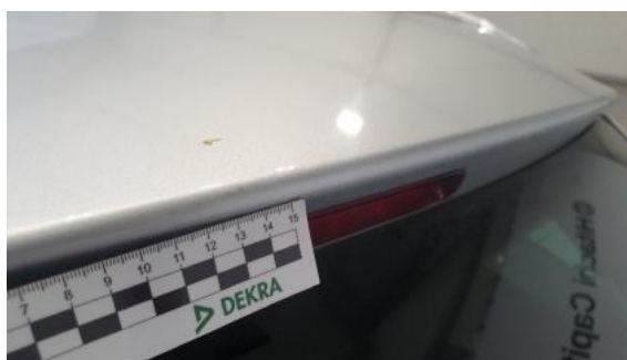
Fot. 40 Pokrywa bagażnika (Rysa/Odprysk)