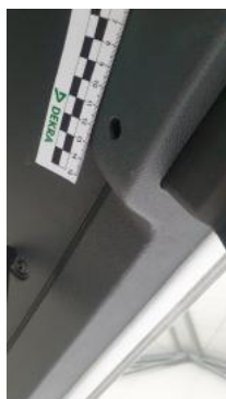
Fot. 57 Wykładzina podłogi bagażnika (Inne)