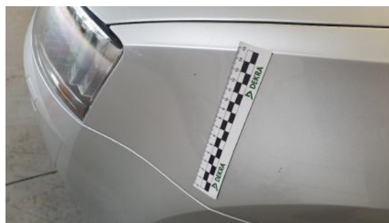
Fot. 50 Błotnik przedni lewy (Rysa/Odprysk)