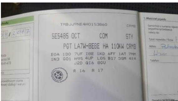
Fot. 23 Książka serwisowa (dane pojazdu)