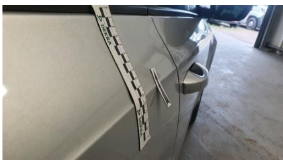
Fot. 35 Drzwi tylne prawe (Wgniecie./Odształ.)