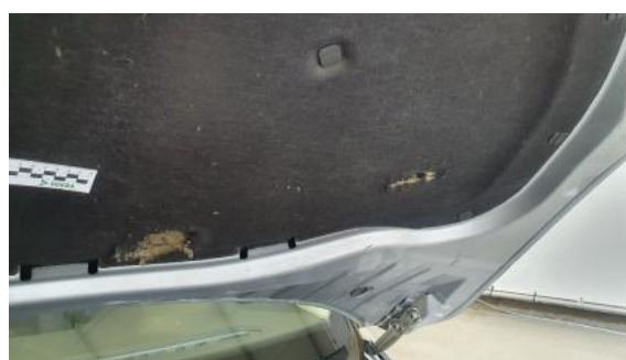
Fot. 28 Wykładzina pokrywy komory silnika (Pęknięcie/Rozerwanie)