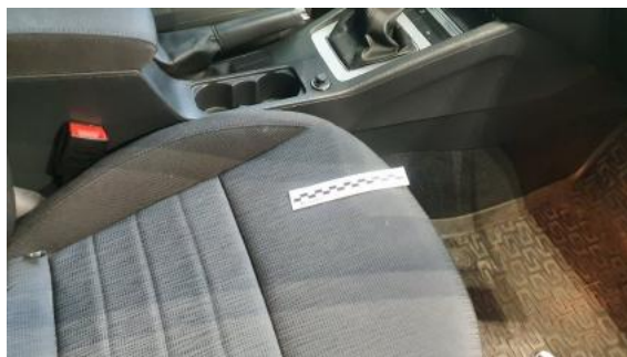
Fot. 58 Fotel prawy (Inne)