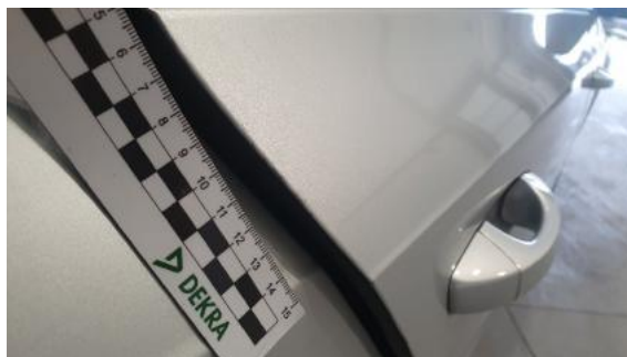
Fot. 34 Drzwi tylne prawe (Rysa/Odprysk)