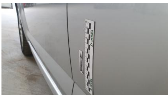
Fot. 47 Drzwi tylne lewe (Wgniec./Odształ.)