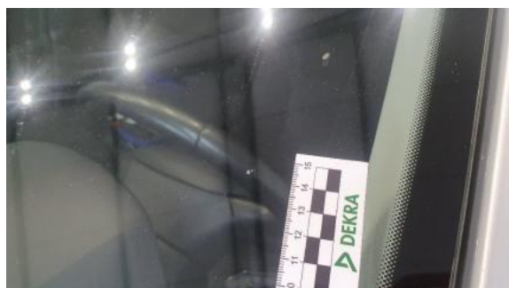
Fot. 29 Szyba czołowa (Rysa/Odprysk)