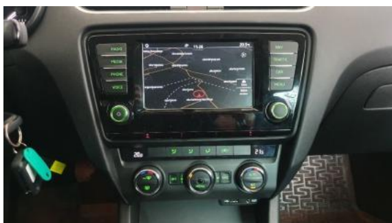
Fot. 13 Konsola środkowa