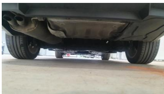
Fot. 20 Spód pojazdu tył