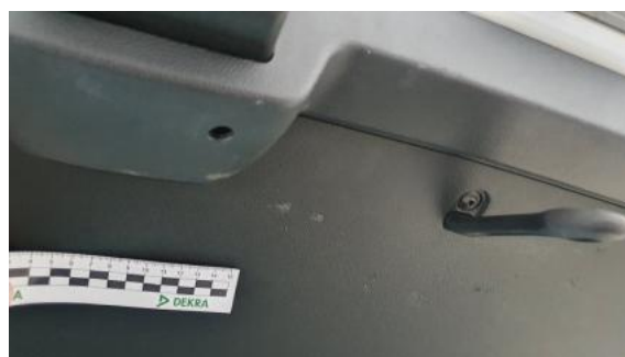
Fot. 56 Wykładzina podłogi bagażnika (Rysa/Odprysk)