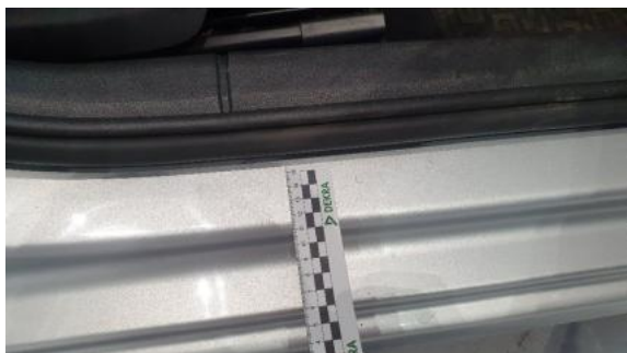
Fot. 33 Próg prawy (Rysa/Odprysk)