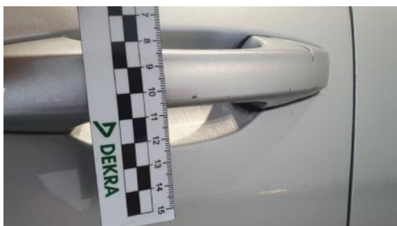
Fot. 49 Klamka drzwi prz. L (Rysa/Odprysk)