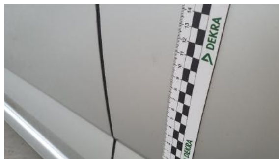
Fot. 46 Drzwi tylne lewe (Rysa/Odprysk 1)