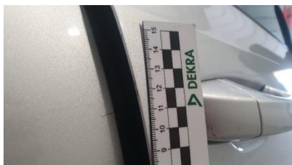
Fot. 31 Drzwi przednie prawe (Rysa/Odprysk)