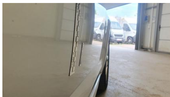
Fot. 32 Drzwi przednie prawe (Wgniecie./Odształ.)