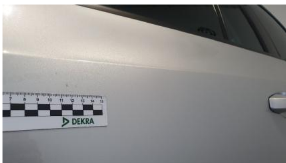
Fot. 45 Drzwi tylne lewe (Rysa/Odprysk)