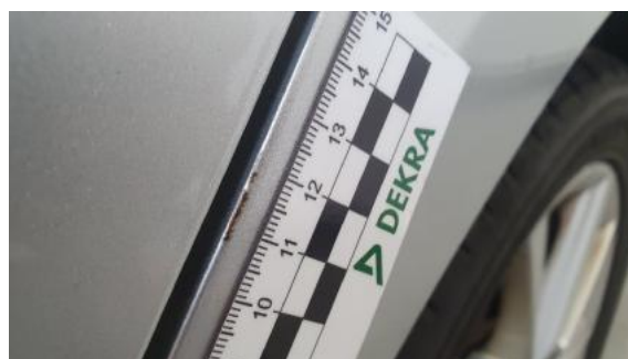
Fot. 44 Błotnik tylny lewy/ściana boczna lewa (Inne)