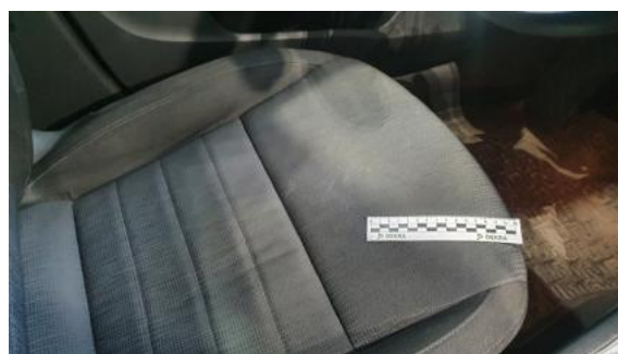
Fot. 52 Fotel lewy (Inne)