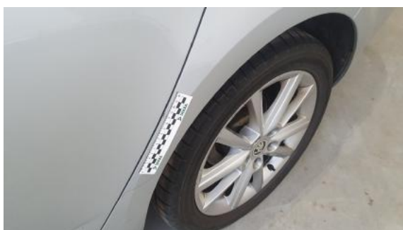
Fot. 43 Błotnik tylny lewy/ściana boczna lewa (Zdjęcie poglądowe 1)