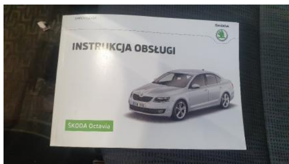
Fot. 25 Instrukcja obsługi