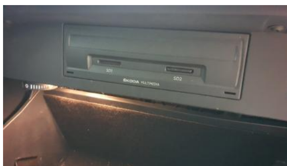
Fot. 60 _1