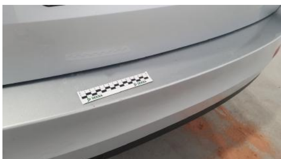
Fot. 39 Zderzak tylny (Rysa/Odprysk 2)