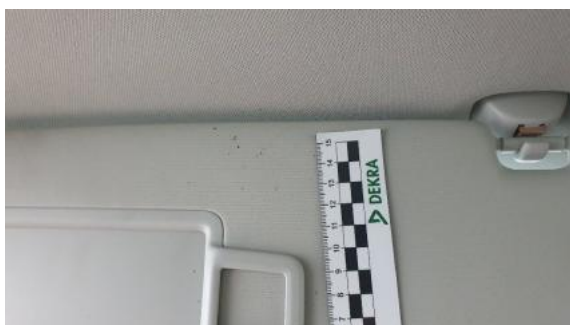
Fot. 53 pp_osłona_p_sloneczna_lewa (Inne)