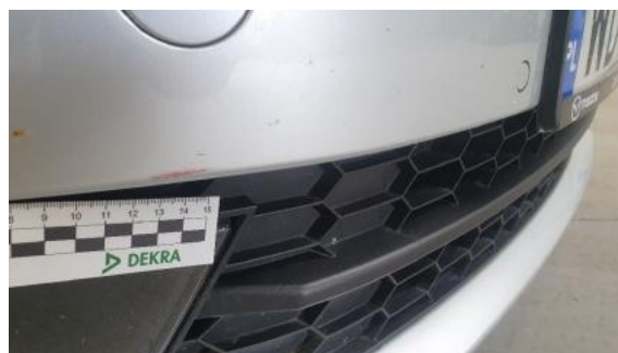
Fot. 26 Zderzak (Rysa/Odprysk)