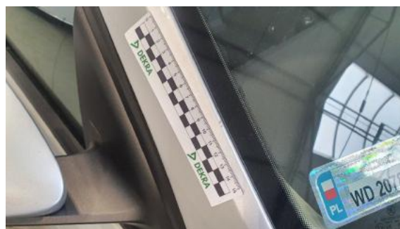
Fot. 30 Słupek przedni prawy (Rysa/Odprysk)