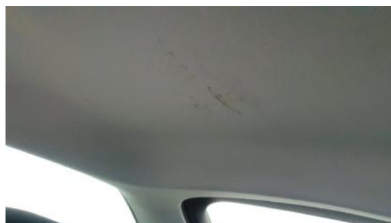
Fot. 54 Podsufitka (Inne)