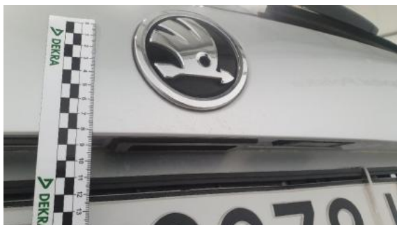
Fot. 41 Pokrywa bagażnika (Rysa/Odprysk 1)