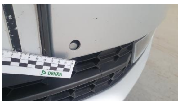
Fot. 27 Zderzak (Inne)