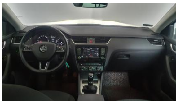
Fot. 12 Widok z tylnego siedzenia