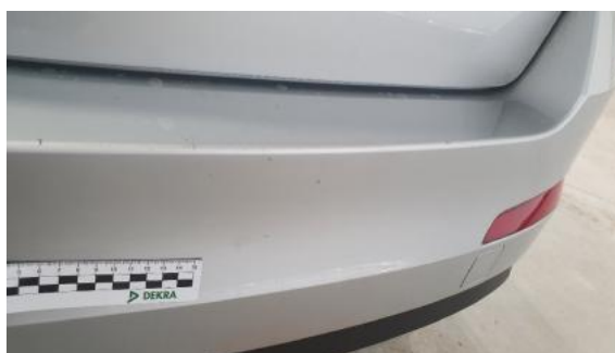
Fot. 36 Zderzak tylny (Zdjęcie poglądowe 1)