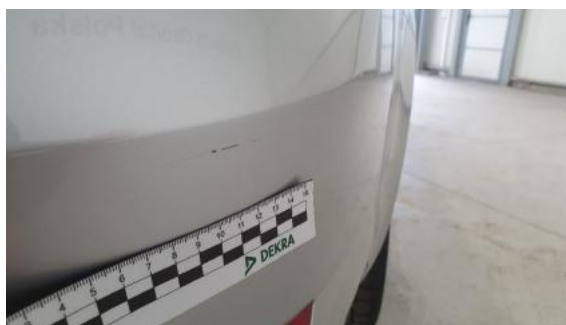
Fot. 38 Zderzak tylny (Rysa/Odprysk 1)