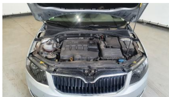
Fot. 16 Komora silnika