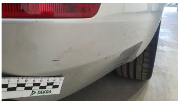
Fot. 37 Zderzak tylny (Rysa/Odprysk)