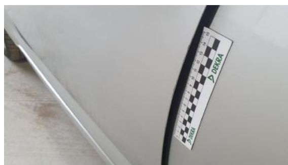
Fot. 48 Drzwi przednie lewe (Rysa/Odprysk)