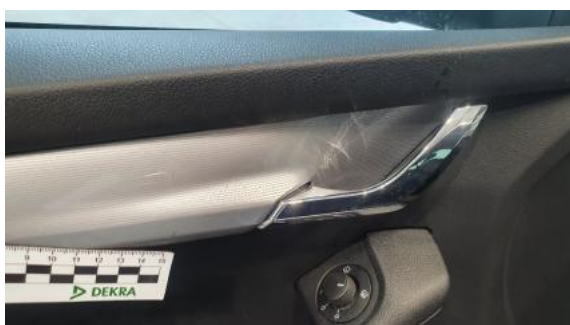
Fot. 51 Tapicerka drzwi przednich lewych (Rysa/Odprysk)