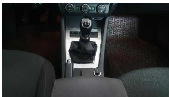
Fot. 14 Tunel środkowy