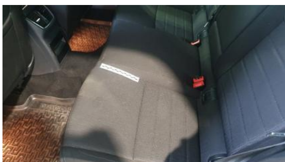
Fot. 55 Kanapa tylna (Inne)