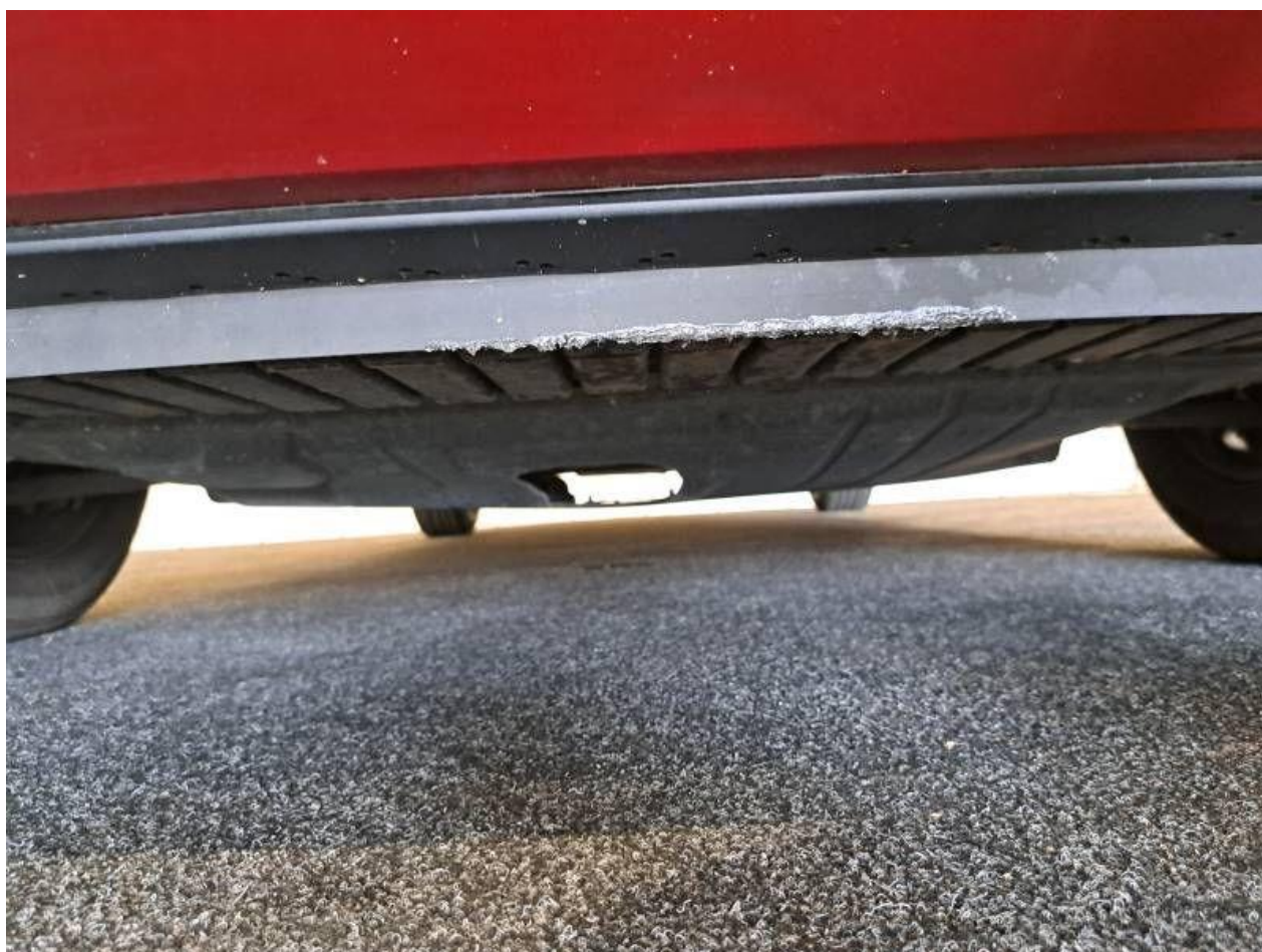
Fot. nr 60