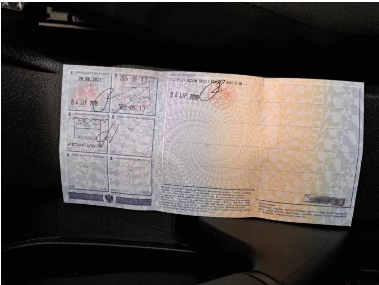
Fot. nr 63