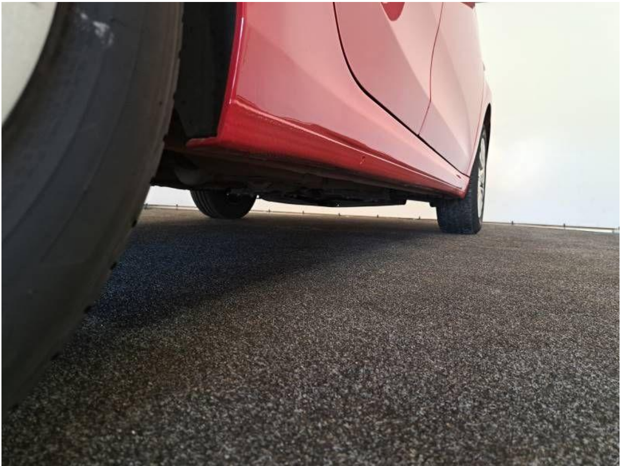
Fot. nr 57