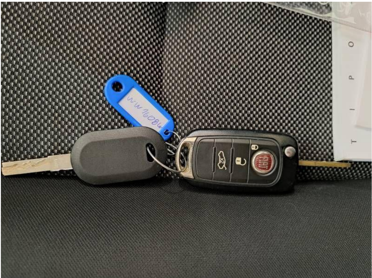
Fot. nr 64

Dokument wystawiony elektronicznie, wa ny bez podpisu