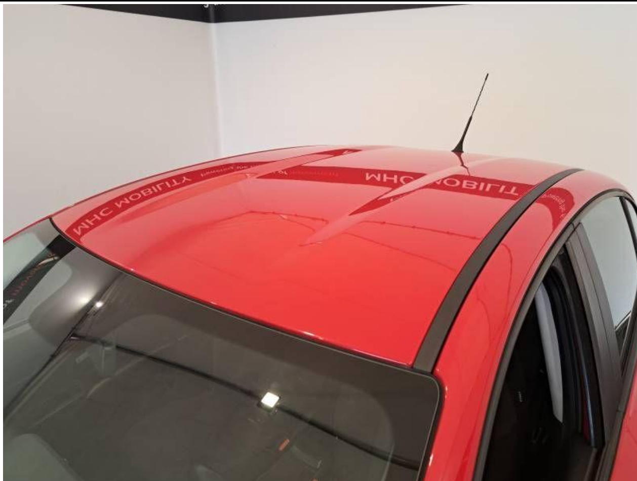
Fot. nr 59