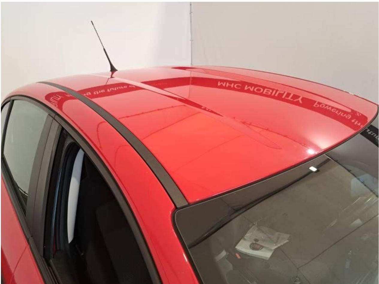
Fot. nr 58