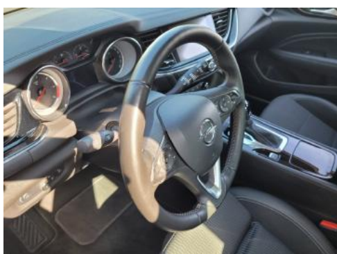
Fot. 15 Kierownica widok z lewej strony (widoczne przełączniki)