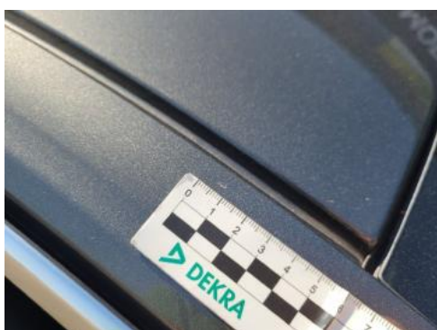
Fot. 35 Rama dachu P (Rysa/Odprysk)