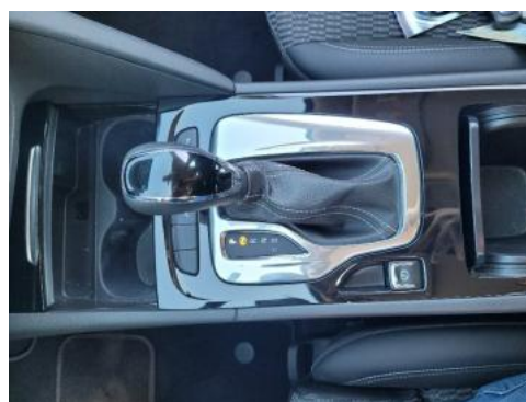
Fot. 14 Tunel środkowy