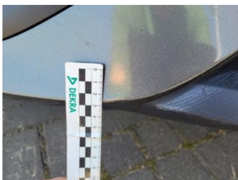
Fot. 29 Zderzak (Wgniec./Odształ.)