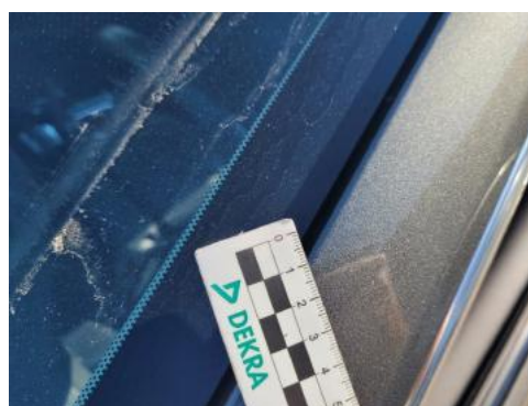
Fot. 40 Stupek przedni lewy (Rysa/Odprysk)