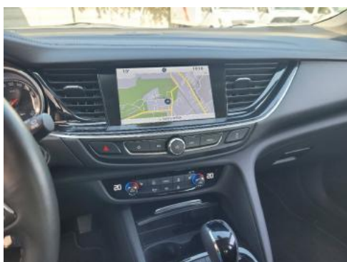
Fot. 13 Konsola środkowa