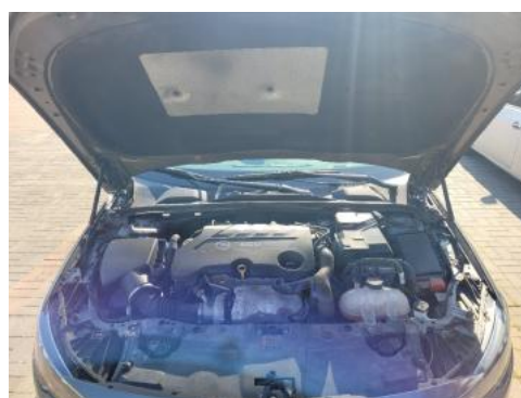
Fot. 16 Komora silnika