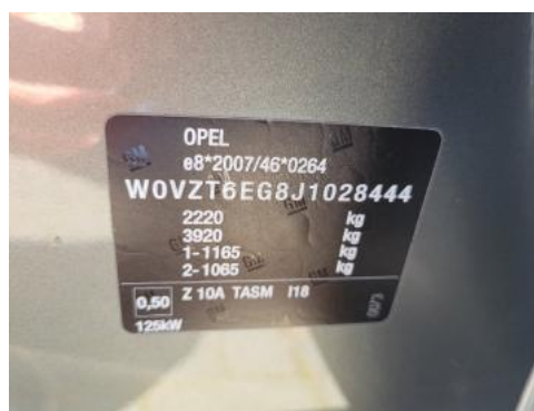
Fot. 8 Tabliczka