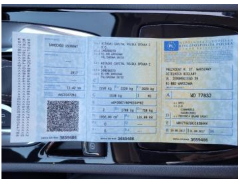
Fot. 21 Dowód rejestracyjny 1. strona