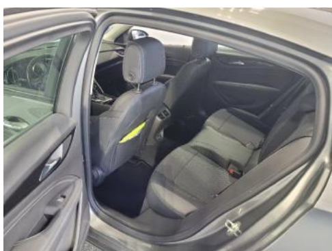
Fot. 11 Widok przez lewe tylne drzwi