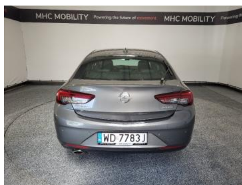
Fot. 4 Tył