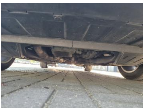
Fot. 19 Spód pojazdu przód