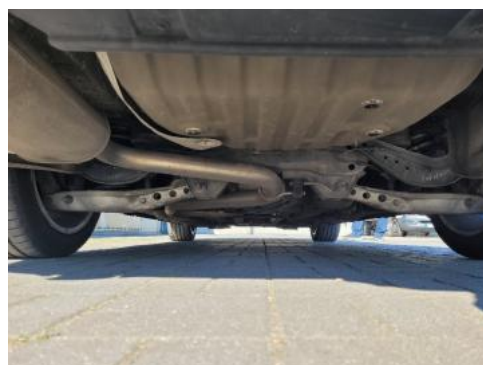
Fot. 20 Spód pojazdu tył