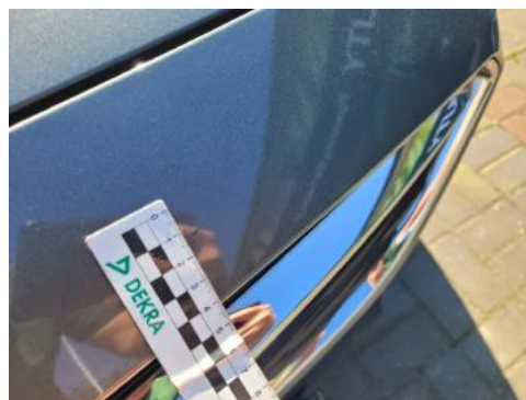
Fot. 26 Zderzak (Rysa/Odprysk)