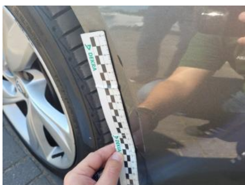
Fot. 27 Zderzak (Rysa/Odprysk 1)