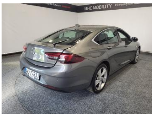
Fot. 3 Prawy bok tył