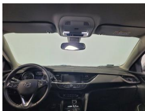
Fot. 12 Widok z tylnego siedzenia