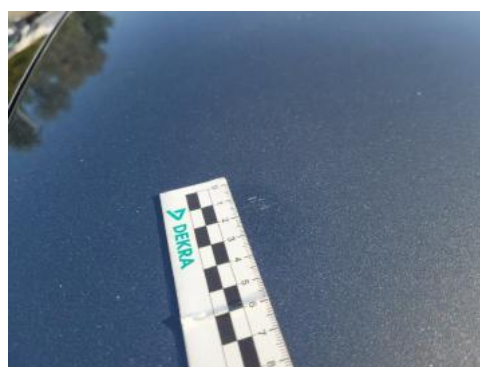
Fot. 36 Dach (Rysa/Odprysk)