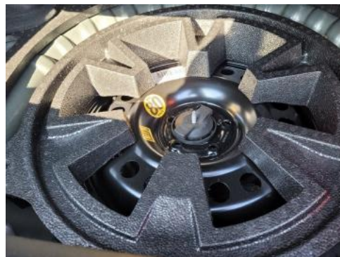
Fot. 18 Koło zapasowe/trójkąt/gaśnica