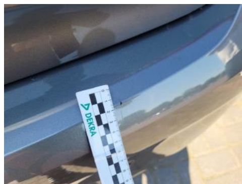
Fot. 34 Zderzak tylny (Rysa/Odprysk)