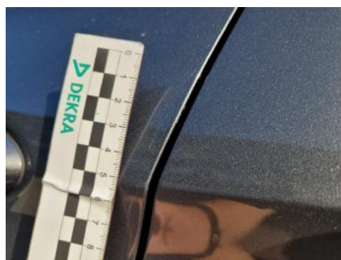
Fot. 38 Drzwi przednie lewe (Rysa/Odprysk)