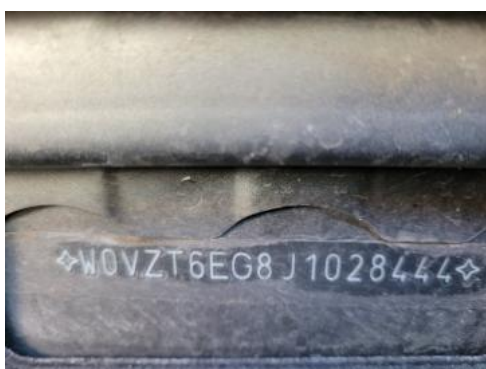
Fot. 7 Pole numerowe