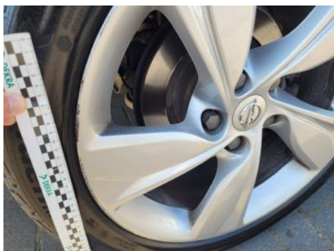
Fot. 33 Felga tylna prawa (Rysa/Odprysk)