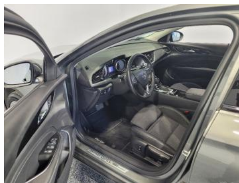
Fot. 10 Widok przez lewe przednie drzwi