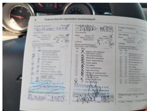
Fot. 24 Książka serwisowa - ostatni przegląd