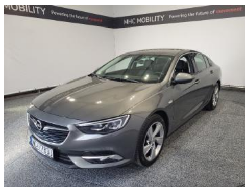
Fot. 6 Lewy bok przód