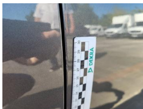
Fot. 32 Drzwi przednie prawo (Rysa/Odprysk)