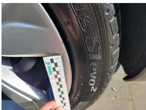
Fot. 37 Felga tylna lewa (Rysa/Odprysk)