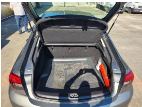
Fot. 17 Bagażnik