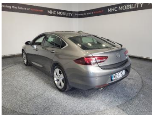
Fot. 5 Lewy bok tył