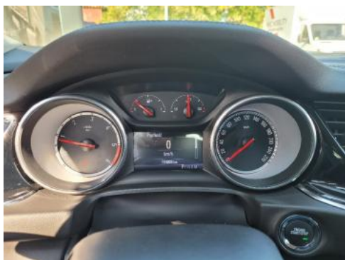
Fot. 9 Wskaźniki /przebieg/paliwo