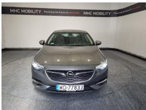
Fot. 1 Przód