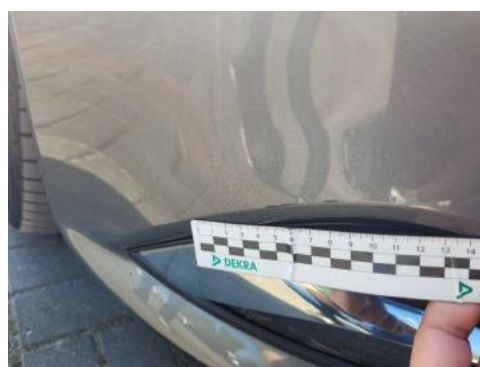
Fot. 28 Zderzak (Rysa/Odprysk 2)