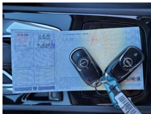
Fot. 22 Dowód rejestracyjny 2. strona / klucze