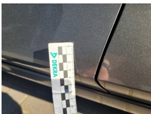
Fot. 39 Drzwi przednie lewe (Rysa/Odprysk 1)