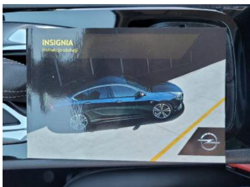
Fot. 25 Instrukcja obsługi