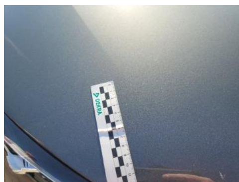
Fot. 30 Pokrywa komory silnika (Rysa/Odprysk)