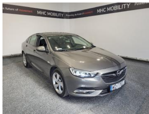
Fot. 2 Prawy bok przód