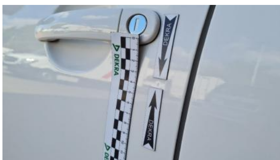
Fot. 35 Drzwi przednie lewe (Wgniec./Odształ.)