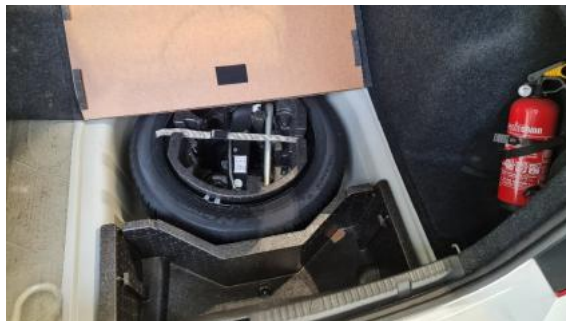
Fot. 18 Koło zapasowe/trójkąt/gaśnica