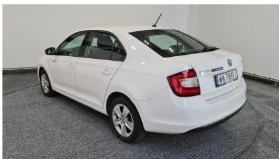
Fot. 5 Lewy bok tył