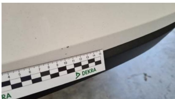
Fot. 29 Zderzak tylny (Rysa/Odprysk 1)