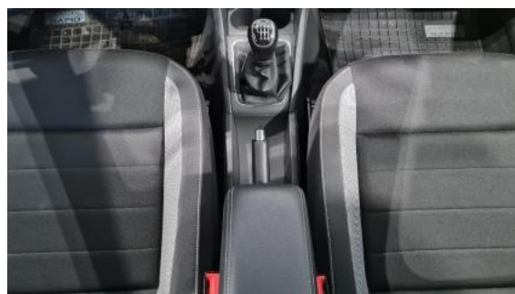
Fot. 14 Tunel środkowy