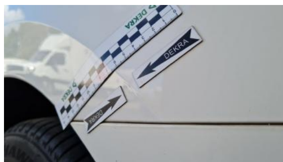
Fot. 32 Błotnik tylny lewy/ściana boczna lewa (Wgniecie./Odształ.)