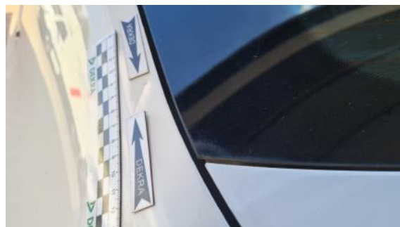
Fot. 34 Błotnik tylny lewy/ściana boczna lewa (Wgniec./Odształ. 2)