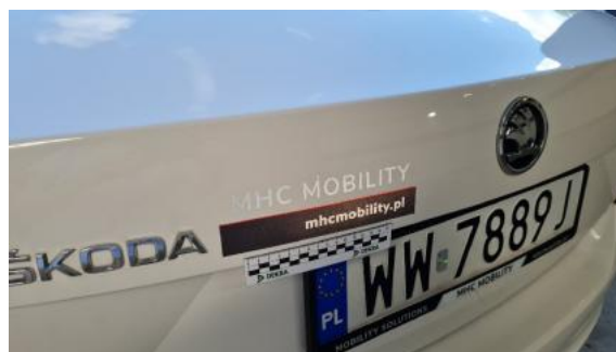
Fot. 30 Pokrywa bagażnika (Inne)