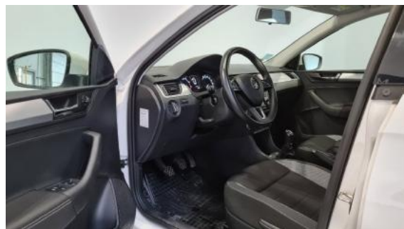
Fot. 10 Widok przez lewe przednie drzwi