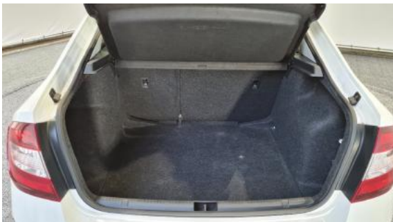
Fot. 17 Bagażnik