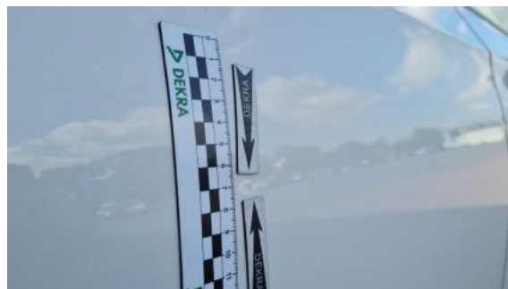
Fot. 26 Drzwi tylne prawe (Wgniecie./Odształ.)