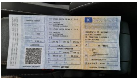
Fot. 21 Dowód rejestracyjny 1. strona