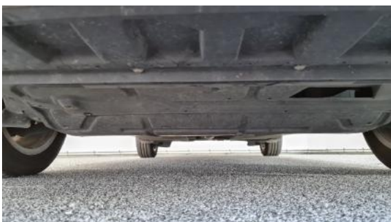
Fot. 19 Spód pojazdu przód