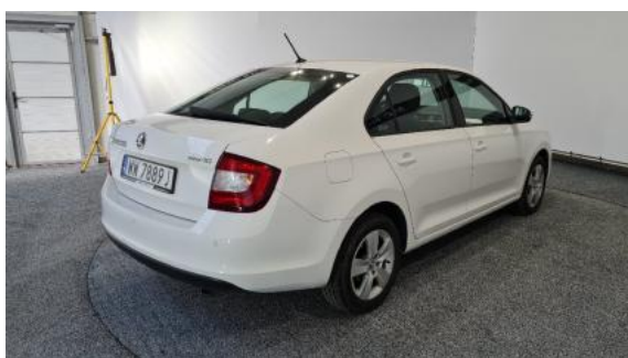
Fot. 3 Prawy bok tył