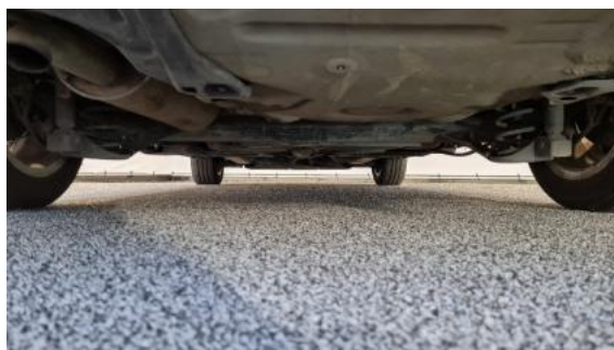
Fot. 20 Spód pojazdu tył