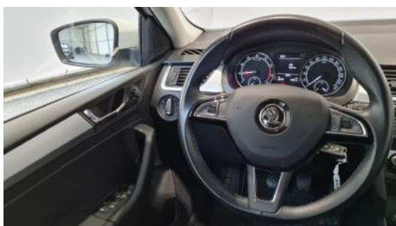
Fot. 15 Kierownica widok z lewej strony (widoczne przełączniki)