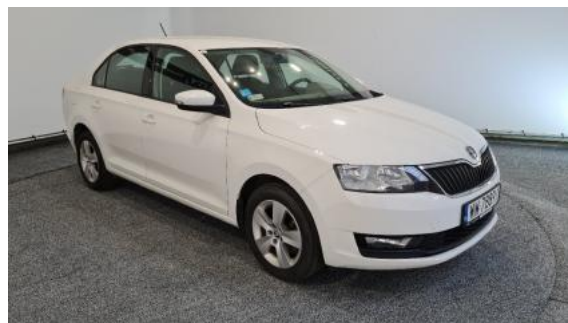
Fot. 2 Prawy bok przód