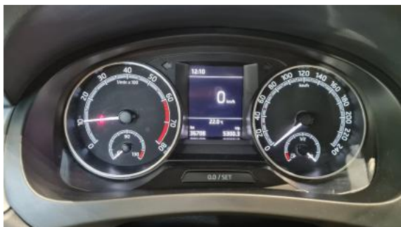
Fot. 9 Wskaźniki /przebieg/paliwo