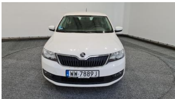
Fot. 1 Przód