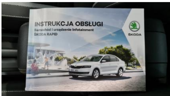
Fot. 25 Instrukcja obsługi