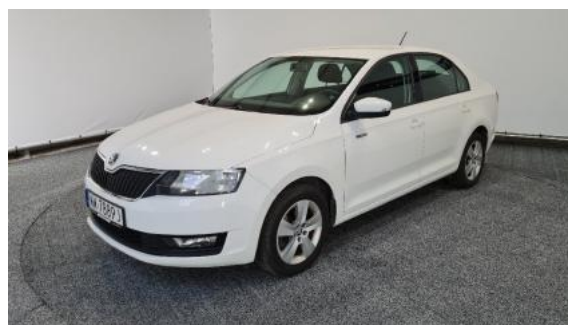
Fot. 6 Lewy bok przód