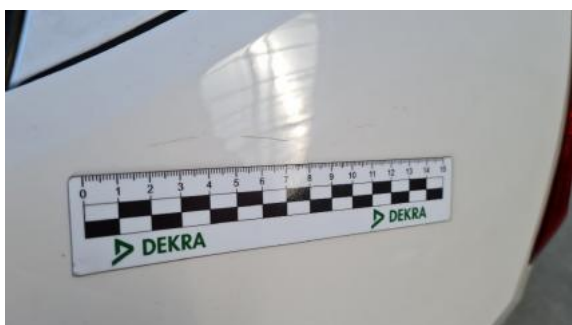
Fot. 31 Błotnik tylny lewy/ściana boczna lewa (Rysa/Odprysk)