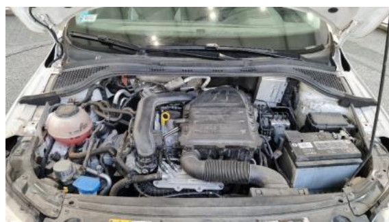
Fot. 16 Komora silnika