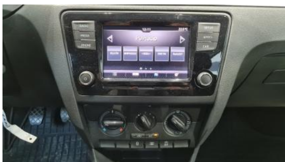
Fot. 13 Konsola środkowa