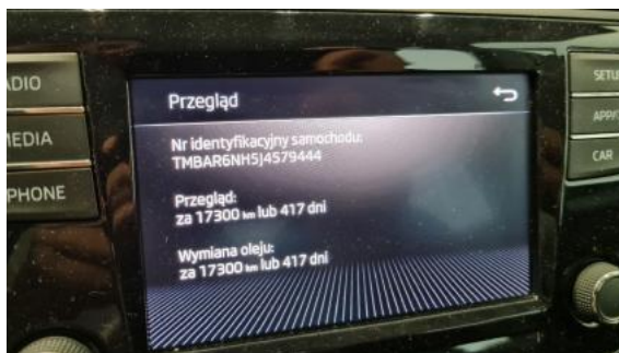
Fot. 24 Książka serwisowa - ostatni przegląd