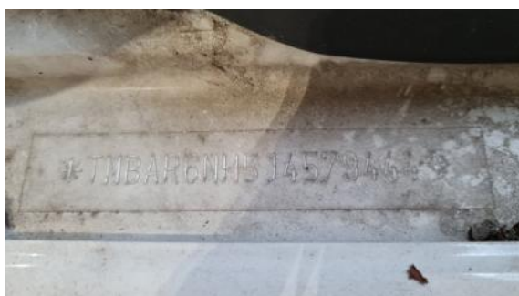
Fot. 7 Pole numerowe