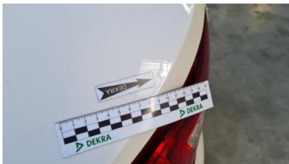
Fot. 33 Błotnik tylny lewy/ściana boczna lewa (Wgniec./Odształ. 1)