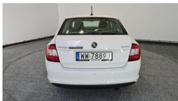
Fot. 4 Tył