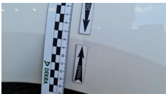
Fot. 27 Błotnik tylny prawy/ściana boczna prawa (Wgniecie./Odształ.)