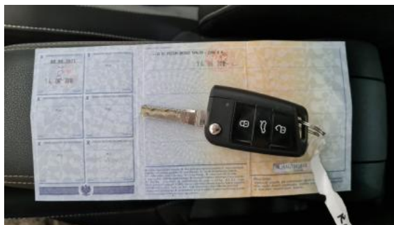
Fot. 22 Dowód rejestracyjny 2. strona / klucze