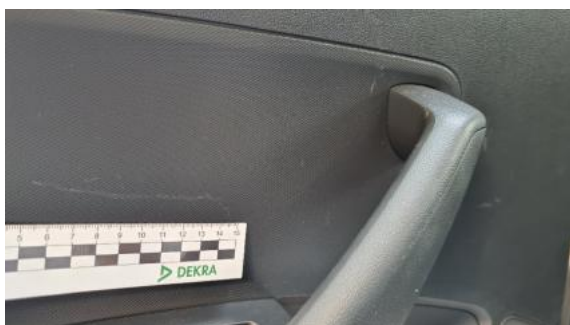
Fot. 37 Tapicerka drzwi tylnych lewych (Rysa/Odprysk)