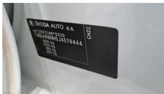
Fot. 8 Tabliczka