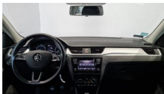
Fot. 12 Widok z tylnego siedzenia