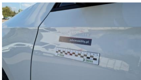
Fot. 36 Drzwi przednie lewe (Inne)