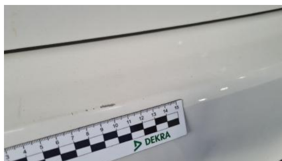
Fot. 28 Zderzak tylny (Rysa/Odprysk)