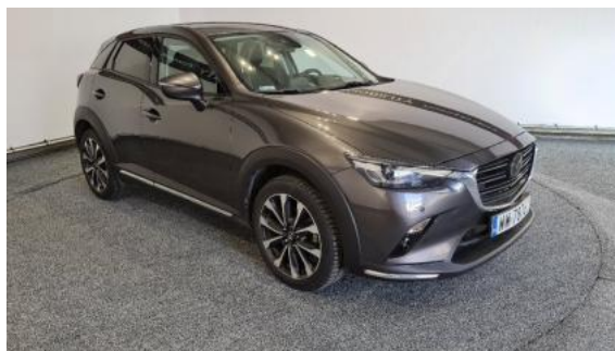
Fot. 2 Prawy bok przód