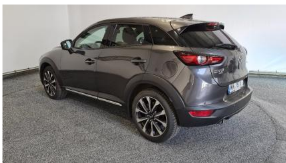
Fot. 5 Lewy bok tył