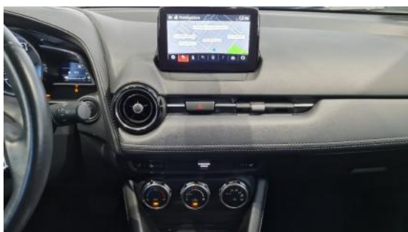
Fot. 13 Konsola środkowa