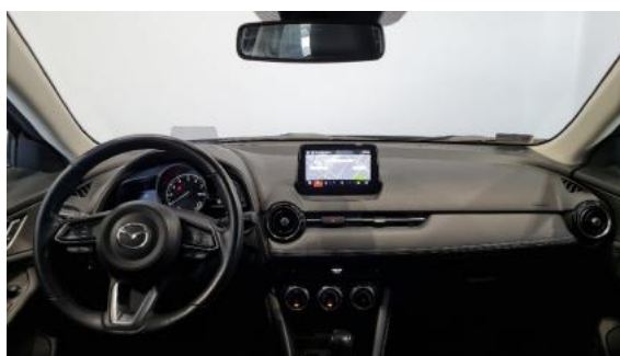
Fot. 12 Widok z tylnego siedzenia