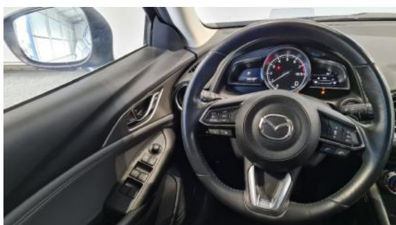
Fot. 15 Kierownica widok z lewej strony (widoczne przełączniki)