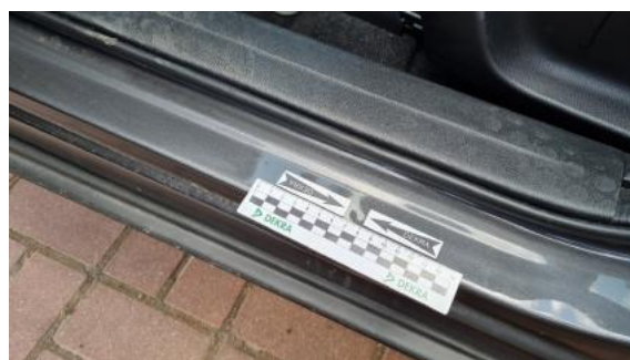
Fot. 32 Próg lewy (Wgniecie./Odształ.)