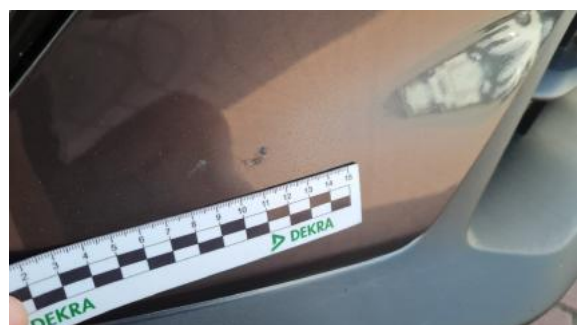
Fot. 24 Zderzak (Rysa/Odprysk)