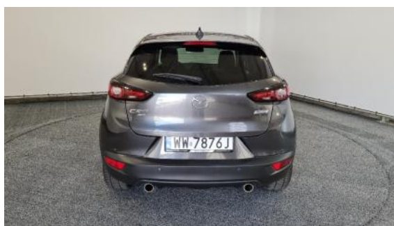
Fot. 4 Tył