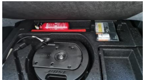
Fot. 18 Koło zapasowe/trójkąt/gaśnica