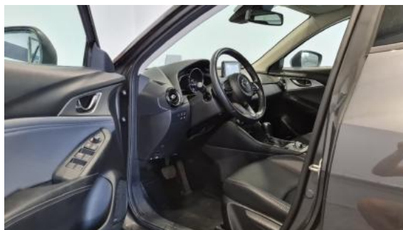
Fot. 10 Widok przez lewe przednie drzwi