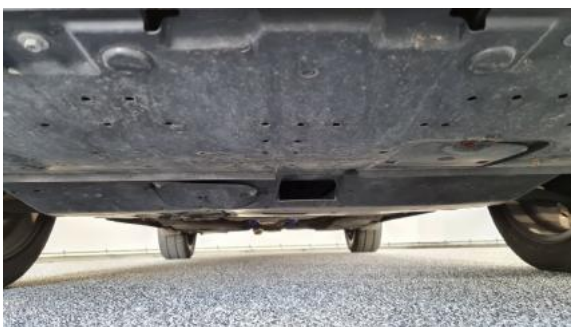
Fot. 19 Spód pojazdu przód