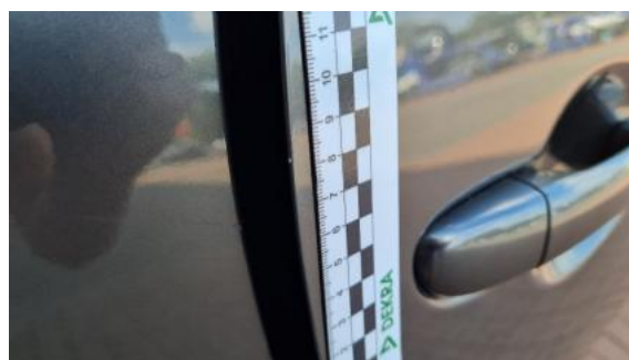
Fot. 28 Drzwi tylne prawe (Rysa/Odprysk)