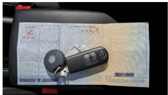
Fot. 22 Dowód rejestracyjny 2. strona / klucze