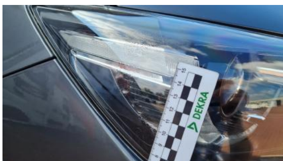
Fot. 27 Reflektor prawy (Inne)