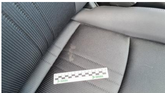
Fot. 37 Fotel prawy (Inne)