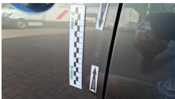
Fot. 35 Drzwi przednie lewe (Wgniec./Odształ.)