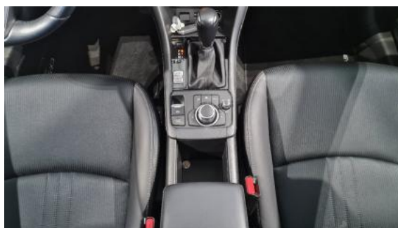
Fot. 14 Tunel środkowy