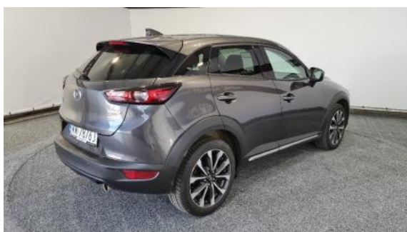
Fot. 3 Prawy bok tył