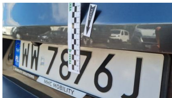
Fot. 30 Pokrywa bagażnika (Wgniecie./Odształ.)