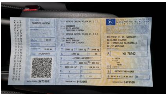
Fot. 21 Dowód rejestracyjny 1. strona