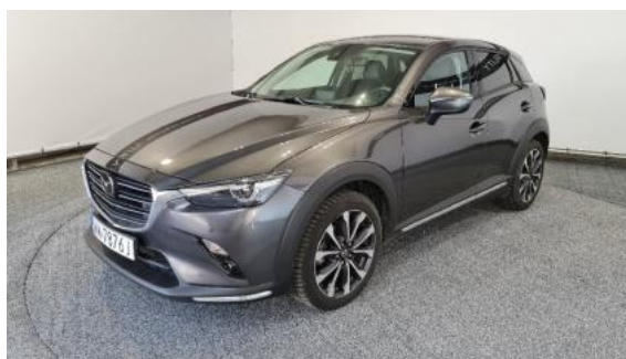
Fot. 6 Lewy bok przód