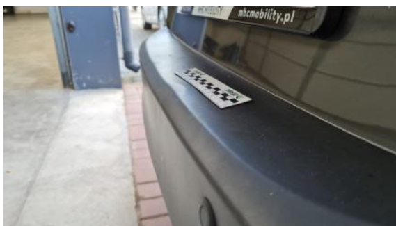
Fot. 29 Zderzak tylny (Wgniecie./Odształ.)