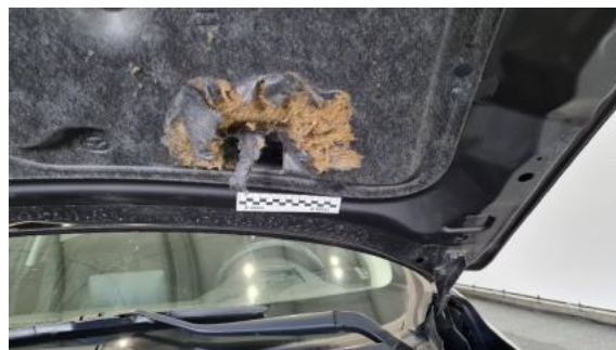
Fot. 26 Wykładzina pokrywy komory silnika (Pęknięcie/Rozerwanie)