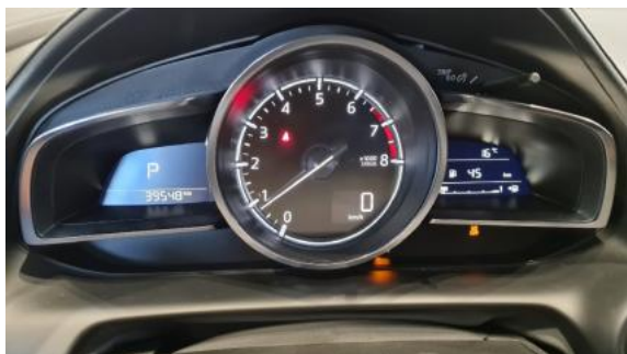
Fot. 9 Wskaźniki /przebieg/paliwo