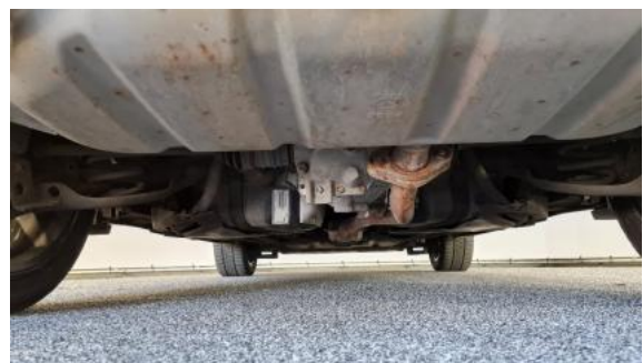
Fot. 20 Spód pojazdu tył