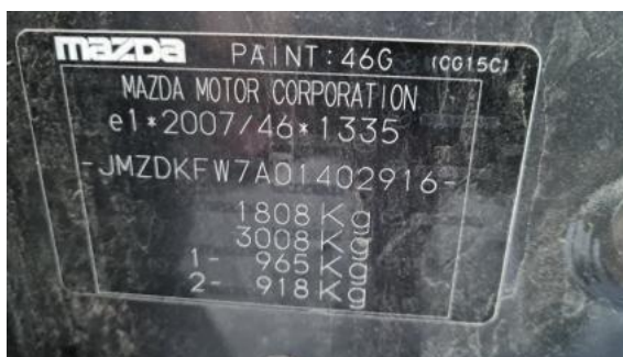
Fot. 8 Tabliczka