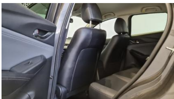
Fot. 11 Widok przez lewe tylne drzwi