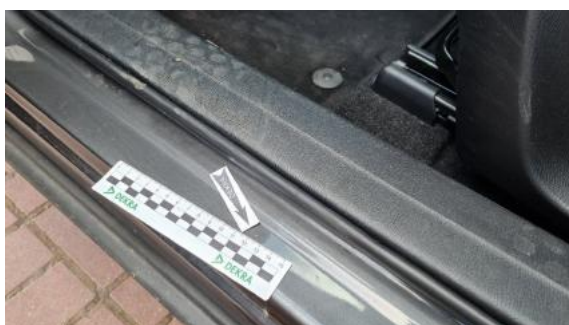
Fot. 31 Próg lewy (Zdjęcie poglądowe 1)