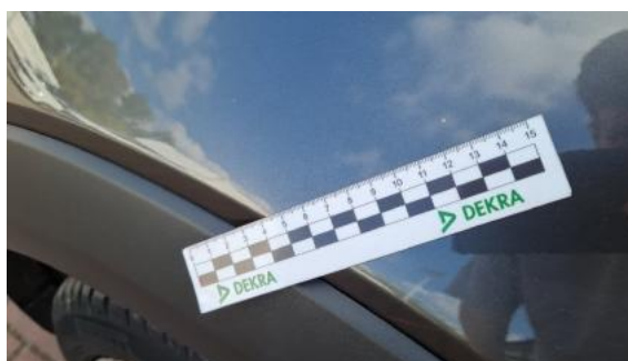
Fot. 36 Błotnik przedni lewy (Rysa/Odprysk)