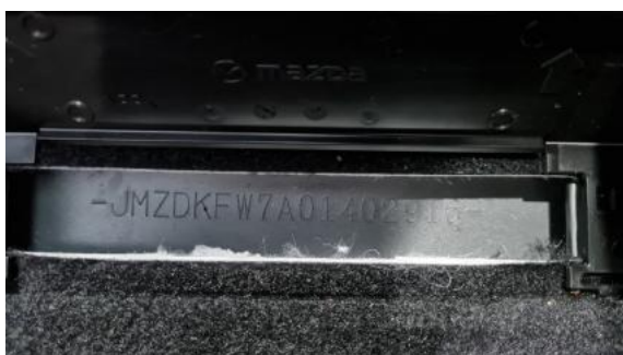
Fot. 7 Pole numerowe