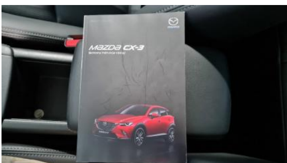
Fot. 23 Instrukcja obsługi