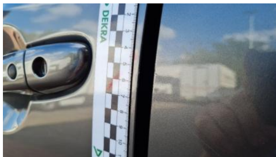
Fot. 34 Drzwi przednie lewe (Rysa/Odprysk)