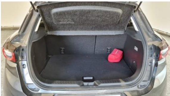
Fot. 17 Bagażnik