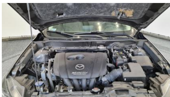
Fot. 16 Komora silnika