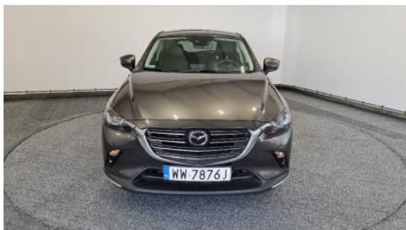
Fot. 1 Przód