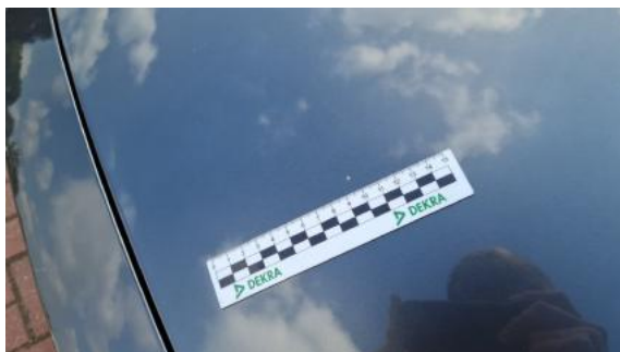
Fot. 25 Pokrywa komory silnika (Rysa/Odprysk)