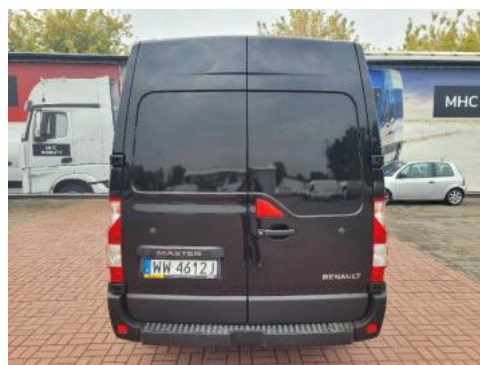
Fot. 4 Tył