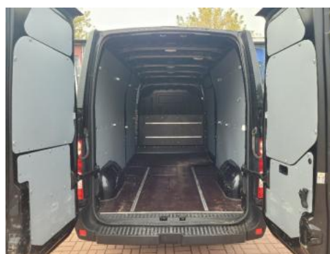
Fot. 16 Bagażnik