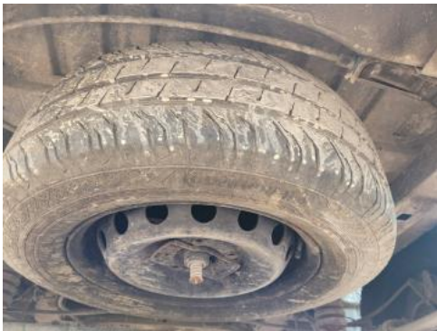
Fot. 17 Kolo zapasowe/trójkąť/gašnica