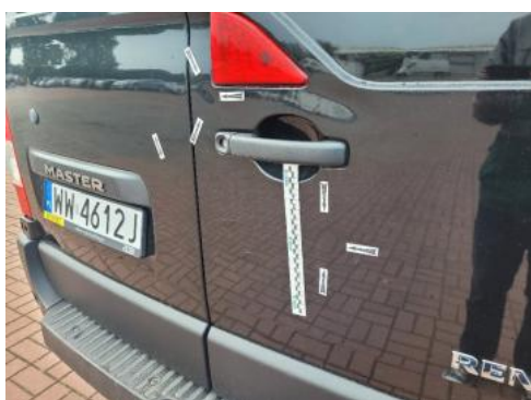
Fot. 31 Pokrywa bagażnika (Wgniecie./Odształ.)