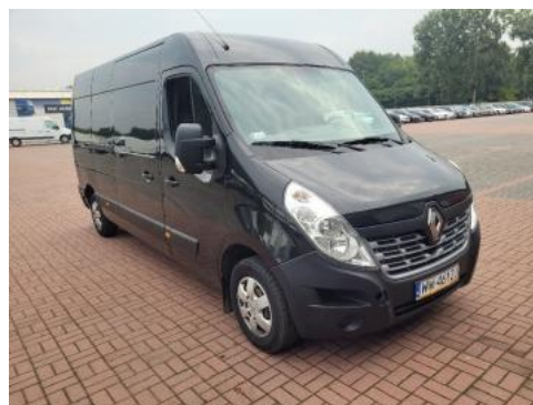
Fot. 2 Prawy bok przód