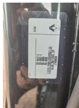
Fot. 8 Tabliczka