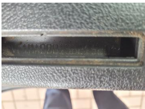
Fot. 7 Pole numerowe