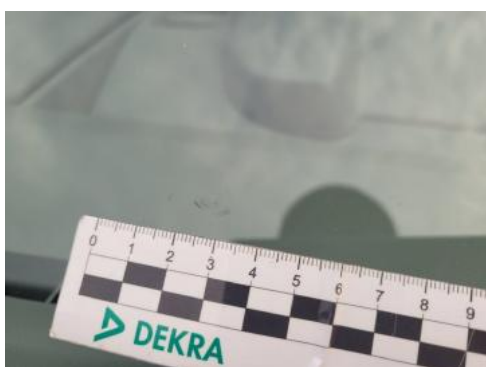
Fot. 27 Szyba czołowa (Pęknięcie/Rozerwanie)