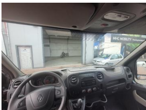
Fot. 11 Widok z tylnego siedzenia