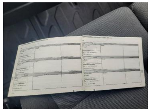
Fot. 22 Książka serwisowa - ostatni przegląd