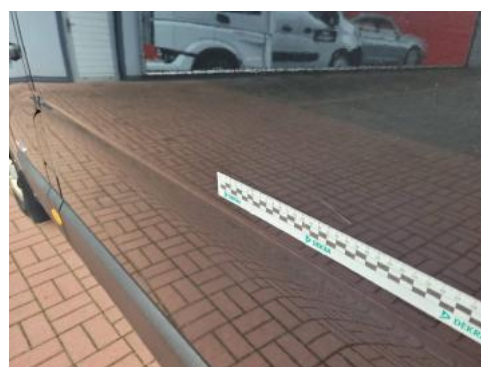
Fot. 32 Błotnik tylny lewy/ściana boczna lewa (Rysa/Odprysk)