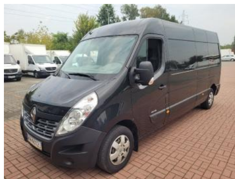
Fot. 6 Lewy bok przód