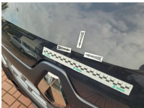
Fot. 25 Pokrywa komory silnika (Wgniecie./Odształ.)