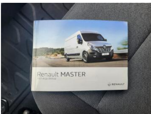
Fot. 23 Instrukcja obsługi