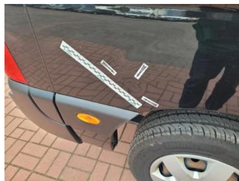
Fot. 30 Błotnik tylny prawy/ściana boczna prawa (Wgniecie./Odształ.)