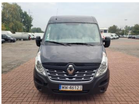
Fot. 1 Przód