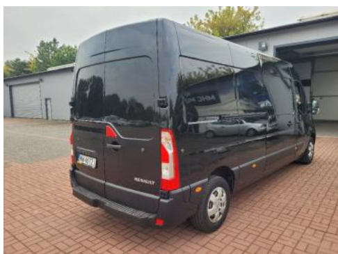
Fot. 3 Prawy bok tył