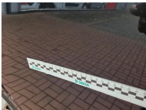
Fot. 33 Drzwi przednie lewe (Rysa/Odprysk)