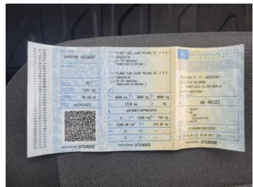
Fot. 20 Dowód rejestracyjny 1. strona