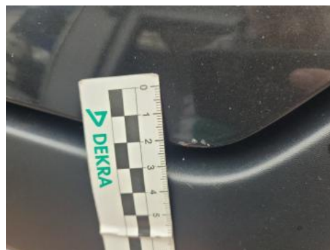
Fot. 26 Pokrywa komory silnika (Inne)