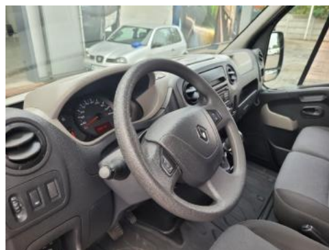
Fot. 14 Kierownica widok z lewej strony (widoczne przełączniki)