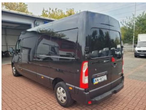
Fot. 5 Lewy bok tył