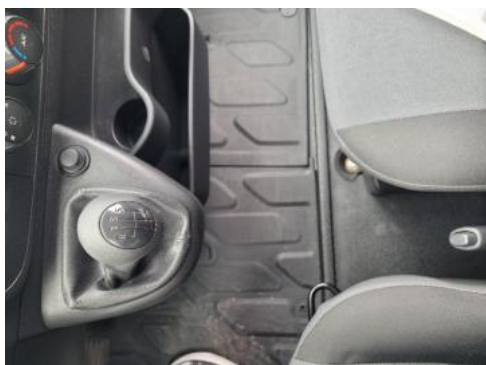
Fot. 13 Tunel środkowy