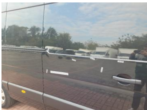
Fot. 29 Drzwi tylne prawe (Wgniecie./Odształ.)