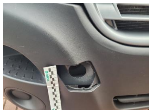
Fot. 24 Zderzak (Inne)