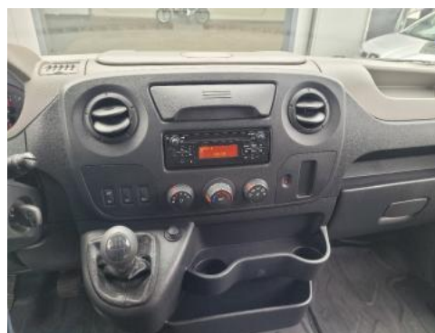
Fot. 12 Konsola środkowa