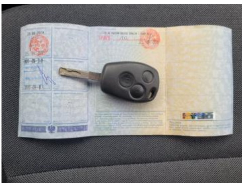
Fot. 21 Dowód rejestracyjny 2. strona / klucze