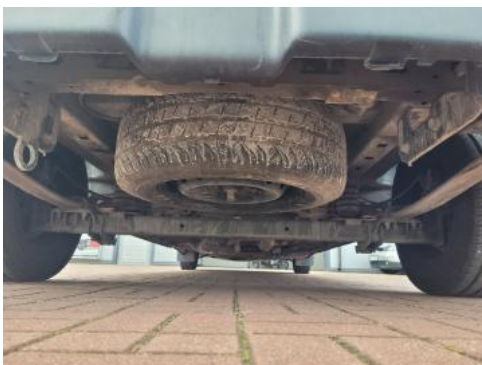
Fot. 19 Spód pojazdu tył