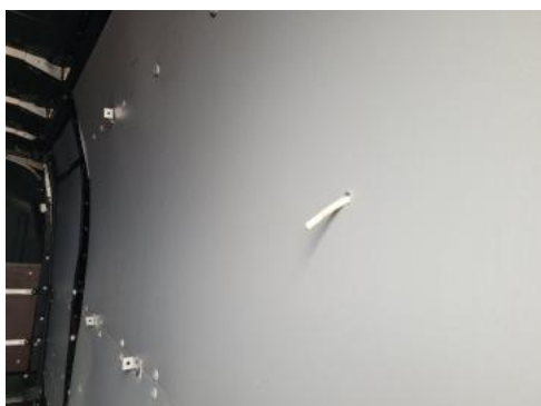
Fot. 35 Wykładzina ściany bocznej (nawiercony otwór/pęknięcie)