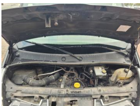
Fot. 15 Komora silnika