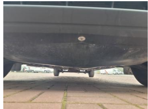
Fot. 18 Spód pojazdu przód