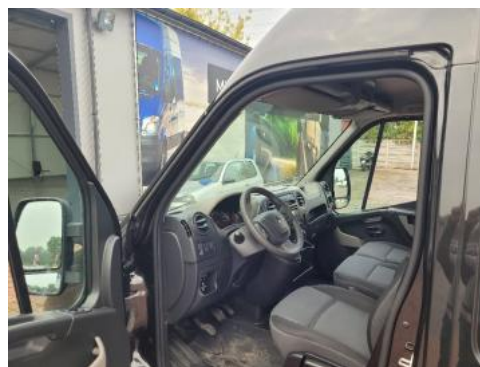
Fot. 10 Widok przez lewe przednie drzwi