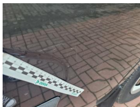
Fot. 28 Drzwi przednie prawe (Rysa/Odprysk)