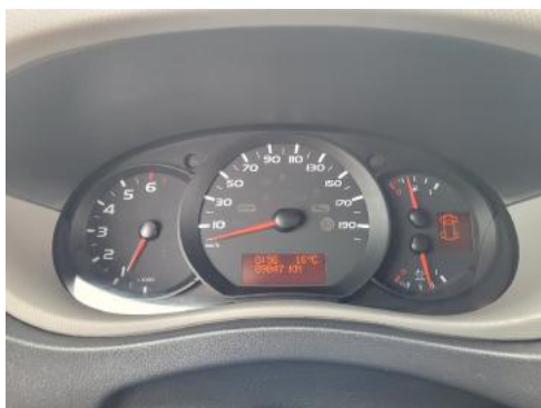
Fot. 9 Wskaźniki /przebieg/paliwo