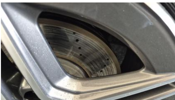
Fot. 27 Tarcza hamulcowa przednia lewa