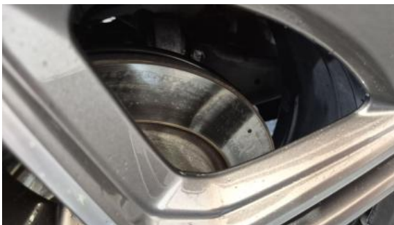
Fot. 29 Tarcza hamulcowa tylna prawa