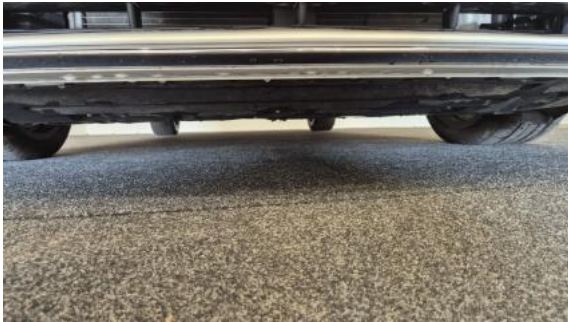
Fot. 25 Spód pojazdu przód