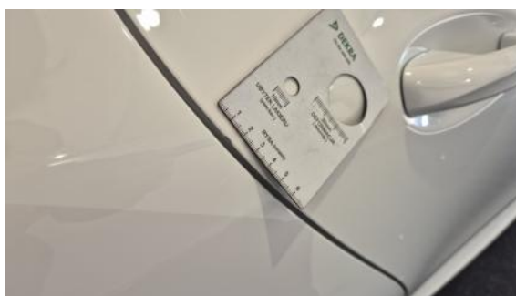
Fot. 40 Drzwi tylne P - Rysa/odprysk 1