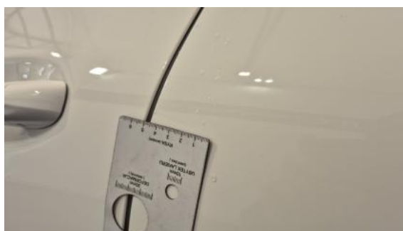
Fot. 48 Drzwi tylne L - Rysa/odprysk 2