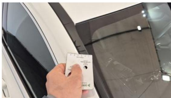
Fot. 38 Uszczelka/listwa szyby czołowej - Rysa/odprysk 1