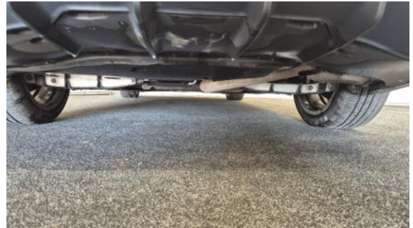
Fot. 26 Spód pojazdu tył