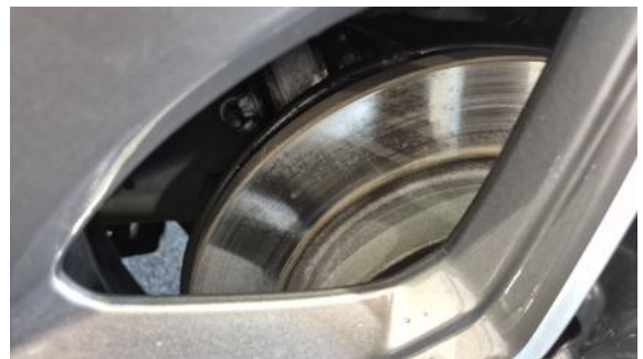
Fot. 30 Tarcza hamulcowa tylna lewa