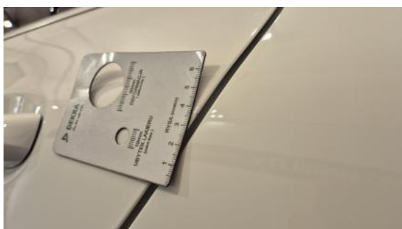
Fot. 47 Drzwi tylne L - Rysa/odprysk 1