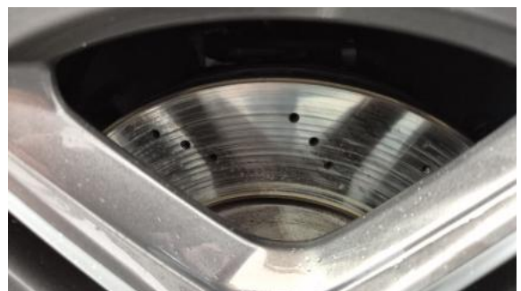
Fot. 28 Tarcza hamulcowa przednia prawa