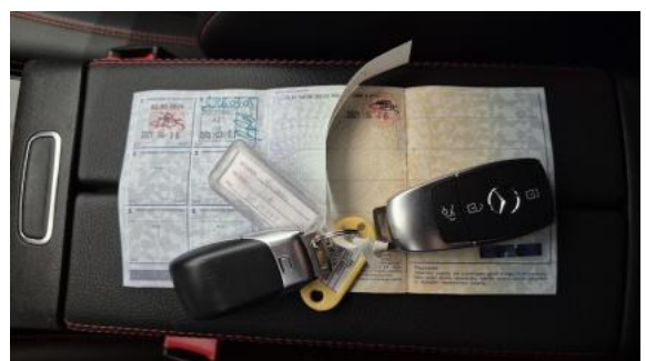
Fot. 32 Dow. Rej. Str.2 i klucze