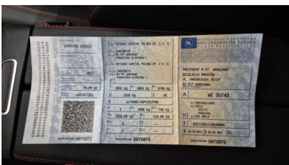
Fot. 31 Dowód rej. Str. 1