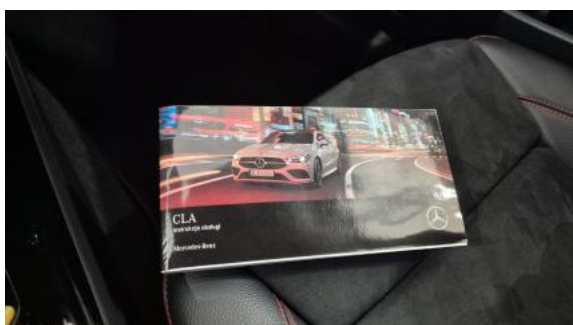
Fot. 35 Instrukcje