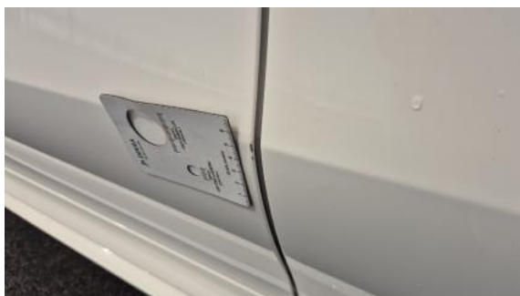
Fot. 45 Drzwi przed L - Rysa/odprysk 1