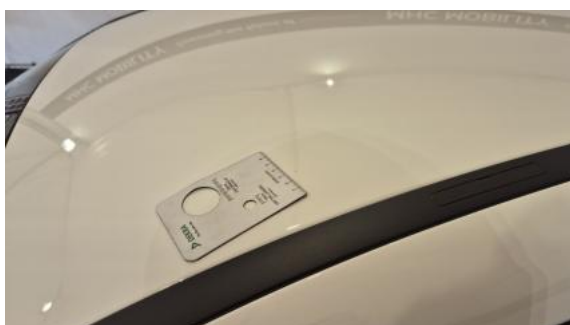
Fot. 43 Dach - Rysa/odprysk 1