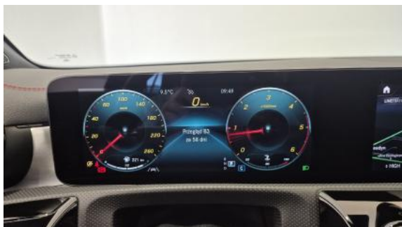
Fot. 33 Książka serwisowa – dane