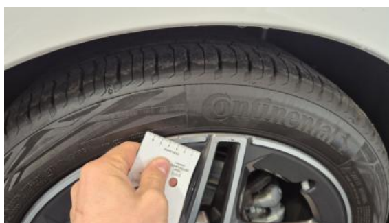
Fot. 44 Felga tylna L - Rysa/odprysk 1