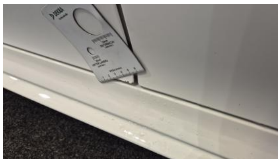
Fot. 46 Drzwi przed L - Rysa/odprysk 2