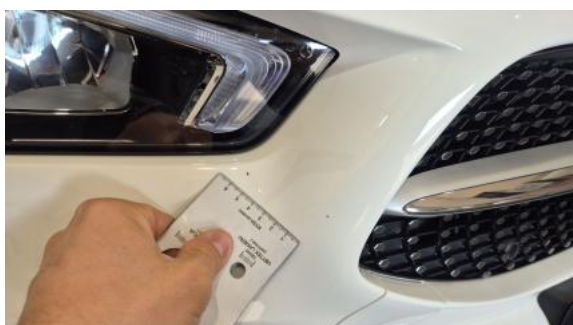
Fot. 39 Zderzak - Rysa/odprysk 1