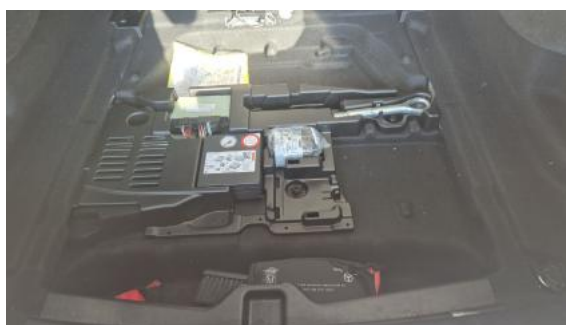
Fot. 36 Zestaw naprawczy koła