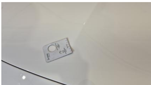
Fot. 37 Pokrywa komory silnika - Rysa/odprysk 1