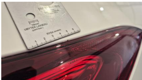
Fot. 41 Błotnik tylny P / Ściana boczna P - Rysa/odprysk 1