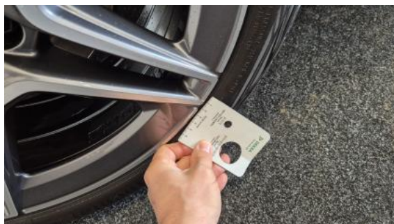
Fot. 42 Felga tylna P - Rysa/odprysk 1