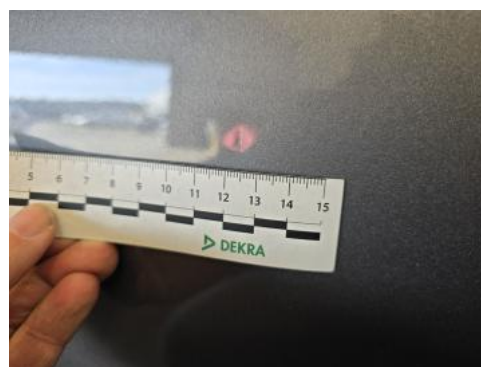
Fot. 46 Drzwi przed L - Wgniecenie/odkształcenie 1