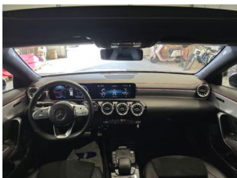
Fot. 19 Widok z tylnej kanapy na deskę rozdź.