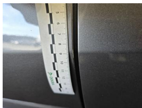
Fot. 44 Drzwi przed L - Rysa/odprysk 1