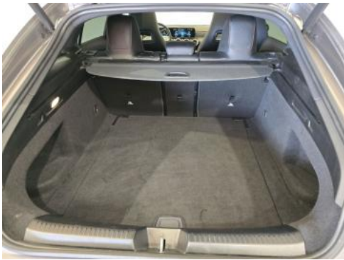
Fot. 25 Bagażnik