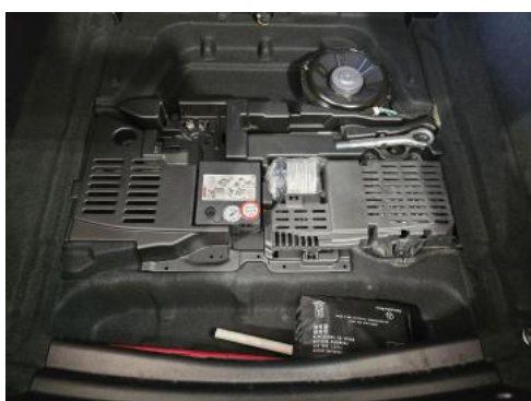
Fot. 35 Zestaw naprawczy koła