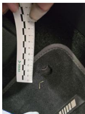
Fot. 47 Dywanik prze L - Pęknięcie/rozerwanie 1