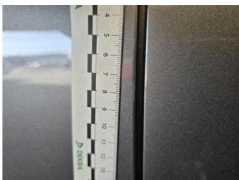
Fot. 45 Drzwi przed L() - Rysa/odprysk 3