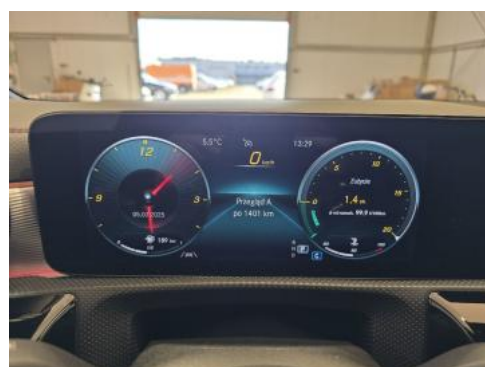
Fot. 16 Zestaw wskaźników - serwis