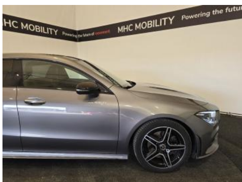
Fot. 5 Bok prawy z przodu