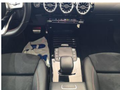
Fot. 21 Tunel środkowy