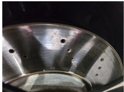
Fot. 28 Tarcza hamulcowa przednia lewa