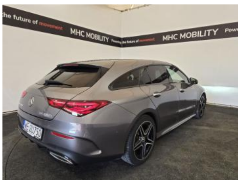
Fot. 7 Przekątna tylna prawa