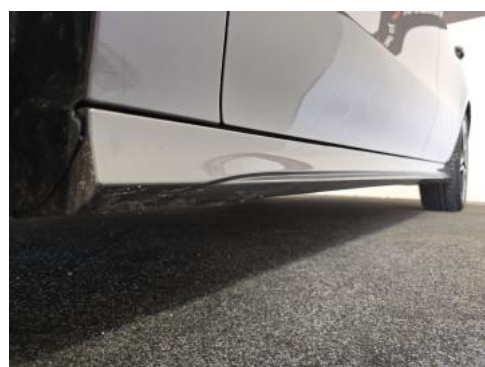
Fot. 12 Próg lewy (widok od przodu)