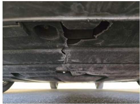
Fot. 26 Spód pojazdu przód