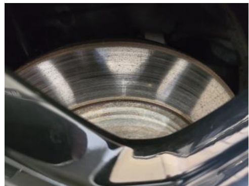
Fot. 30 Tarcza hamulcowa tylna prawa