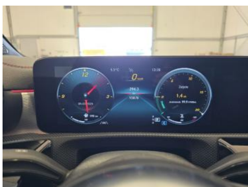
Fot. 15 Zestaw wskaźników - przebieg