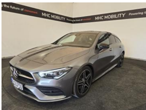
Fot. 1 Przekątna przednia lewa