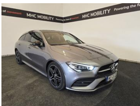
Fot. 3 Przekątna przednia prawa