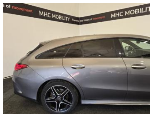
Fot. 6 Bok prawy z tyłu