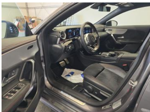
Fot. 17 Widok przez otwarte drzwi przednie lewe