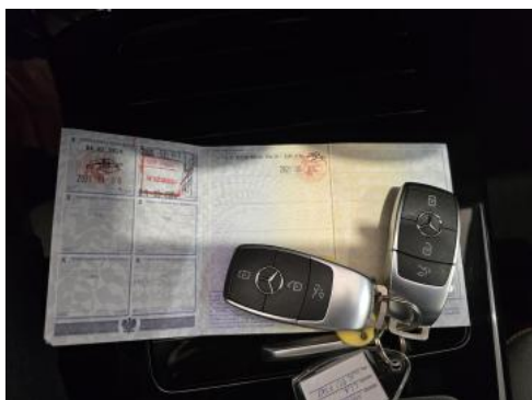
Fot. 33 Dow. Rej. Str.2 i klucze