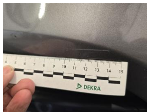
Fot. 40 Zderzak() - Rysa/odprysk 3