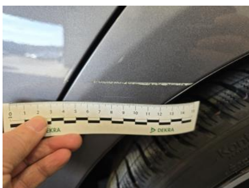
Fot. 43 Błotnik tylny L / Ściana boczna L - Rysa/odprysk 1