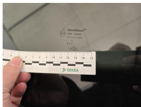
Fot. 38 Szyba czołowa - Inne 1