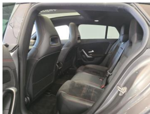
Fot. 18 Widok przez otwarte drzwi tylne lewe