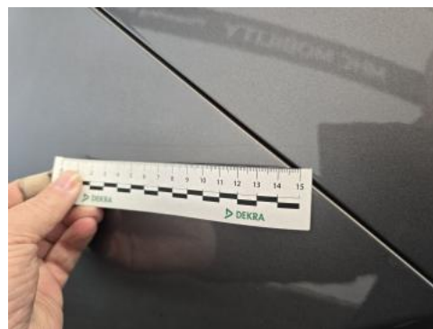
Fot. 42 Zderzak tylny - Rysa/odprysk 1