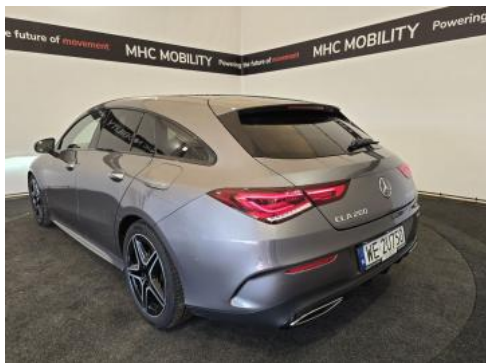
Fot. 9 Przekątna tylna lewa