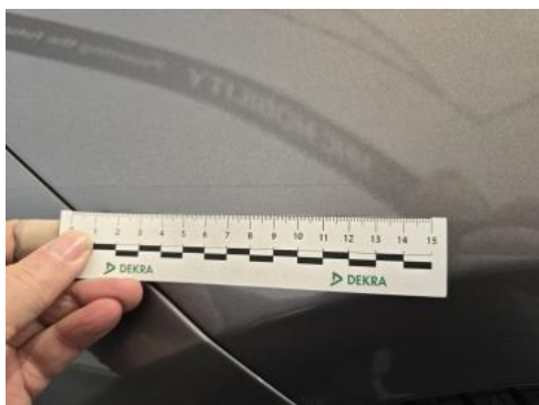
Fot. 41 Błotnik tylny P / Ściana boczna P - Rysa/odprysk 1