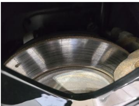
Fot. 31 Tarcza hamulcowa tylna lewa