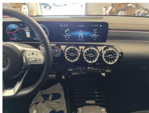
Fot. 20 Konsola środkowa