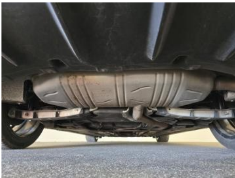
Fot. 27 Spód pojazdu tył