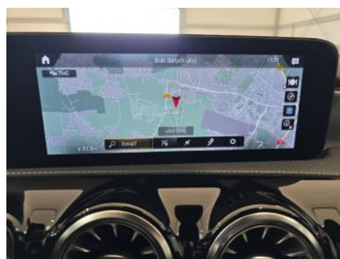
Fot. 36 nawigacja