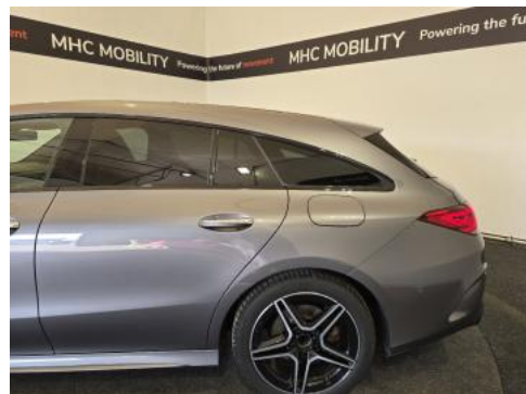
Fot. 10 Bok lewy z tyłu