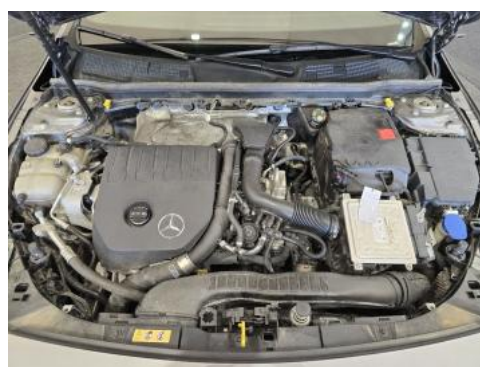
Fot. 24 Komora silnika