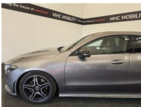
Fot. 11 Bok lewy z przodu