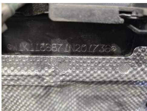
Fot. 13 Numer identyfikacyjny