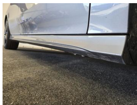
Fot. 4 Próg prawy (widok od przodu)