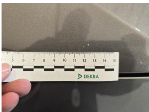
Fot. 37 Pokrywa komory silnika - Rysa/odprysk 1