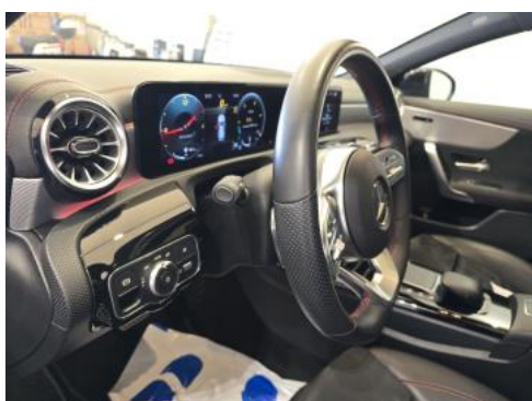
Fot. 23 Kierownica z lewej strony