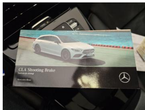
Fot. 34 Instrukcje