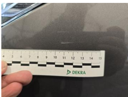
Fot. 39 Zderzak - Rysa/odprysk 1