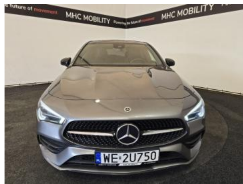
Fot. 2 Przód