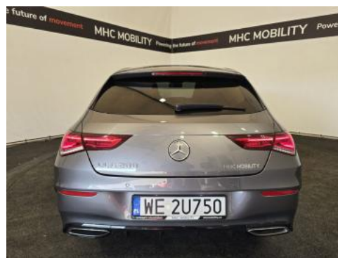
Fot. 8 Tył