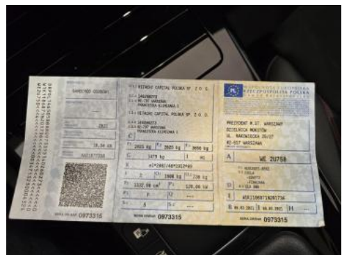
Fot. 32 Dowód rej. Str. 1