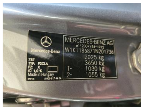
Fot. 14 Tabliczka znamionowa