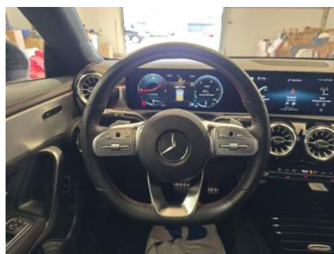
Fot. 22 Kierownica (na wprost)