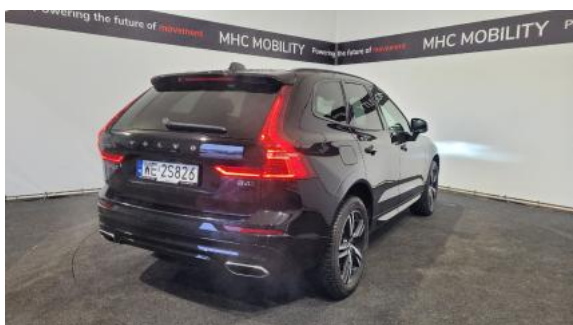
Fot. 7 Przekątna tylna prawa