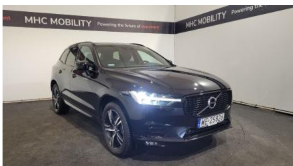
Fot. 3 Przekątna przednia prawa