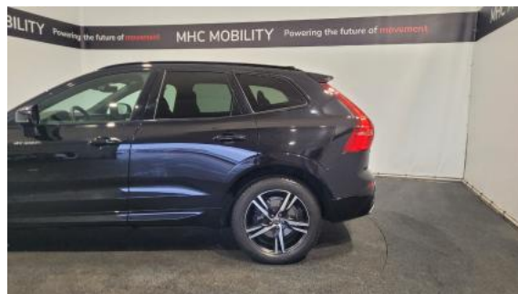
Fot. 10 Bok lewy z tyłu