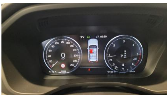
Fot. 15 Zestaw wskaźników - przebieg