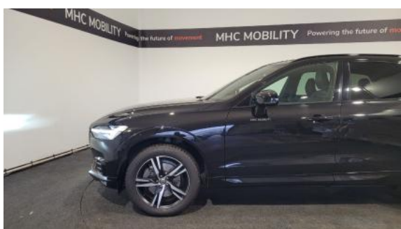
Fot. 11 Bok lewy z przodu