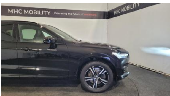
Fot. 5 Bok prawy z przodu