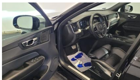
Fot. 16 Widok przez otwarte drzwi przednie lewe