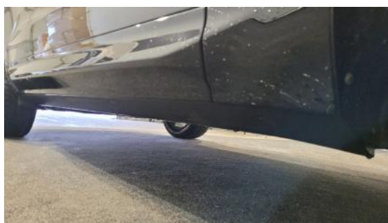
Fot. 4 Próg prawy (widok od przodu)