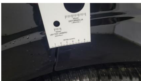
Fot. 35 Błotnik tylny L / Ściana boczna L - Rysa/odprysk 1