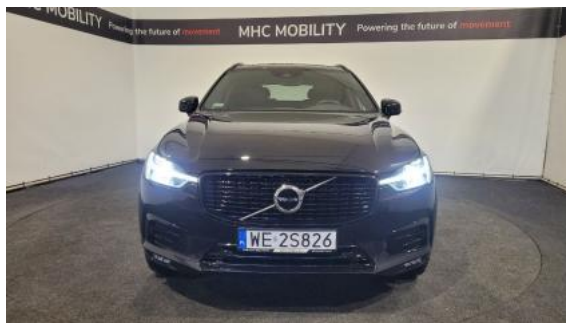
Fot. 2 Przód