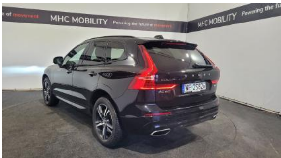
Fot. 9 Przekątna tylna lewa