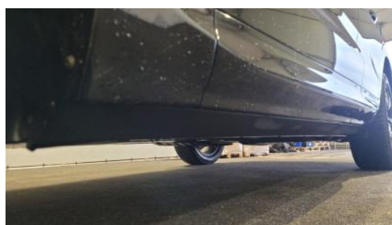
Fot. 12 Próg lewy (widok od przodu)