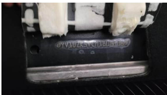
Fot. 13 Numer identyfikacyjny