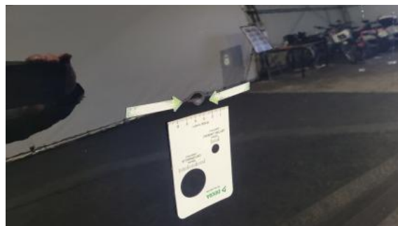
Fot. 34 Drzwi przednie P - Wgniecenie/odkształcenie 1