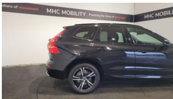
Fot. 6 Bok prawy z tyłu