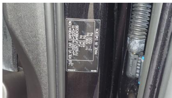
Fot. 14 Tabliczka znamionowa