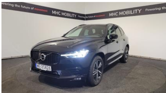
Fot. 1 Przekątna przednia lewa