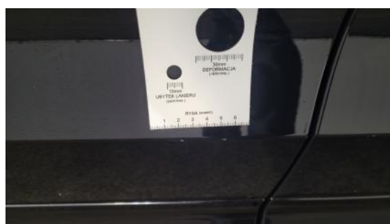
Fot. 36 Drzwi przed L - Rysa/odprysk 1