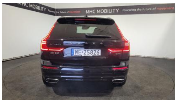
Fot. 8 Tył