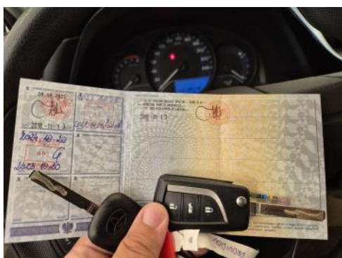
Fot. 29 Dow. Rej. Str.2 i klucze