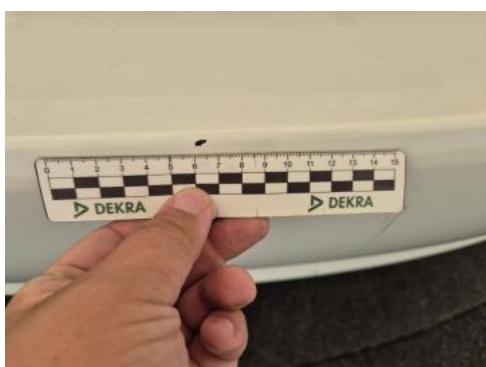
Fot. 39 Zderzak tylny - Rysa/odprysk 2