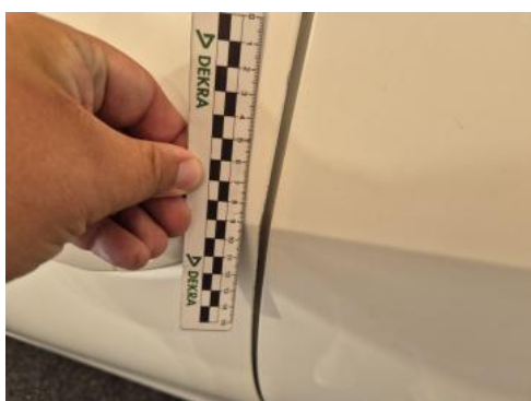
Fot. 43 Drzwi przed L - Rysa/odprysk 1