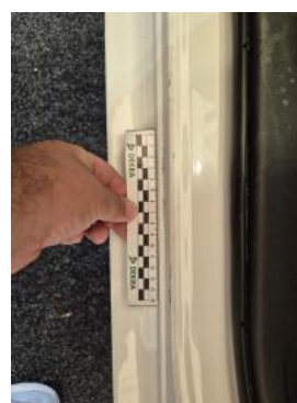
Fot. 44 Próg L - Rysa/odprysk 1