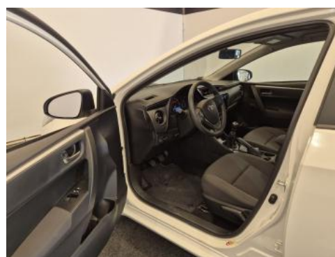
Fot. 16 Widok przez otwarte drzwi przednie lewe