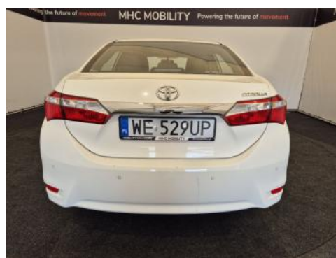
Fot. 8 Tył