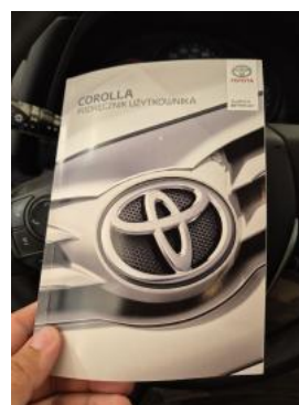
Fot. 30 Instrukcje