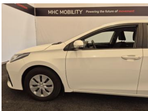
Fot. 11 Bok lewy z przodu