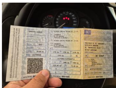
Fot. 28 Dowód rej. Str. 1