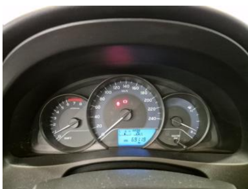
Fot. 15 Zestaw wskaźników - przebieg