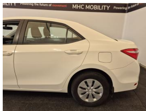
Fot. 10 Bok lewy z tyłu