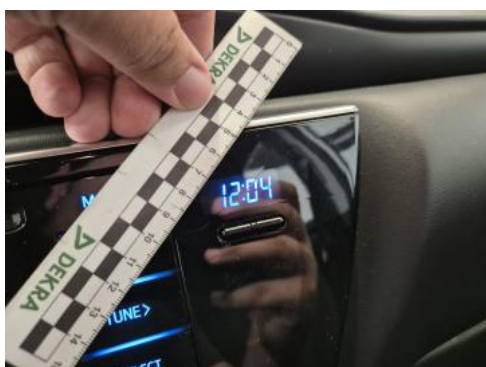
Fot. 45 Konsola środkowa - Pęknięcie/rozerwanie 1