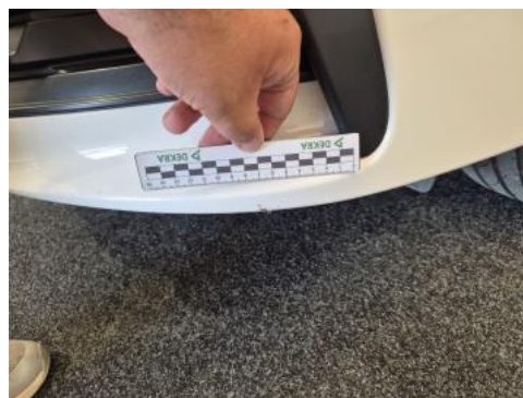
Fot. 34 Zderzak - Rysa/odprysk 1