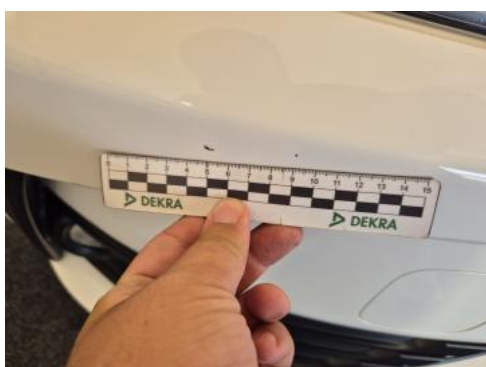
Fot. 35 Zderzak - Rysa/odprysk 2