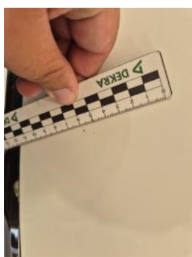
Fot. 31 Pokrywa komory silnika - Rysa/odprysk 1