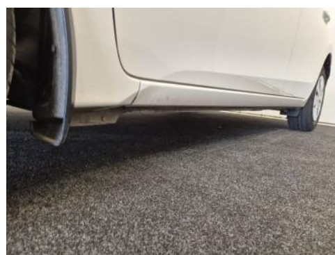
Fot. 12 Próg lewy (widok od przodu)