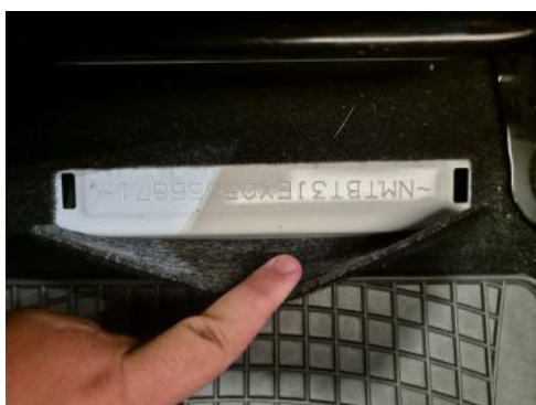
Fot. 13 Numer identyfikacyjny