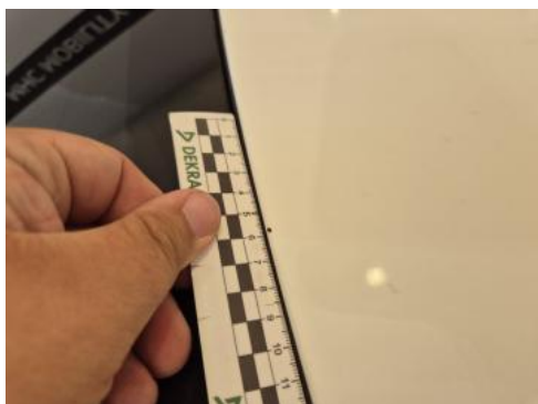
Fot. 41 Dach - Rysa/odprysk 1