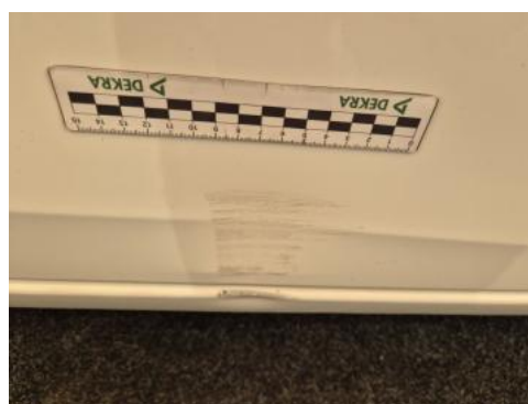
Fot. 36 Drzwi przednie P - Wgniecenie/odkształcenie 1