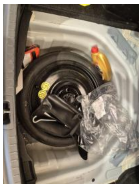
Fot. 25 Koło zapasowe