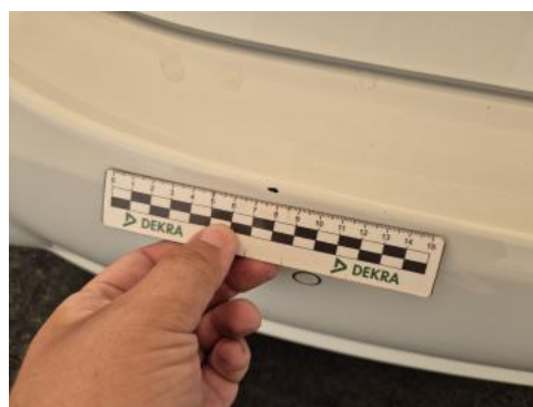
Fot. 38 Zderzak tylny - Rysa/odprysk 1