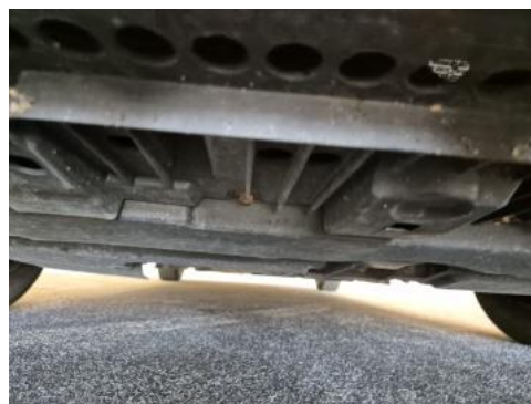
Fot. 26 Spód pojazdu przód