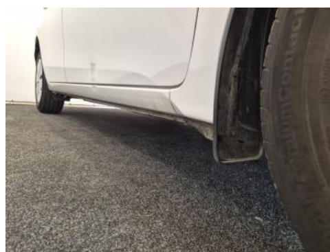
Fot. 4 Próg prawy (widok od przodu)