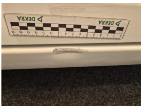
Fot. 37 Próg P - Wgniecenie/odkształcenie 1