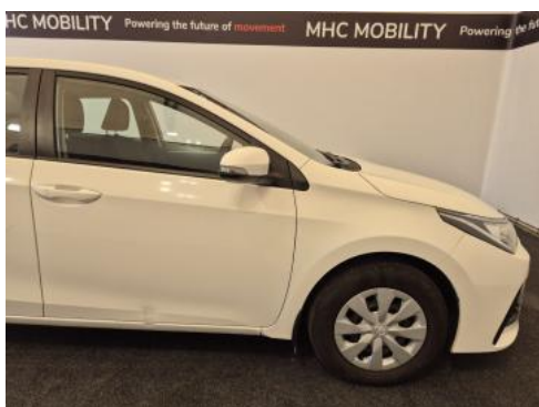
Fot. 5 Bok prawy z przodu