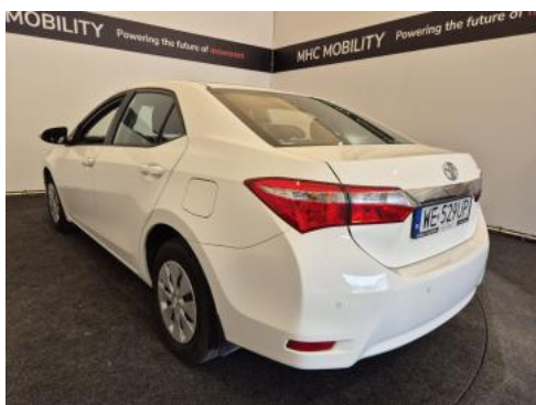
Fot. 9 Przekątna tylna lewa