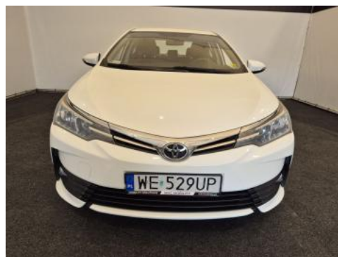
Fot. 2 Przód