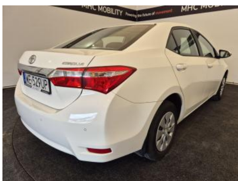
Fot. 7 Przekątna tylna prawa