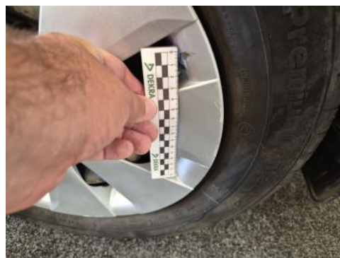
Fot. 42 Kołpak tylny L - Rysa/odprysk 1