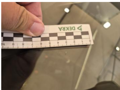
Fot. 33 Szyba czołowa - Rysa/odprysk 1