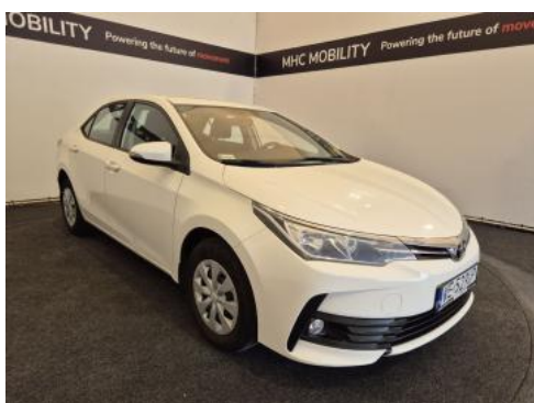
Fot. 3 Przekątna przednia prawa