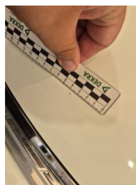
Fot. 32 Pokrywa komory silnika - Rysa/odprysk 2