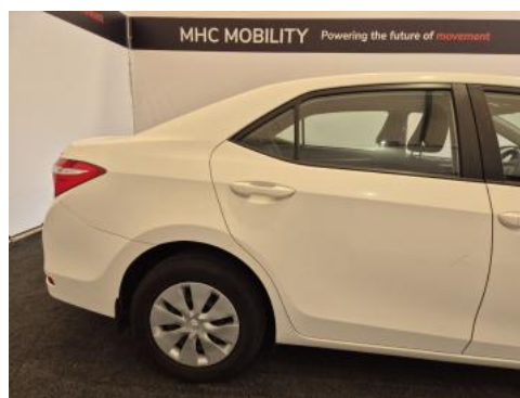
Fot. 6 Bok prawy z tyłu