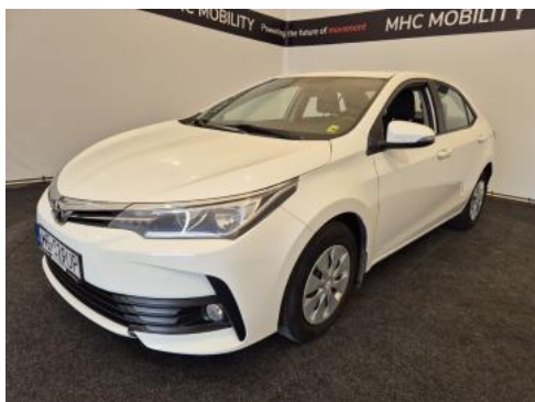
Fot. 1 Przekątna przednia lewa