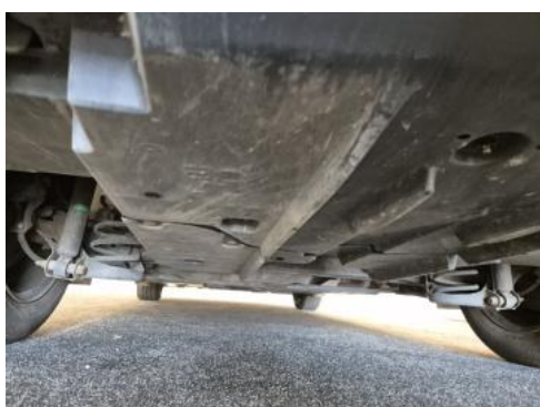
Fot. 27 Spód pojazdu tył