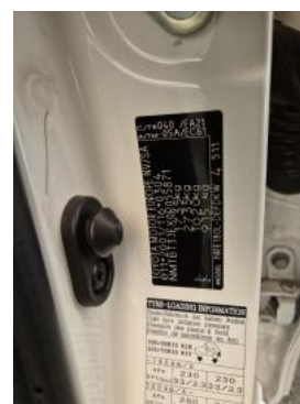
Fot. 14 Tabliczka znamionowa