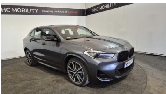
Fot. 3 Przekątna przednia prawa