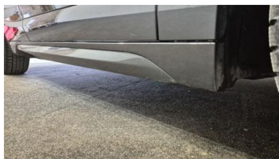
Fot. 4 Próg prawy (widok od przodu)