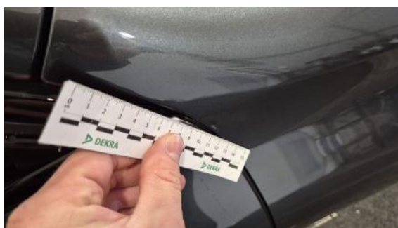
Fot. 36 Błotnik przedni P - Rysa/odprysk 1