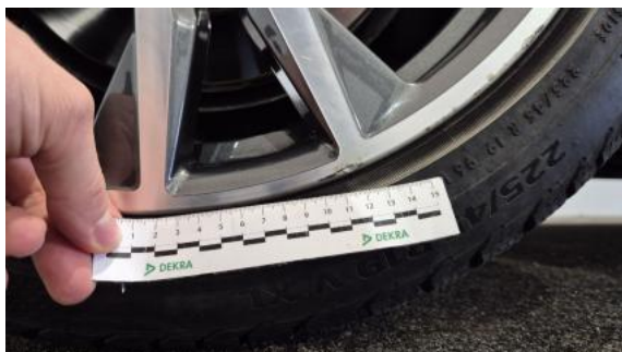
Fot. 41 Felga tylna P - Rysa/odprysk 2