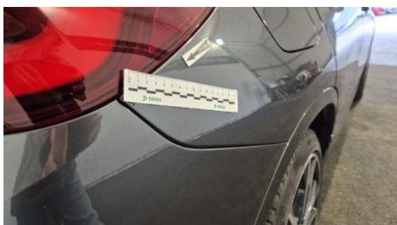
Fot. 39 Błotnik tylny P / Ściana boczna P - Wgniecenie/odkształcenie 1