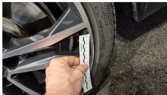
Fot. 50 Felga przednia L() - Rysa/odprysk 3