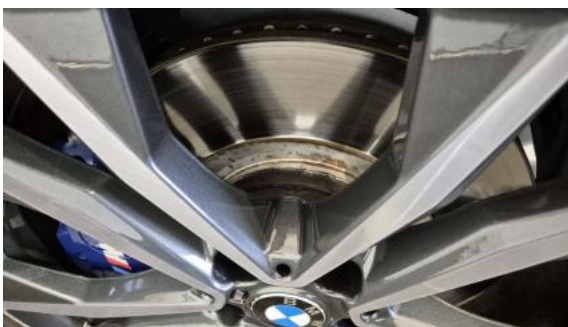
Fot. 27 Tarcza hamulcowa przednia lewa