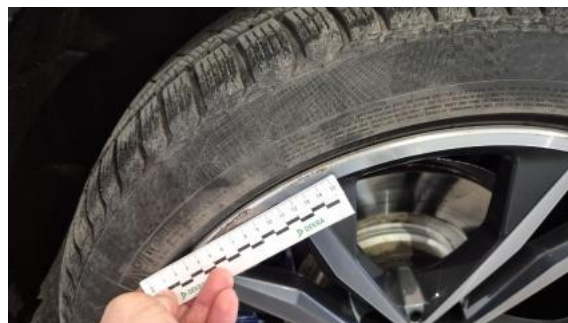
Fot. 42 Felga tylna P() - Rysa/odprysk 3