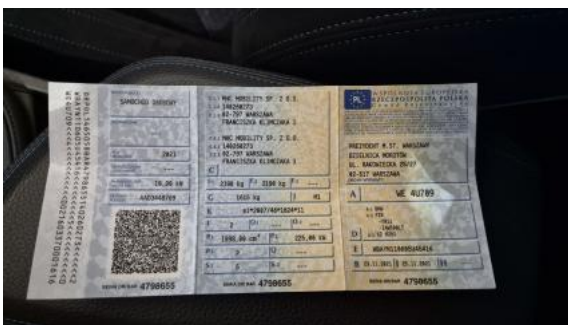
Fot. 31 Dowód rej. Str. 1