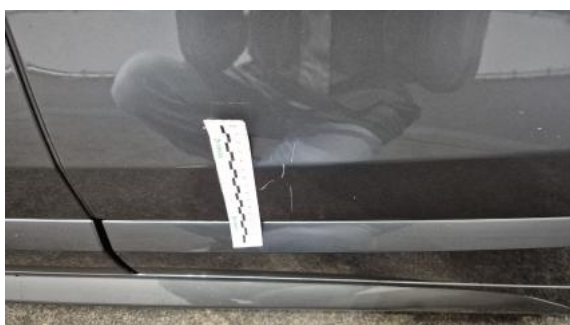
Fot. 47 Drzwi tylne L - Rysa/odprysk 1