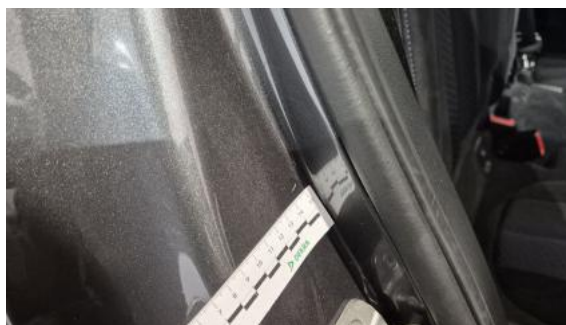
Fot. 38 Błotnik tylny P / Ściana boczna P - Rysa/odprysk 1