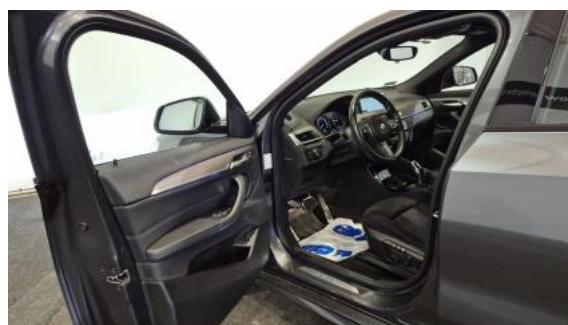
Fot. 16 Widok przez otwarte drzwi przednie lewe