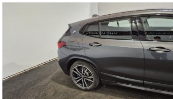
Fot. 6 Bok prawy z tyłu