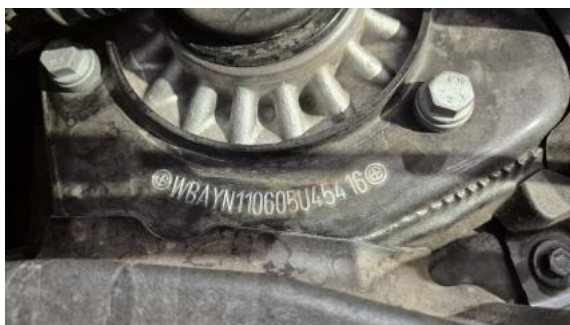
Fot. 13 Numer identyfikacyjny