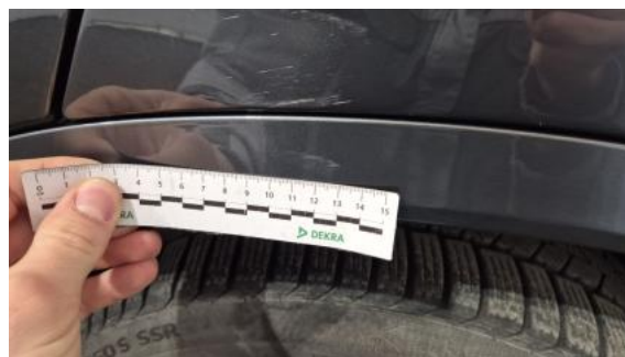
Fot. 46 Listwa krawędzi błotnika tył L - Rysa/odprysk 1