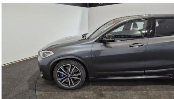
Fot. 11 Bok lewy z przodu