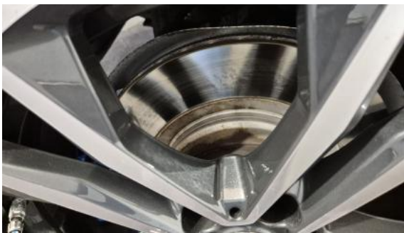
Fot. 29 Tarcza hamulcowa tylna prawa