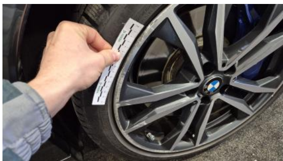
Fot. 37 Felga przednia P - Rysa/odprysk 1