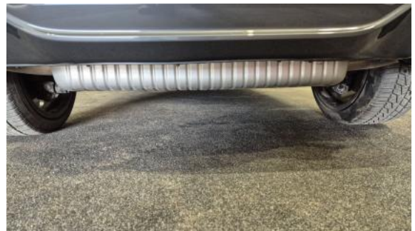
Fot. 26 Spód pojazdu tył