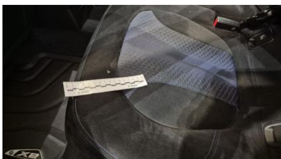
Fot. 51 Kanapa tyl. - Inne 1