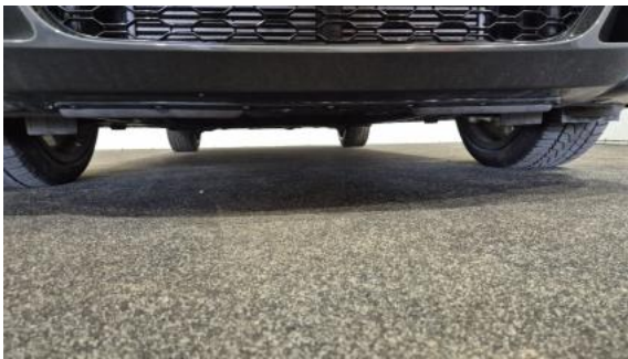
Fot. 25 Spód pojazdu przód