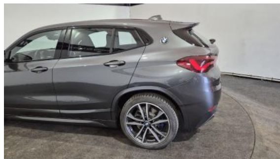
Fot. 10 Bok lewy z tyłu