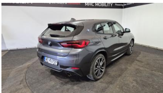
Fot. 7 Przekątna tylna prawa