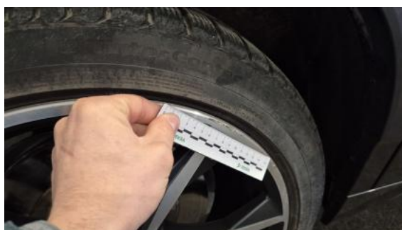
Fot. 40 Felga tylna P - Rysa/odprysk 1