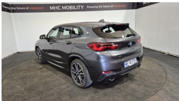
Fot. 9 Przekątna tylna lewa