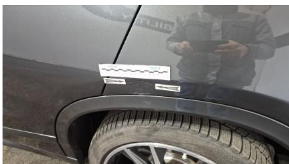
Fot. 43 Błotnik tylny L / Ściana boczna L - Wgniecenie/odkształcenie 1