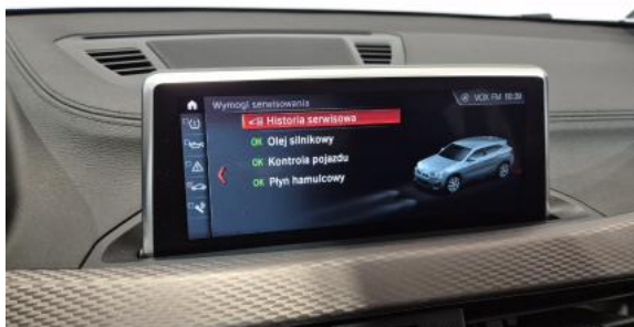
Fot. 33 Książka serwisowa – dane