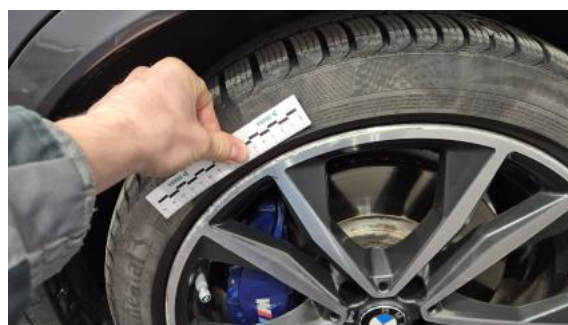
Fot. 48 Felga przednia L - Rysa/odprysk 1