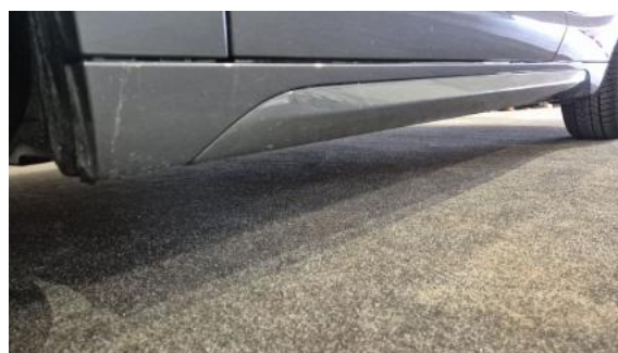
Fot. 12 Próg lewy (widok od przodu)