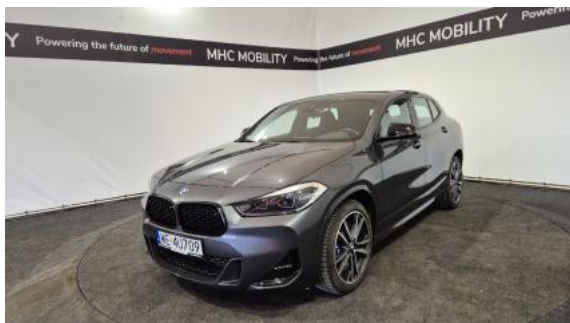
Fot. 1 Przekątna przednia lewa