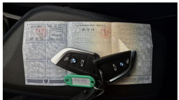
Fot. 32 Dow. Rej. Str.2 i klucze