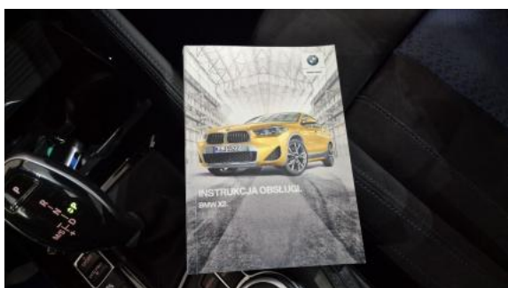
Fot. 35 Instrukcje