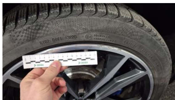
Fot. 44 Felga tylna L - Rysa/odprysk 1