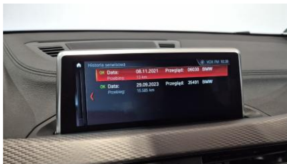
Fot. 34 Książka serwisowa – ostatni przegląd