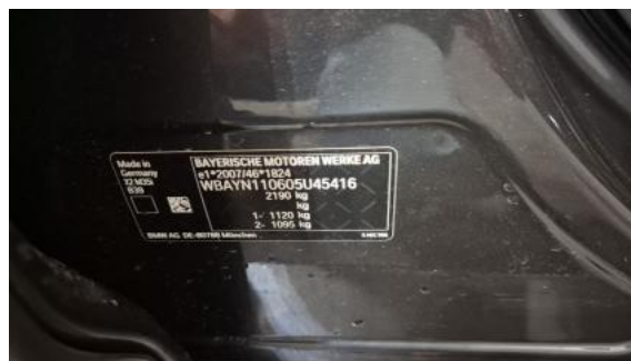
Fot. 14 Tabliczka znamionowa