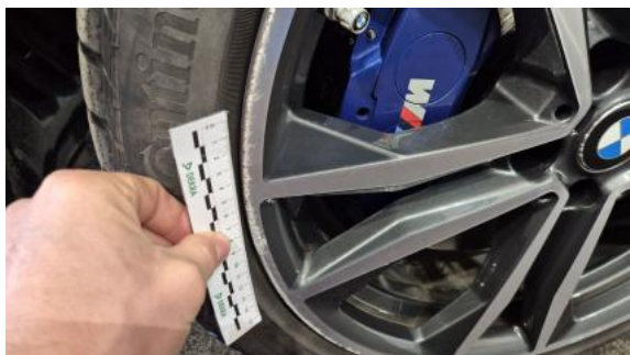
Fot. 49 Felga przednia L - Rysa/odprysk 2