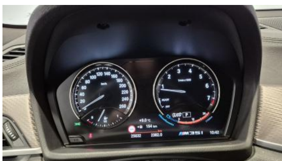
Fot. 15 Zestaw wskaźników - przebieg