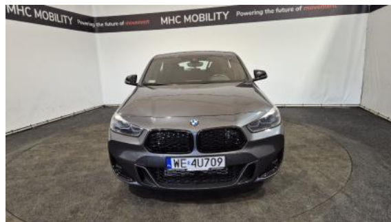
Fot. 2 Przód