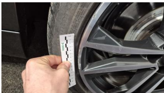
Fot. 45 Felga tylna L - Rysa/odprysk 2