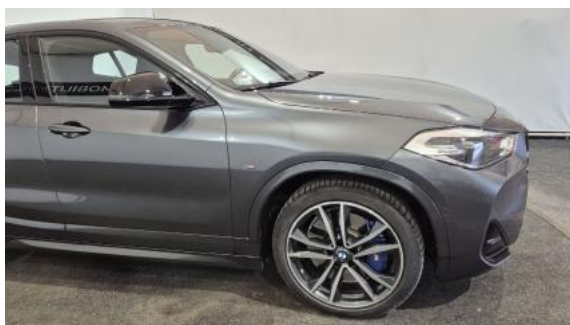
Fot. 5 Bok prawy z przodu