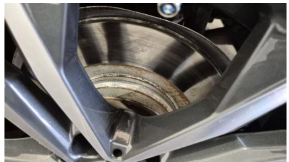
Fot. 30 Tarcza hamulcowa tylna lewa