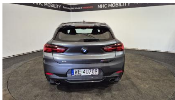
Fot. 8 Tył