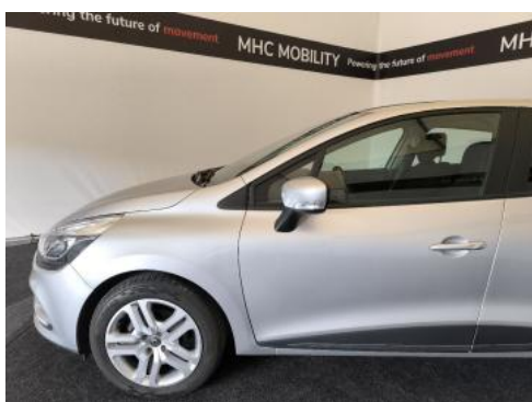
Fot. 11 Bok lewy z przodu