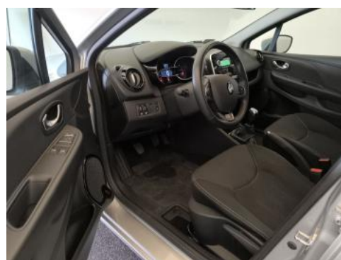
Fot. 16 Widok przez otwarte drzwi przednie lewe