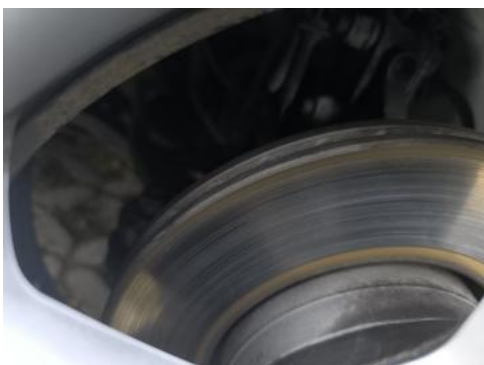
Fot. 29 Tarcza hamulcowa przednia prawa