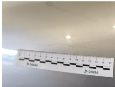
Fot. 50 Drzwi tylne L - Rysa/odprysk 1