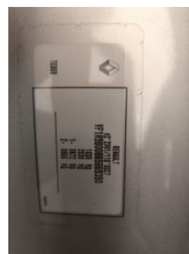
Fot. 14 Tabliczka znamionowa