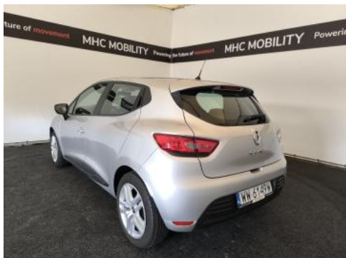
Fot. 9 Przekątna tylna lewa