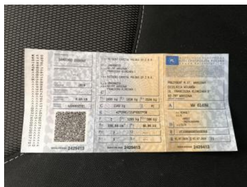
Fot. 32 Dowód rej. Str. 1