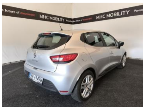
Fot. 7 Przekątna tylna prawa