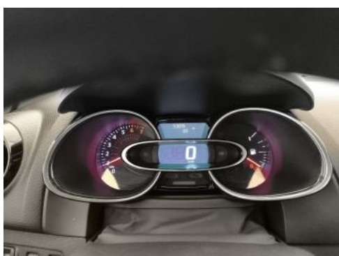
Fot. 15 Zestaw wskaźników - przebieg