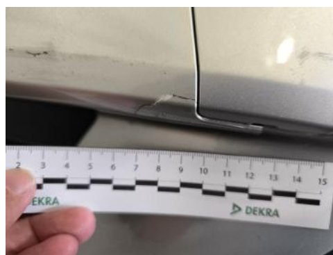
Fot. 38 Zderzak - Pęknięcie/rozerwanie 1