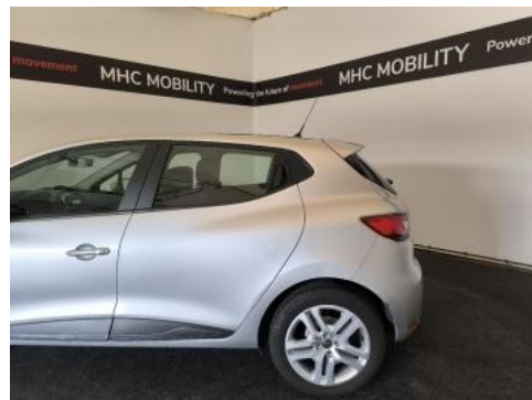
Fot. 10 Bok lewy z tyłu