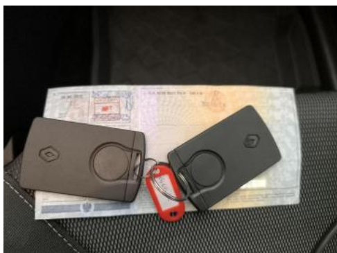
Fot. 33 Dow. Rej. Str.2 i klucze