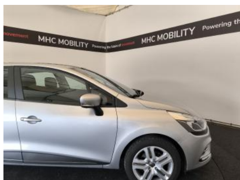
Fot. 5 Bok prawy z przodu