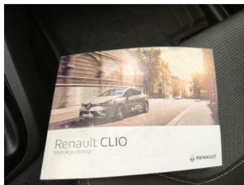
Fot. 34 Instrukcje