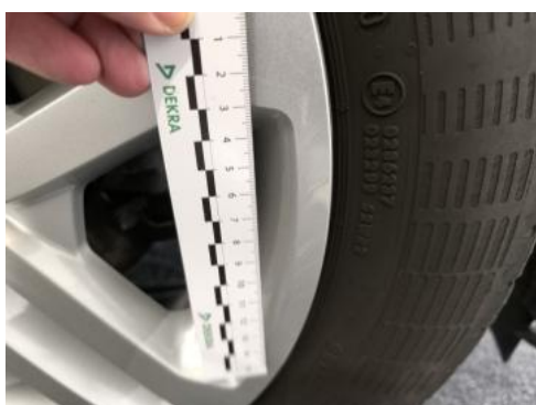
Fot. 39 Kołpak przedni P - Rysa/odprysk 1