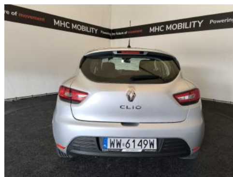
Fot. 8 Tył