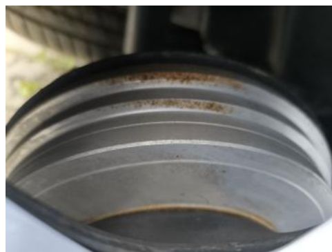
Fot. 30 Tarcza hamulcowa tylna prawa