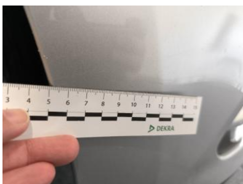
Fot. 35 Zderzak - zdjęcie poglądowe 2