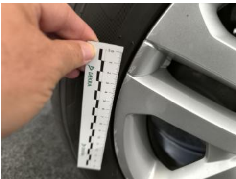
Fot. 45 Kołpak tylny P() - Rysa/odprysk 3