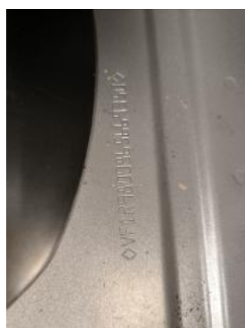
Fot. 13 Numer identyfikacyjny