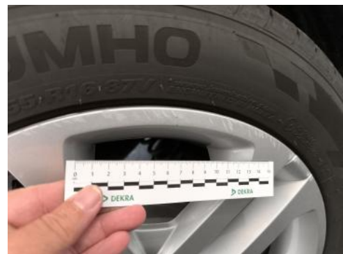
Fot. 44 Kołpak tylny P - Rysa/odprysk 1