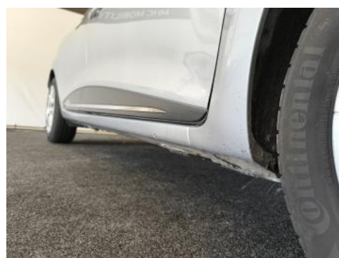
Fot. 4 Próg prawy (widok od przodu)