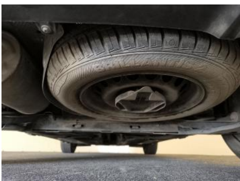
Fot. 27 Spód pojazdu tył