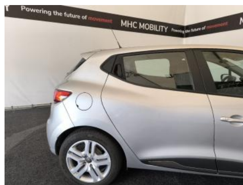
Fot. 6 Bok prawy z tyłu