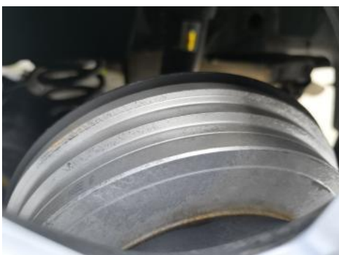
Fot. 31 Tarcza hamulcowa tylna lewa