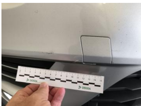
Fot. 37 Zderzak() - Rysa/odprysk 3