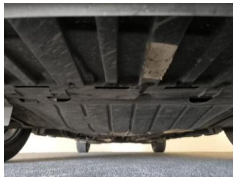
Fot. 26 Spód pojazdu przód