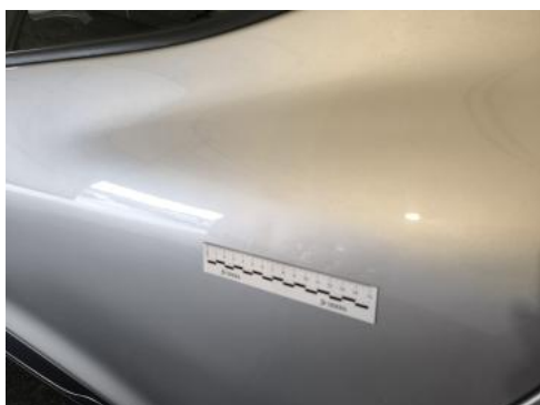
Fot. 51 Drzwi tylne L - Wgniecenie/odkształcenie 1