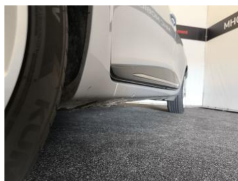
Fot. 12 Próg lewy (widok od przodu)