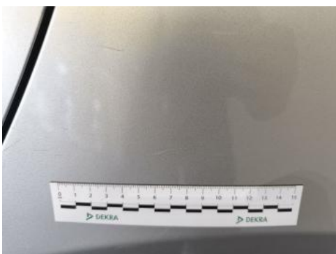
Fot. 47 Błotnik tylny L / Ściana boczna L - Rysa/odprysk 1