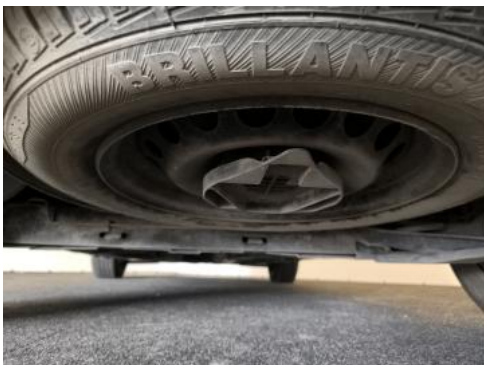
Fot. 25 Koło zapasowe