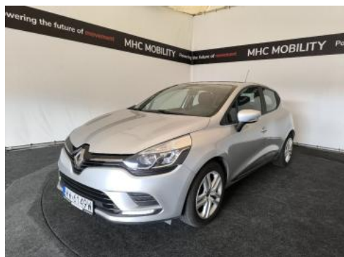
Fot. 1 Przekątna przednia lewa