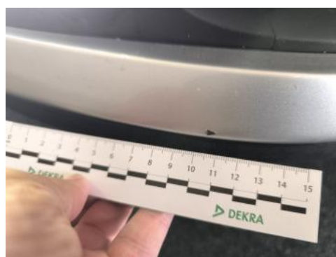
Fot. 36 Zderzak - Rysa/odprysk 1