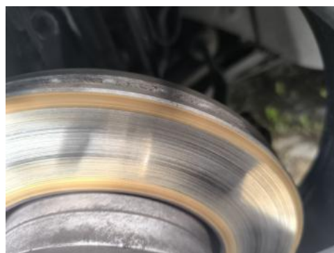
Fot. 28 Tarcza hamulcowa przednia lewa