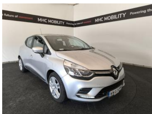
Fot. 3 Przekątna przednia prawa