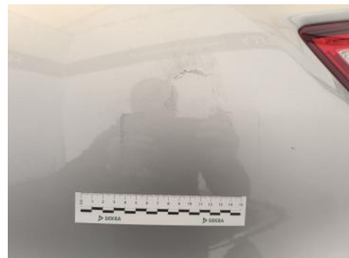
Fot. 46 Pokrywy bagażnika - Inne 1