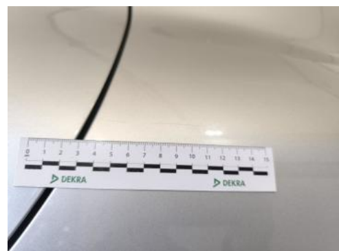
Fot. 48 Błotnik tylny L / Ściana boczna L - Rysa/odprysk 2