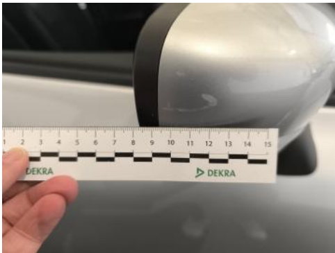
Fot. 41 Obudowa lusterka zew P - Rysa/odprysk 1