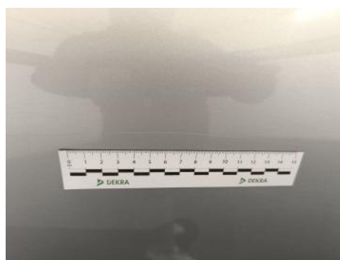
Fot. 40 Drzwi tylne P - Rysa/odprysk 1