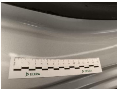
Fot. 43 Próg P() - Rysa/odprysk 3