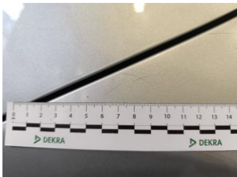
Fot. 49 Błotnik tylny L / Ściana boczna L() - Rysa/odprysk 3