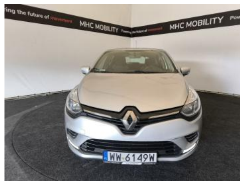
Fot. 2 Przód