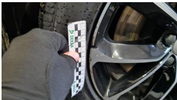
Fot. 41 Felga przednia P - Rysa/odprysk 1