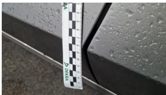
Fot. 46 Drzwi przed L - Rysa/odprysk 2