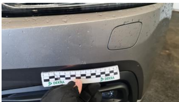
Fot. 37 Zderzak - zdjęcie poglądowe 1