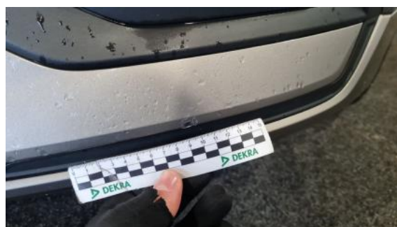
Fot. 40 Zderzak() - Rysa/odprysk 3