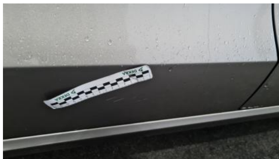
Fot. 42 Drzwi tylne P - Rysa/odprysk 1