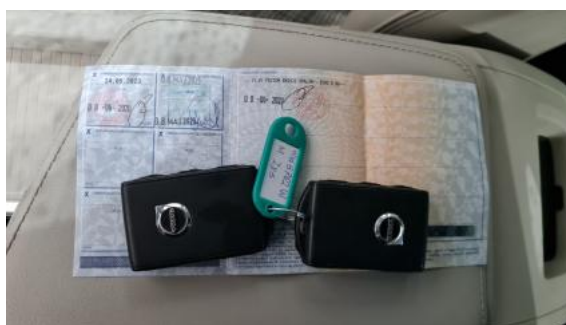
Fot. 32 Dow. Rej. Str.2 i klucze