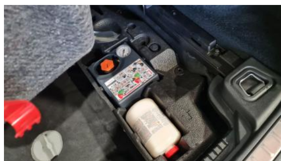
Fot. 36 Zestaw naprawczy koła