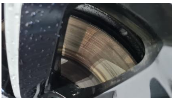
Fot. 27 Tarcza hamulcowa przednia lewa