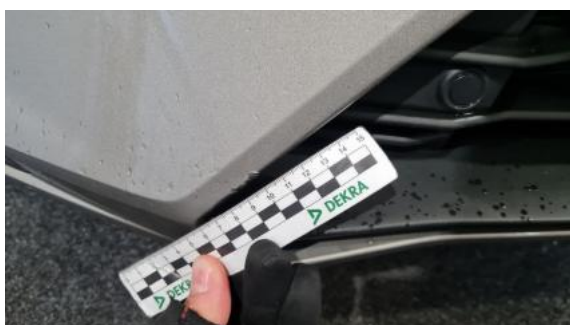
Fot. 39 Zderzak - Rysa/odprysk 2