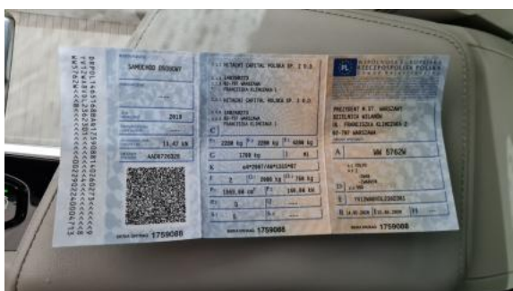
Fot. 31 Dowód rej. Str. 1