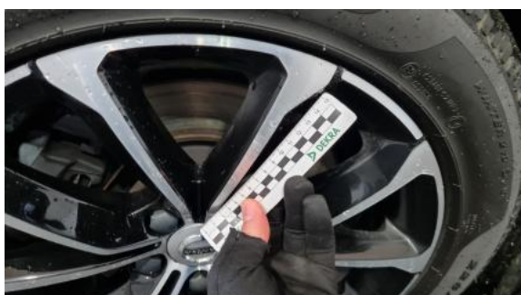
Fot. 47 Felga przednia L - Rysa/odprysk 1