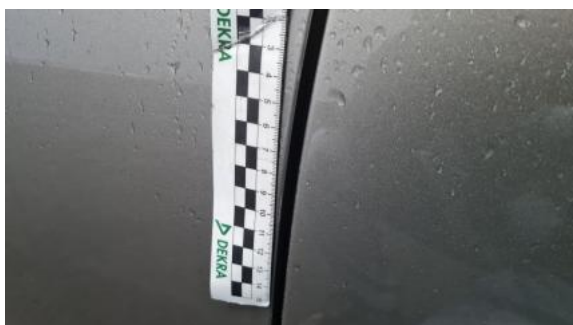
Fot. 45 Drzwi przed L - Rysa/odprysk 1