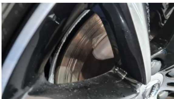
Fot. 29 Tarcza hamulcowa tylna prawa