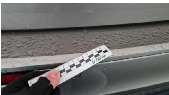
Fot. 43 Zderzak tylny - Rysa/odprysk 1