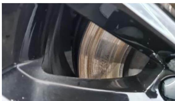
Fot. 28 Tarcza hamulcowa przednia prawa