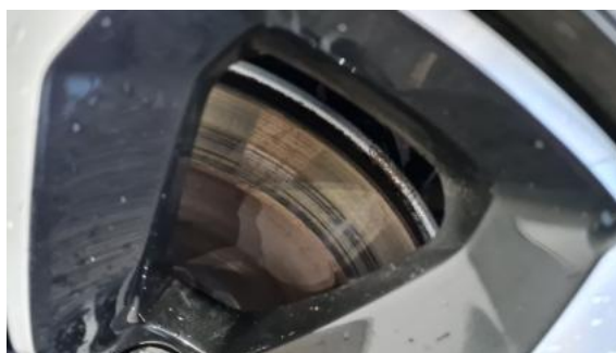
Fot. 30 Tarcza hamulcowa tylna lewa