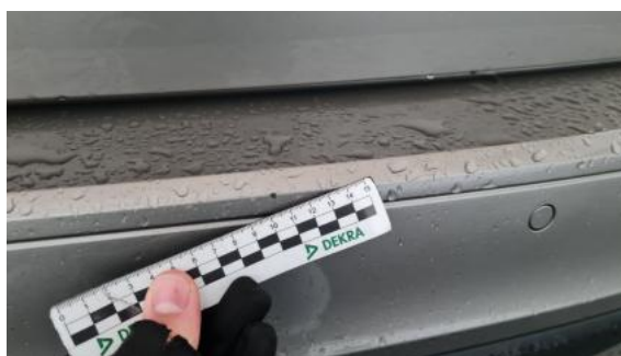
Fot. 44 Zderzak tylny - Rysa/odprysk 2