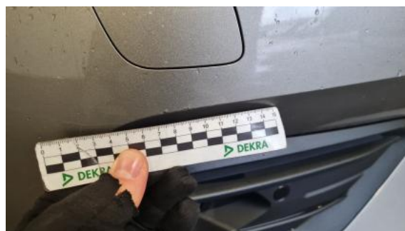
Fot. 38 Zderzak - Rysa/odprysk 1