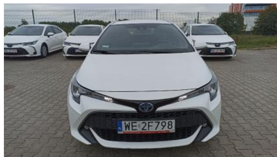
Fot. 2 Przód