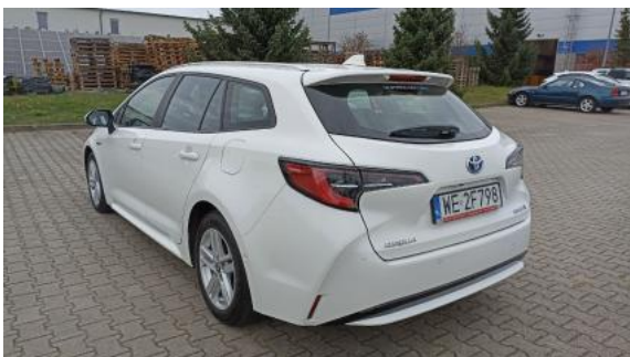
Fot. 9 Przekątna tylna lewa