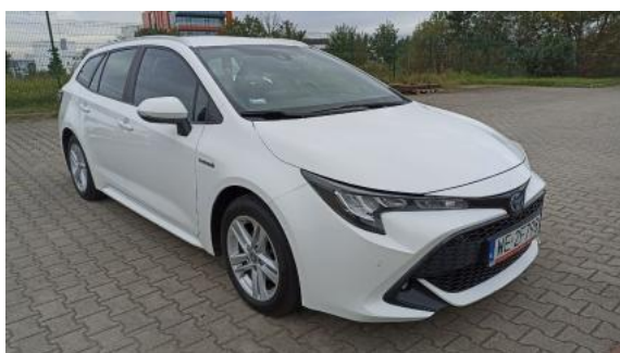
Fot. 3 Przekątna przednia prawa