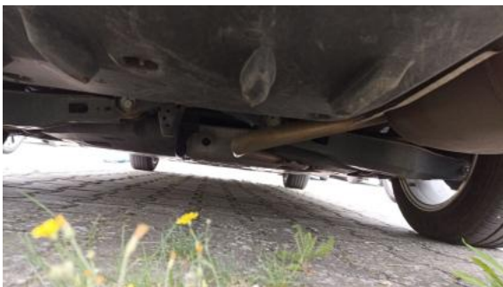
Fot. 27 Spód pojazdu tył