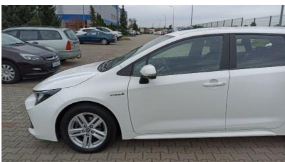
Fot. 11 Bok lewy z przodu