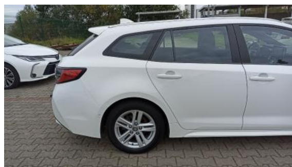
Fot. 6 Bok prawy z tyłu