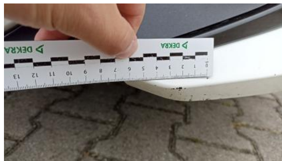
Fot. 38 Zderzak - Rysa/odprysk 1