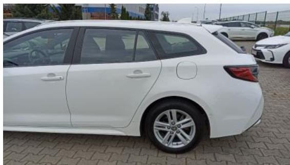
Fot. 10 Bok lewy z tyłu