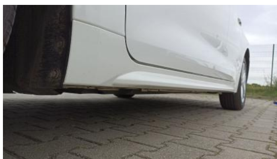
Fot. 12 Próg lewy (widok od przodu)