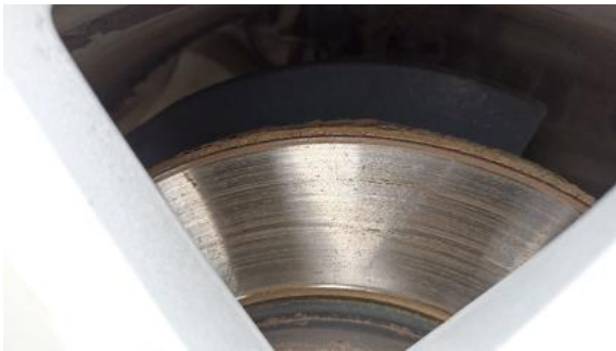
Fot. 29 Tarcza hamulcowa przednia prawa