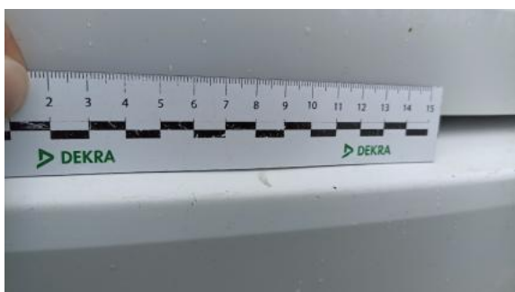
Fot. 43 Zderzak tylny - Rysa/odprysk 1