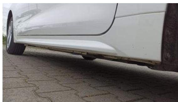
Fot. 4 Próg prawy (widok od przodu)