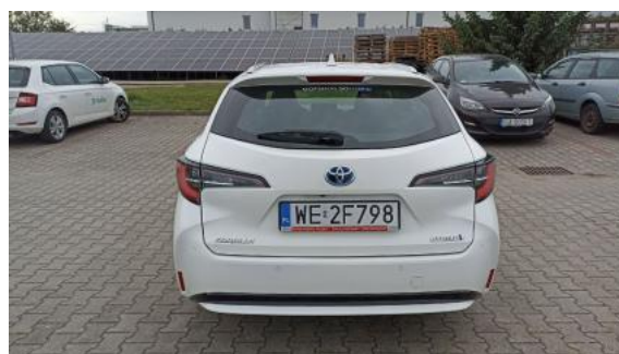
Fot. 8 Tył