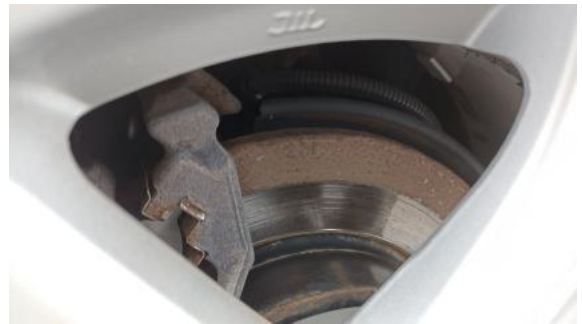
Fot. 30 Tarcza hamulcowa tylna prawa