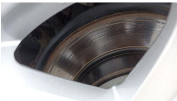
Fot. 31 Tarcza hamulcowa tylna lewa