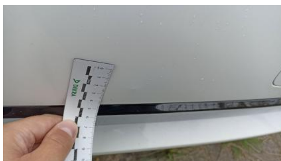
Fot. 44 Zderzak tylny - Wgniecenie/odkształcenie 1