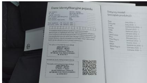
Fot. 34 Książka serwisowa – dane