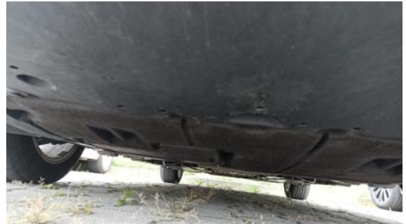
Fot. 26 Spód pojazdu przód