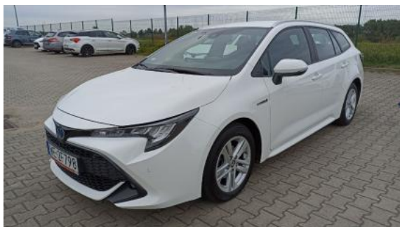
Fot. 1 Przekątna przednia lewa