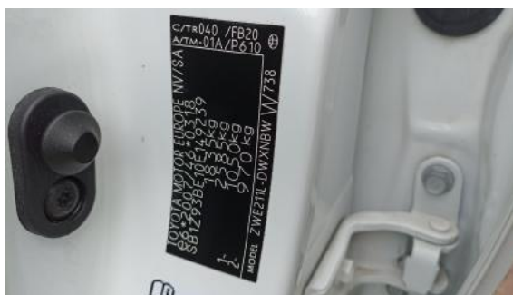
Fot. 14 Tabliczka znamionowa