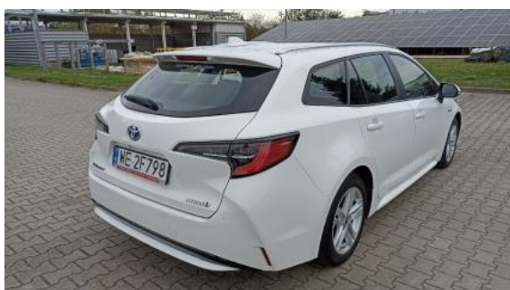
Fot. 7 Przekątna tylna prawa