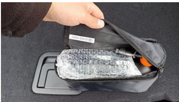
Fot. 37 Zdjęcie do protokołu