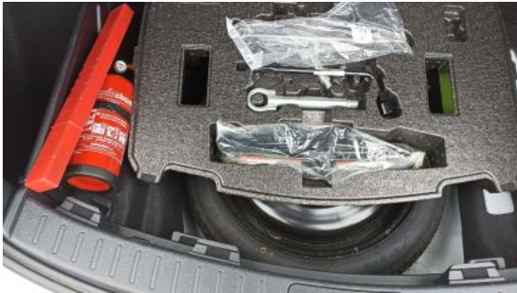
Fot. 25 Koło zapasowe