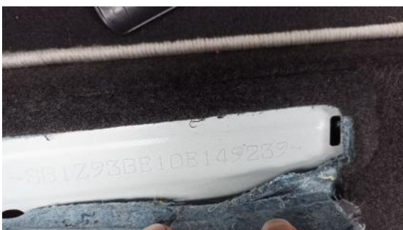
Fot. 13 Numer identyfikacyjny