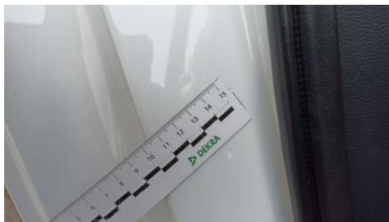
Fot. 42 Błotnik tylny P / Ściana boczna P - Wgniecenie/odkształcenie 1