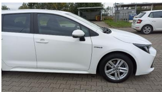
Fot. 5 Bok prawy z przodu