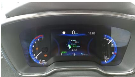
Fot. 15 Zestaw wskaźników - przebieg