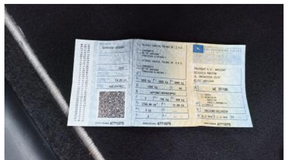
Fot. 32 Dowód rej. Str. 1