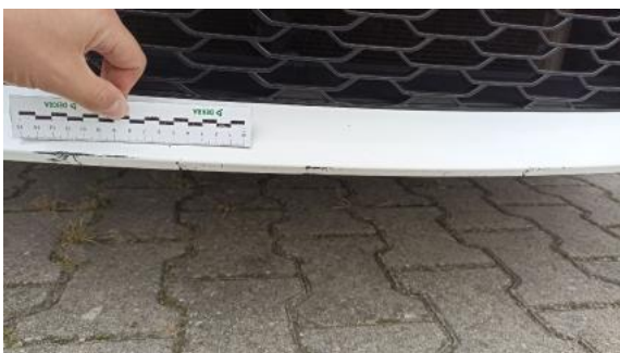
Fot. 39 Zderzak - Rysa/odprysk 2