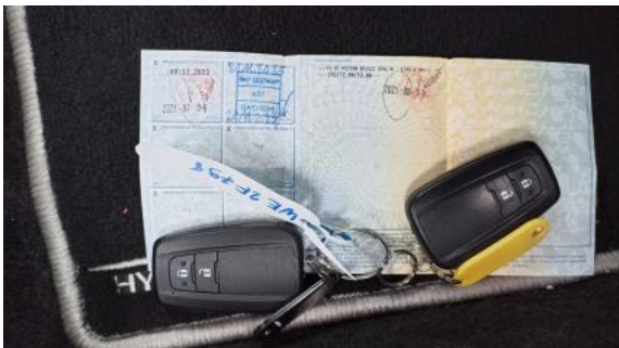
Fot. 33 Dow. Rej. Str.2 i klucze