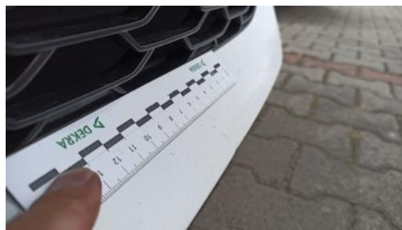
Fot. 40 Zderzak - Wgniecenie/odkształcenie 1