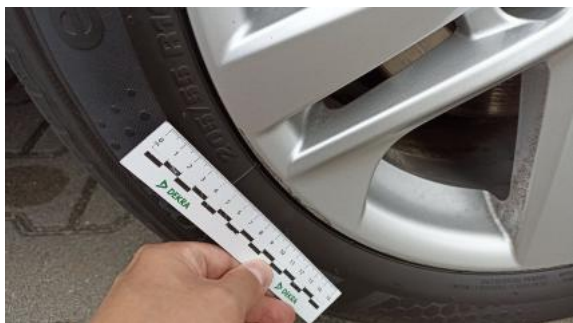
Fot. 41 Felga aluminiowa przednia P - Rysa/odprysk 1