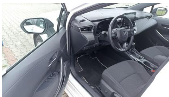
Fot. 16 Widok przez otwarte drzwi przednie lewe