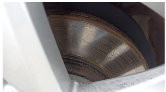
Fot. 28 Tarcza hamulcowa przednia lewa