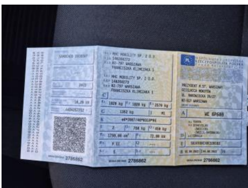
Fot. 31 Dowód rej. Str. 1