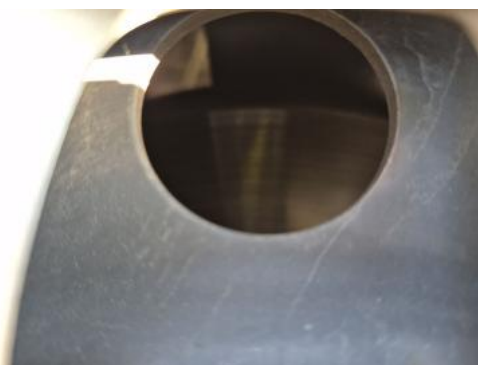
Fot. 27 Tarcza hamulcowa przednia lewa