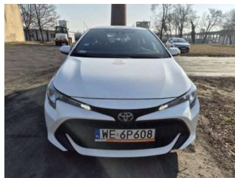
Fot. 2 Przód