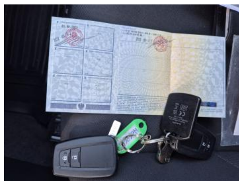
Fot. 32 Dow. Rej. Str.2 i klucze