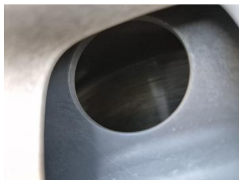
Fot. 28 Tarcza hamulcowa przednia prawa