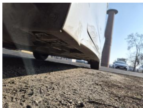
Fot. 12 Próg lewy (widok od przodu)