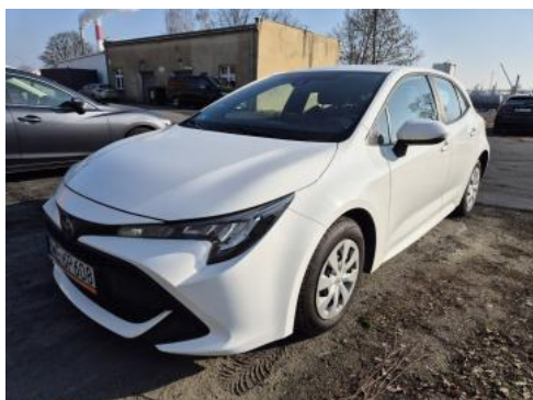
Fot. 1 Przekątna przednia lewa