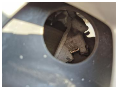
Fot. 30 Tarcza hamulcowa tylna lewa