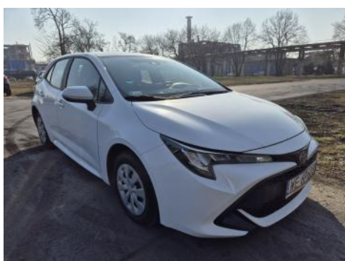
Fot. 3 Przekątna przednia prawa