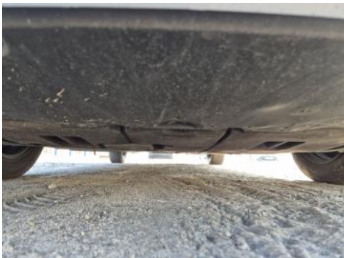
Fot. 25 Spód pojazdu przód