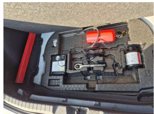
Fot. 36 Zestaw naprawczy koła