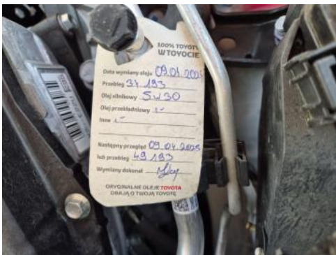
Fot. 37 Zdjęcie do protokołu