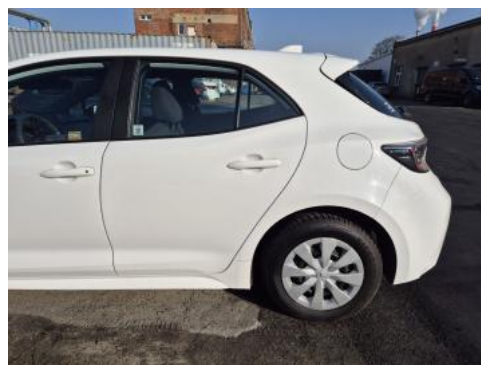
Fot. 10 Bok lewy z tyłu