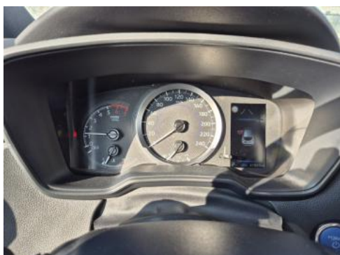
Fot. 15 Zestaw wskaźników - przebieg