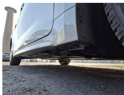
Fot. 4 Próg prawy (widok od przodu)