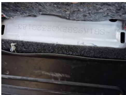
Fot. 13 Numer identyfikacyjny