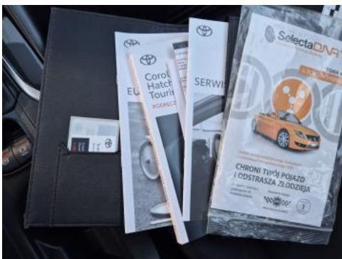
Fot. 35 Instrukcje