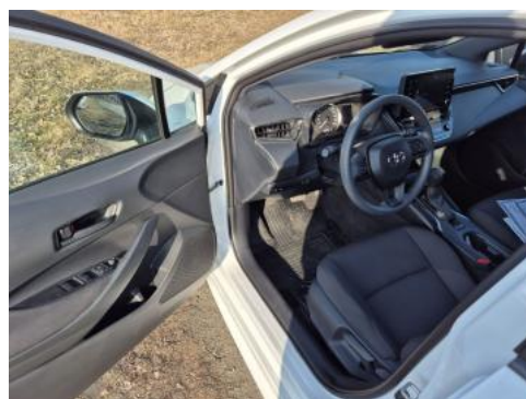
Fot. 16 Widok przez otwarte drzwi przednie lewe