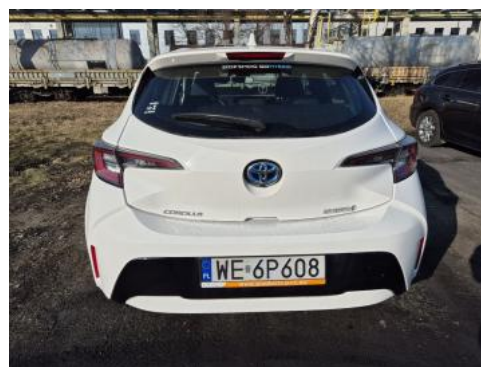
Fot. 8 Tył