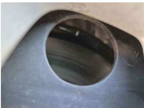
Fot. 29 Tarcza hamulcowa tylna prawa