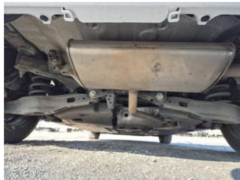
Fot. 26 Spód pojazdu tył