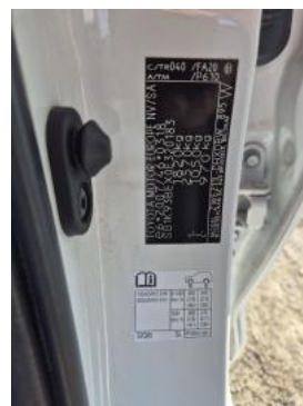
Fot. 14 Tabliczka znamionowa