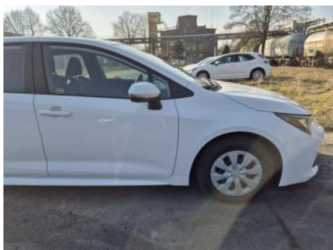
Fot. 5 Bok prawy z przodu