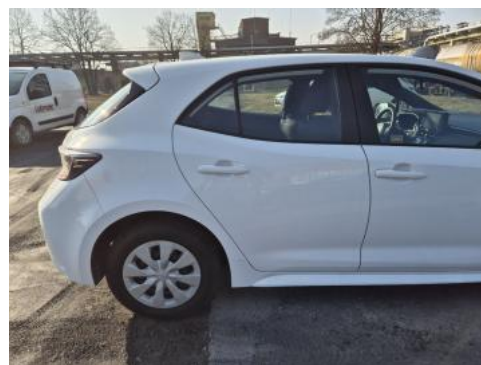
Fot. 6 Bok prawy z tyłu