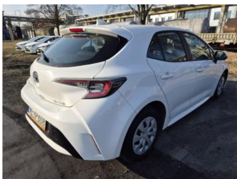
Fot. 7 Przekątna tylna prawa