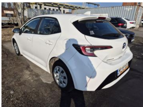
Fot. 9 Przekątna tylna lewa