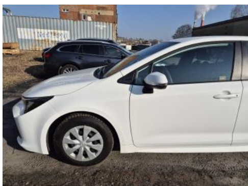
Fot. 11 Bok lewy z przodu