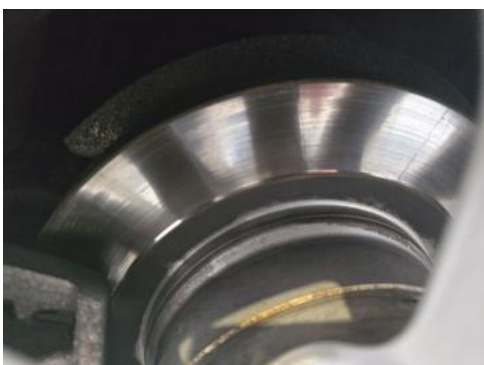
Fot. 31 Tarcza hamulcowa tylna lewa