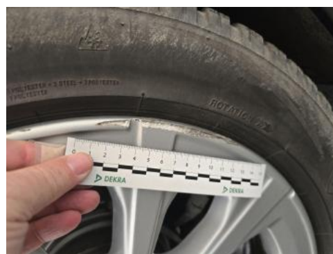
Fot. 46 Felga aluminiowa tylna P - Rysa/odprysk 1