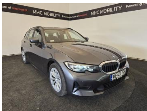
Fot. 3 Przekątna przednia prawa