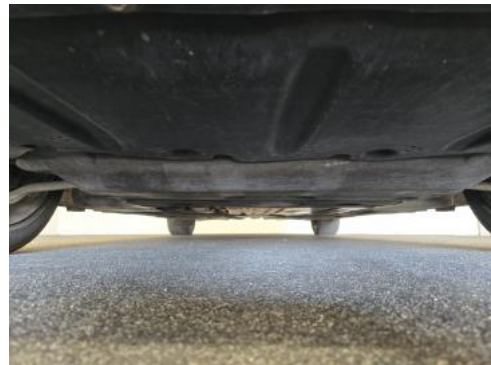
Fot. 26 Spód pojazdu przód