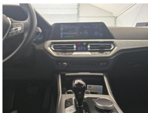
Fot. 20 Konsola środkowa