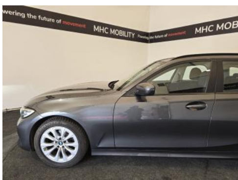
Fot. 11 Bok lewy z przodu