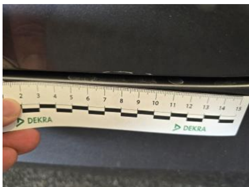
Fot. 49 Drzwi tylne L - Rysa/odprysk 1