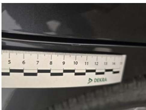
Fot. 45 Błotnik tylny P / Ściana boczna P - Rysa/odprysk 1