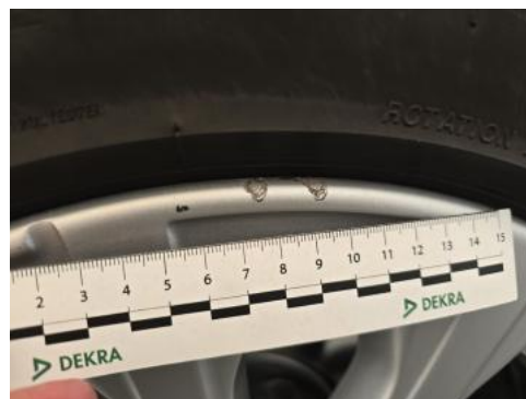
Fot. 42 Felga aluminiowa przednia P - Rysa/odprysk 1