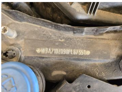
Fot. 13 Numer identyfikacyjny