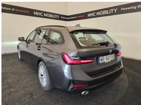
Fot. 9 Przekątna tylna lewa