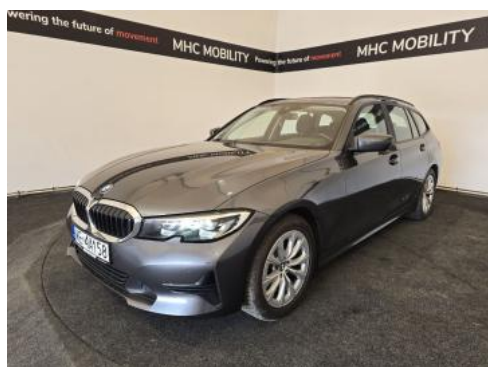
Fot. 1 Przekątna przednia lewa