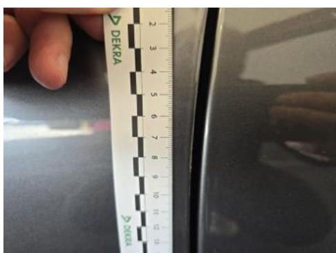
Fot. 47 Drzwi przed L - Rysa/odprysk 1