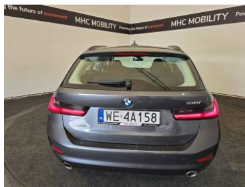
Fot. 8 Tył