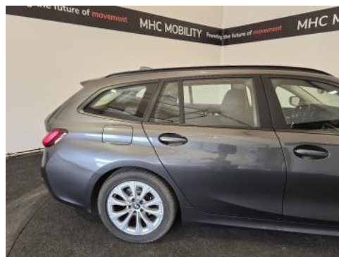
Fot. 6 Bok prawy z tyłu