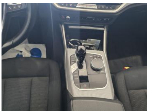
Fot. 21 Tunel środkowy