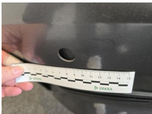
Fot. 37 Czujniki parkowania przód - Inne 1