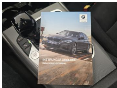
Fot. 34 Instrukcje