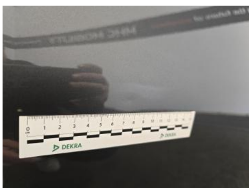
Fot. 43 Drzwi przednie P - Wgniecenie/odkształcenie 1