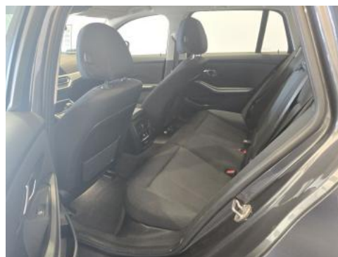
Fot. 18 Widok przez otwarte drzwi tylne lewe