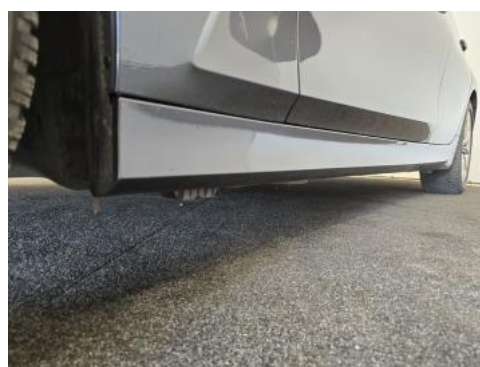
Fot. 12 Próg lewy (widok od przodu)