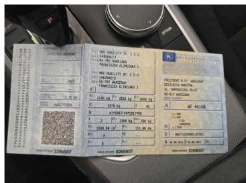
Fot. 32 Dowód rej. Str. 1