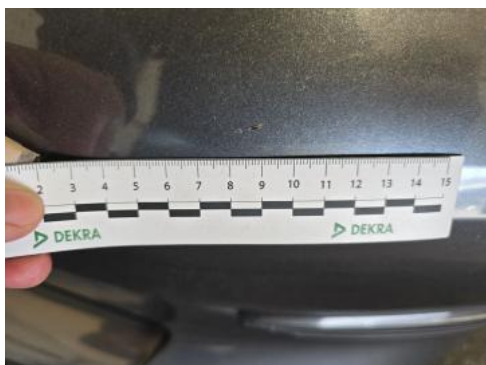
Fot. 41 Zderzak() - Rysa/odprysk 3