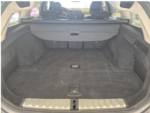
Fot. 25 Bagażnik