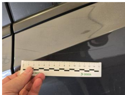
Fot. 50 Drzwi tylne L() - Rysa/odprysk 3