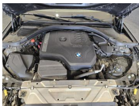
Fot. 24 Komora silnika