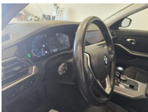
Fot. 23 Kierownica z lewej strony