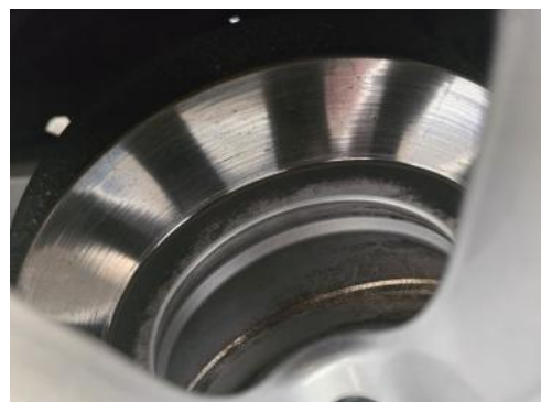
Fot. 30 Tarcza hamulcowa tylna prawa