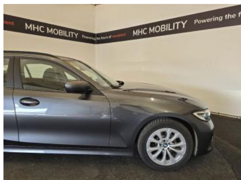
Fot. 5 Bok prawy z przodu