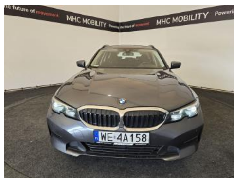
Fot. 2 Przód