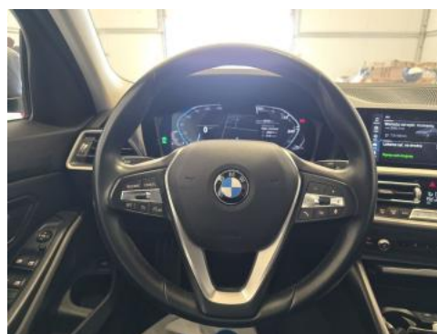
Fot. 22 Kierownica (na wprost)