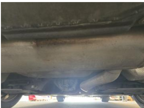
Fot. 27 Spód pojazdu tył