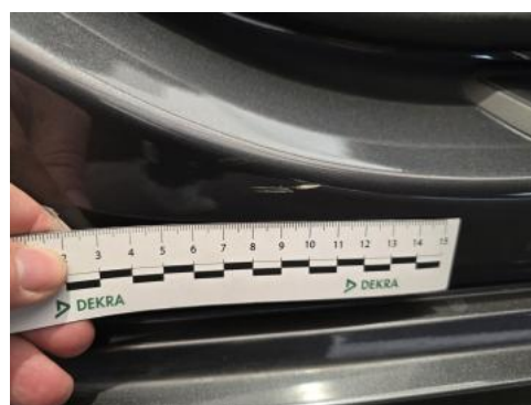
Fot. 44 Próg P - Rysa/odprysk 1