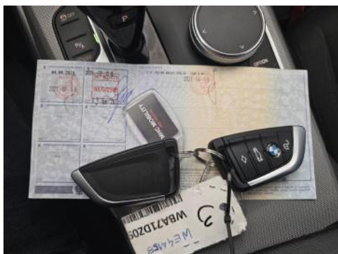
Fot. 33 Dow. Rej. Str.2 i klucze