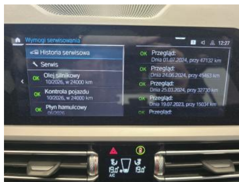
Fot. 16 Zestaw wskaźników - serwis