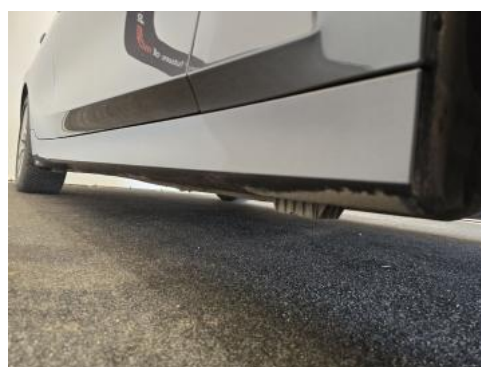
Fot. 4 Próg prawy (widok od przodu)