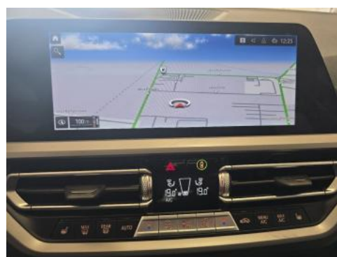
Fot. 36 nawigacja