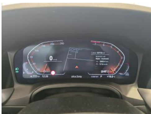
Fot. 15 Zestaw wskaźników - przebieg