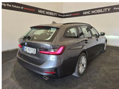
Fot. 7 Przekątna tylna prawa