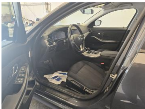
Fot. 17 Widok przez otwarte drzwi przednie lewe