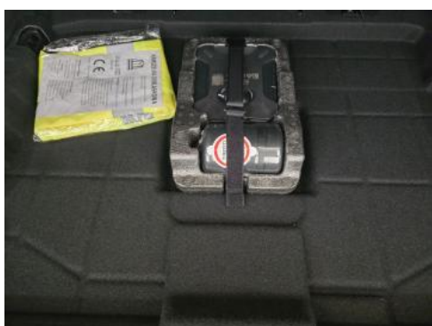
Fot. 35 Zestaw naprawczy koła