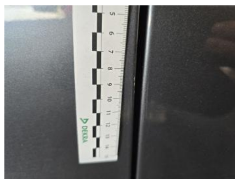
Fot. 48 Drzwi przed L() - Rysa/odprysk 3