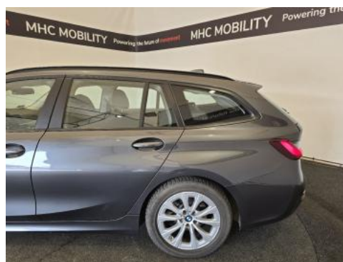
Fot. 10 Bok lewy z tyłu