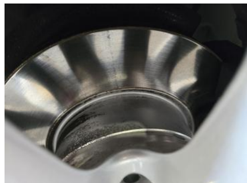
Fot. 28 Tarcza hamulcowa przednia lewa