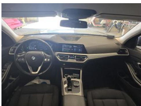
Fot. 19 Widok z tylnej kanapy na deskę rozdź.