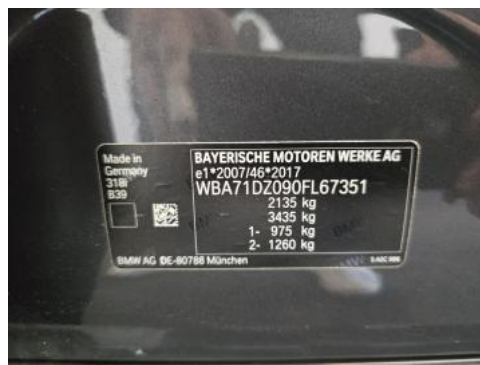
Fot. 14 Tabliczka znamionowa