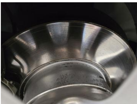
Fot. 29 Tarcza hamulcowa przednia prawa