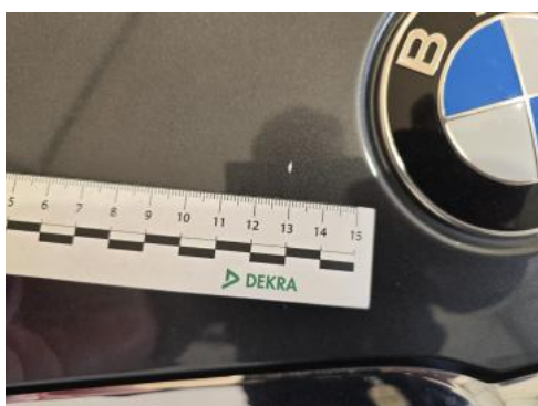
Fot. 39 Pokrywa komory silnika() - Rysa/odprysk 3