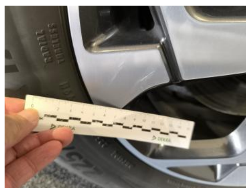
Fot. 40 Felga Aluminiowa przednia L - Rysa/odprysk 1