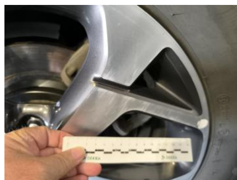
Fot. 38 Felga aluminiowa tylna L - Rysa/odprysk 1