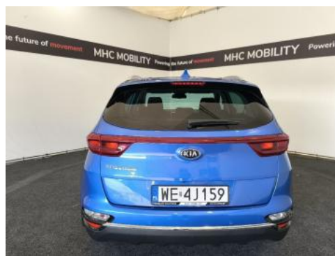
Fot. 8 Tył