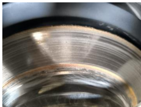
Fot. 30 Tarcza hamulcowa tylna prawa