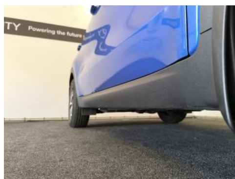
Fot. 4 Próg prawy (widok od przodu)