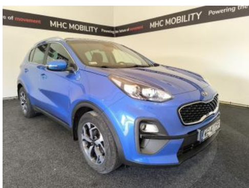
Fot. 3 Przekątna przednia prawa