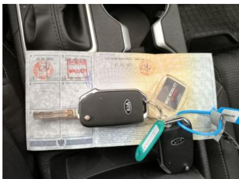
Fot. 33 Dow. Rej. Str.2 i klucze