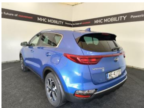
Fot. 9 Przekątna tylna lewa