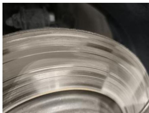
Fot. 28 Tarcza hamulcowa przednia lewa