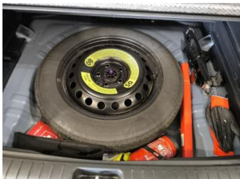
Fot. 25 Koło zapasowe