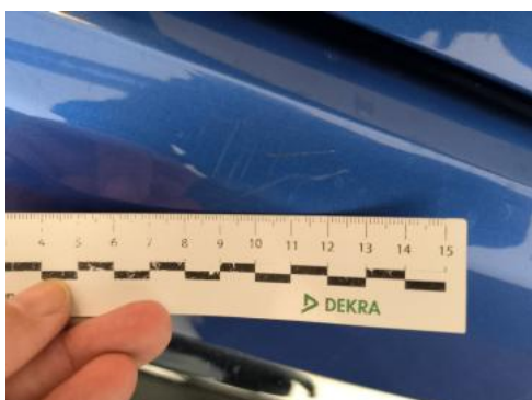
Fot. 37 Zderzak tylny - Rysa/odprysk 1