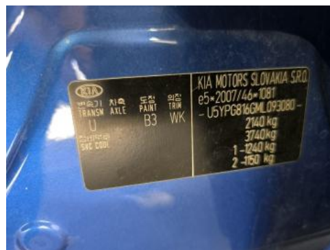
Fot. 14 Tabliczka znamionowa