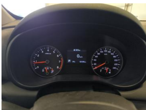
Fot. 15 Zestaw wskaźników - przebieg