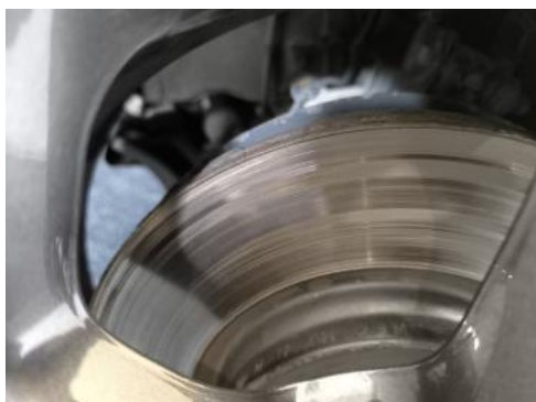
Fot. 29 Tarcza hamulcowa przednia prawa