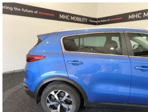
Fot. 6 Bok prawy z tyłu