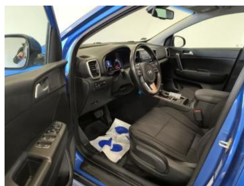
Fot. 16 Widok przez otwarte drzwi przednie lewe