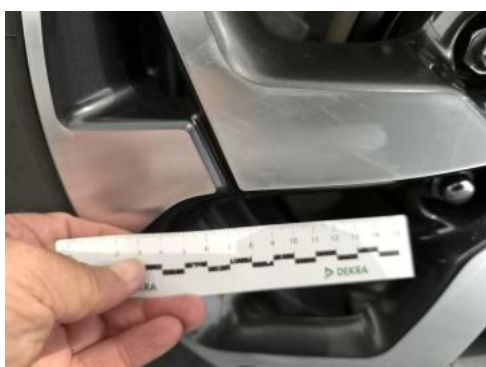
Fot. 35 Felga aluminiowa tylna P - Rysa/odprysk 1