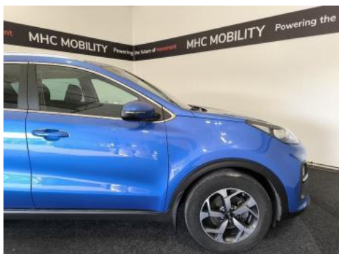
Fot. 5 Bok prawy z przodu