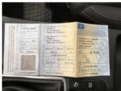
Fot. 32 Dowód rej. Str. 1