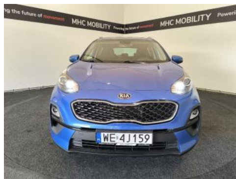
Fot. 2 Przód