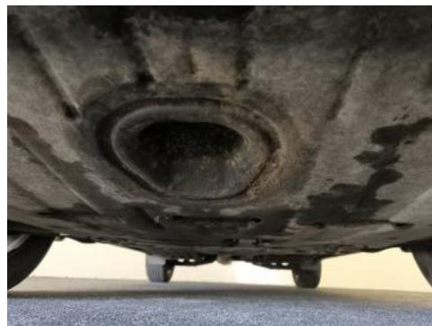
Fot. 26 Spód pojazdu przód