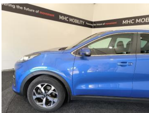
Fot. 11 Bok lewy z przodu