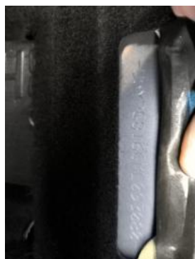
Fot. 13 Numer identyfikacyjny