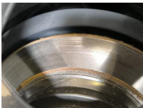
Fot. 31 Tarcza hamulcowa tylna lewa