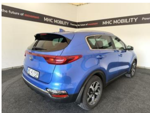
Fot. 7 Przekątna tylna prawa