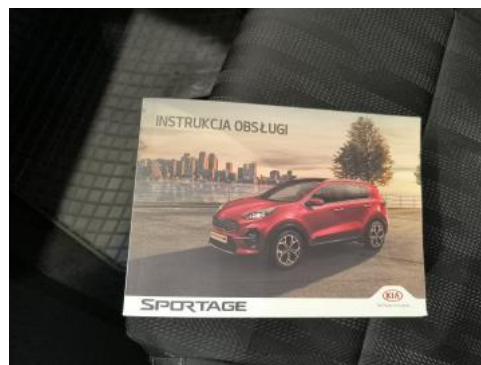
Fot. 34 Instrukcje