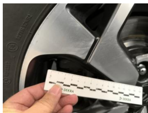
Fot. 36 Felga aluminiowa tylna P() - Rysa/odprysk 3