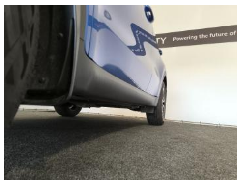
Fot. 12 Próg lewy (widok od przodu)