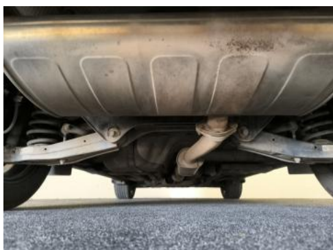
Fot. 27 Spód pojazdu tył