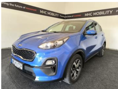
Fot. 1 Przekątna przednia lewa