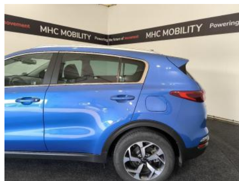
Fot. 10 Bok lewy z tyłu