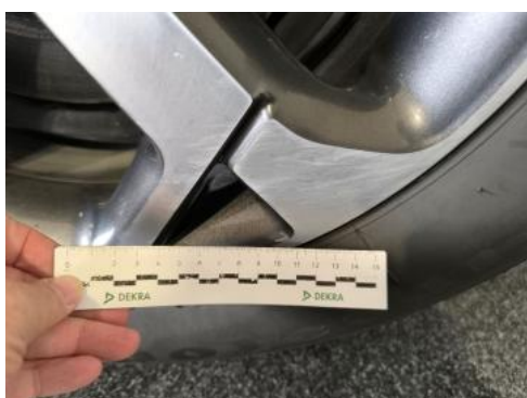
Fot. 39 Felga aluminiowa tylna L() - Rysa/odprysk 3