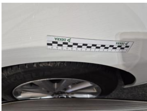
Fot. 47 Błotnik tylny L / Ściana boczna L - Wgniecenie/odkształcenie 1