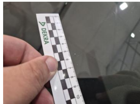
Fot. 38 Szyba czołowa - Rysa/odprysk 2