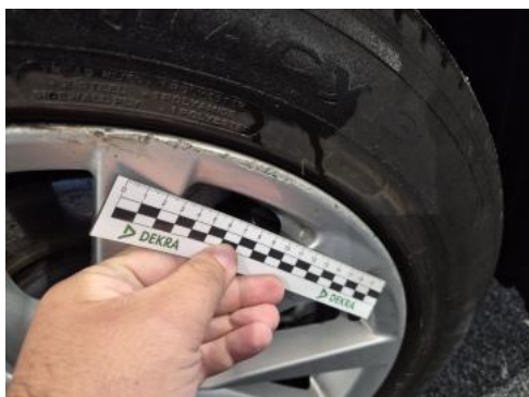
Fot. 41 Felga aluminiowa przednia P - Rysa/odprysk 1