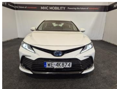
Fot. 2 Przód