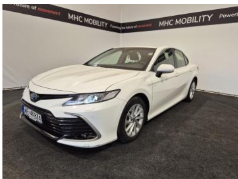
Fot. 1 Przekątna przednia lewa