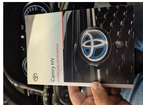
Fot. 36 Instrukcje