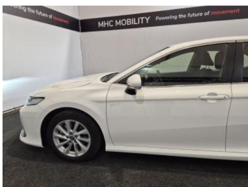
Fot. 11 Bok lewy z przodu