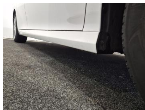
Fot. 4 Próg prawy (widok od przodu)