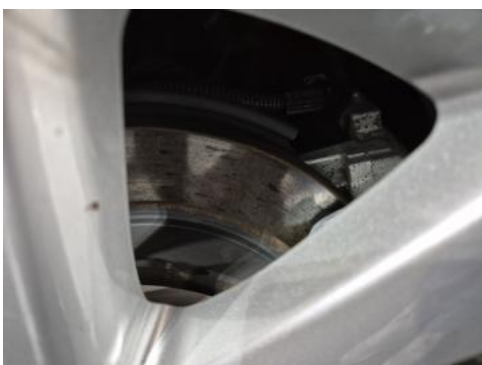
Fot. 31 Tarcza hamulcowa tylna lewa