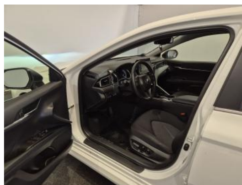
Fot. 16 Widok przez otwarte drzwi przednie lewe