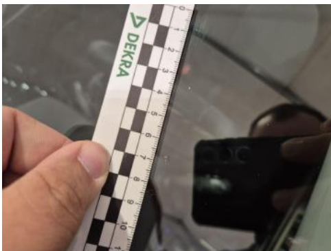
Fot. 37 Szyba czołowa - Rysa/odprysk 1