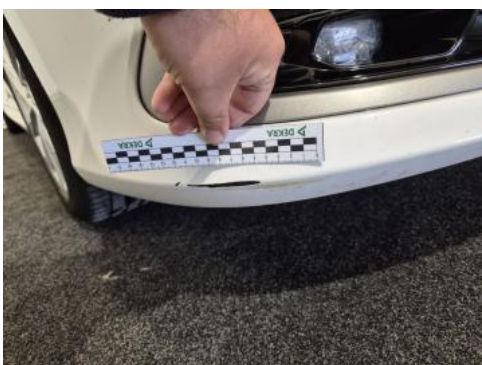
Fot. 39 Zderzak - Rysa/odprysk 1