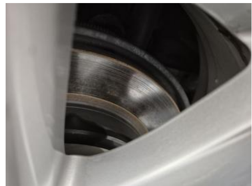
Fot. 30 Tarcza hamulcowa tylna prawa