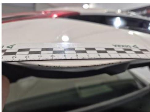
Fot. 43 Pokrywy bagażnika - Rysa/odprysk 1