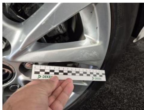
Fot. 48 Felga aluminiowa tylna L - Rysa/odprysk 1