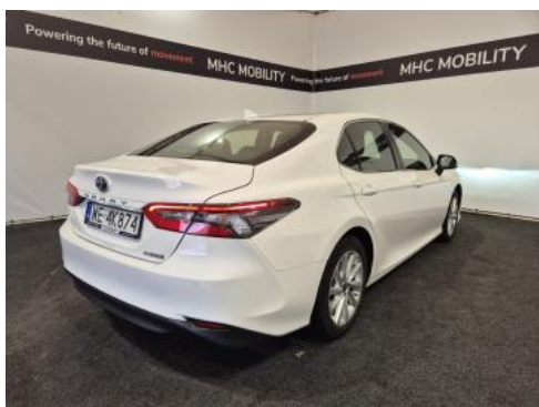
Fot. 7 Przekątna tylna prawa