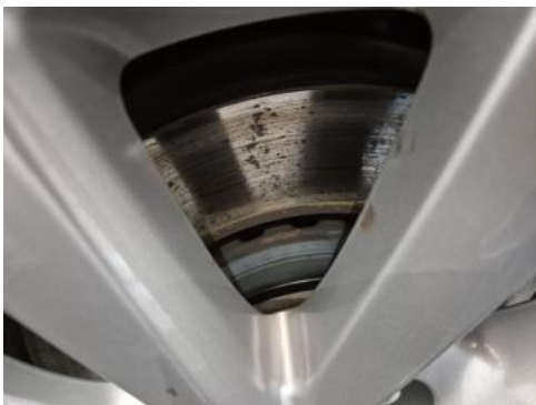
Fot. 29 Tarcza hamulcowa przednia prawa