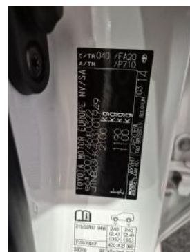
Fot. 14 Tabliczka znamionowa