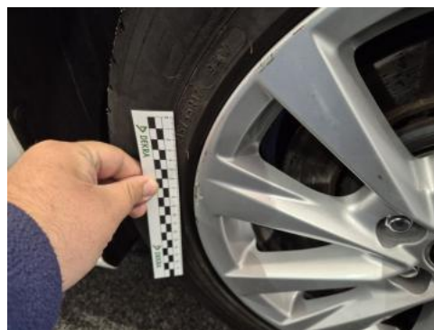
Fot. 42 Felga aluminiowa przednia P - Rysa/odprysk 2