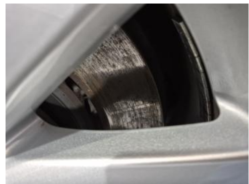
Fot. 28 Tarcza hamulcowa przednia lewa