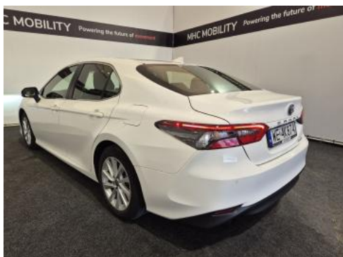
Fot. 9 Przekątna tylna lewa