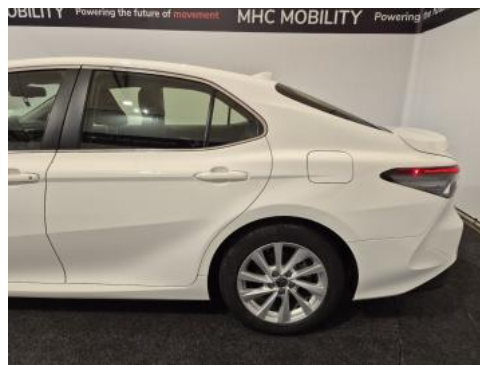
Fot. 10 Bok lewy z tyłu