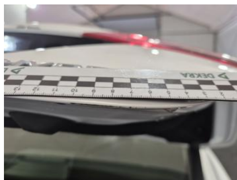
Fot. 44 Pokrywy bagażnika - Rysa/odprysk 2