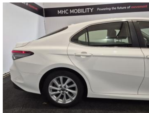
Fot. 6 Bok prawy z tyłu