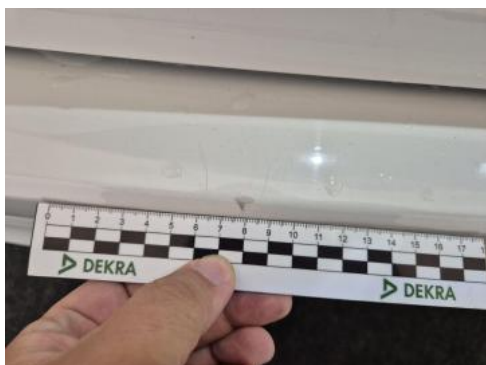
Fot. 45 Zderzak tylny - Rysa/odprysk 1