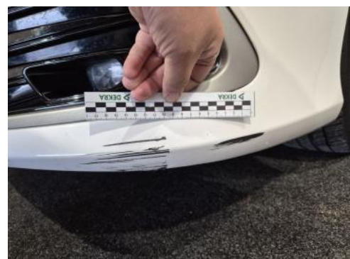
Fot. 40 Zderzak - Rysa/odprysk 2