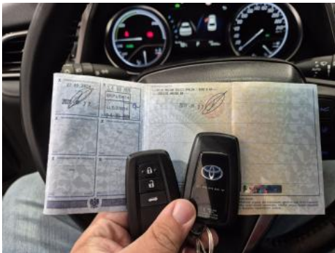
Fot. 33 Dow. Rej. Str.2 i klucze