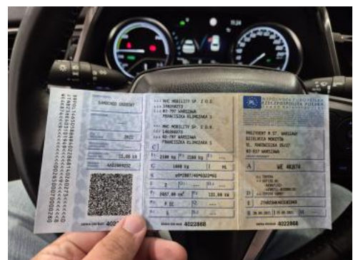
Fot. 32 Dowód rej. Str. 1