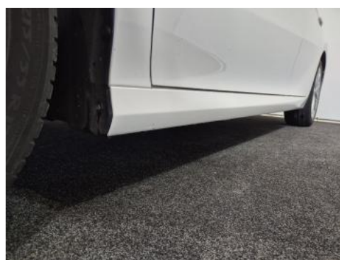
Fot. 12 Próg lewy (widok od przodu)