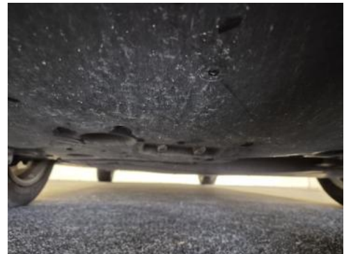
Fot. 26 Spód pojazdu przód