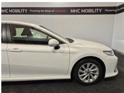
Fot. 5 Bok prawy z przodu