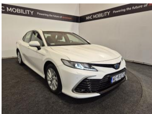
Fot. 3 Przekątna przednia prawa