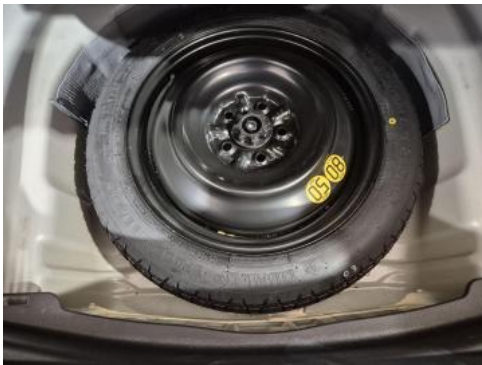
Fot. 25 Koło zapasowe