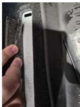
Fot. 13 Numer identyfikacyjny