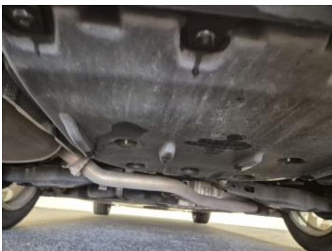
Fot. 27 Spód pojazdu tył