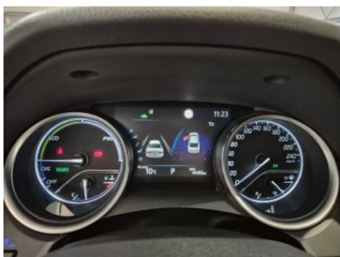
Fot. 15 Zestaw wskaźników - przebieg