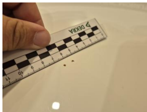
Fot. 46 Dach - Rysa/odprysk 1