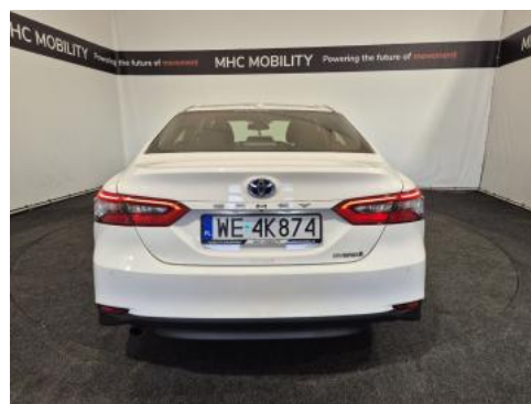
Fot. 8 Tył