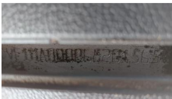
Fot. 13 Numer identyfikacyjny