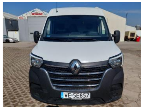
Fot. 2 Przód