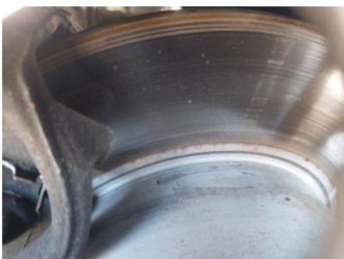
Fot. 31 Tarcza hamulcowa tylna prawa