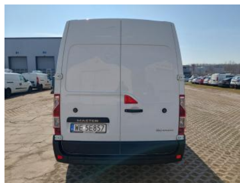
Fot. 8 Tył