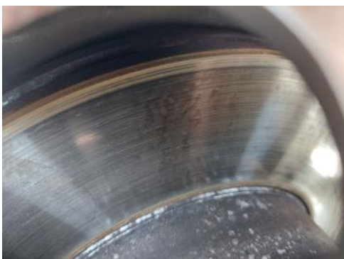
Fot. 29 Tarcza hamulcowa przednia lewa