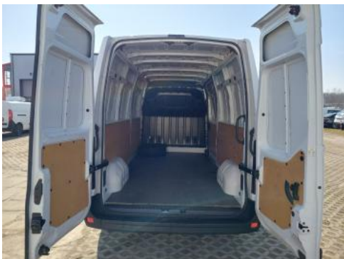
Fot. 25 Bagażnik