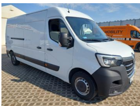
Fot. 3 Przekątna przednia prawa