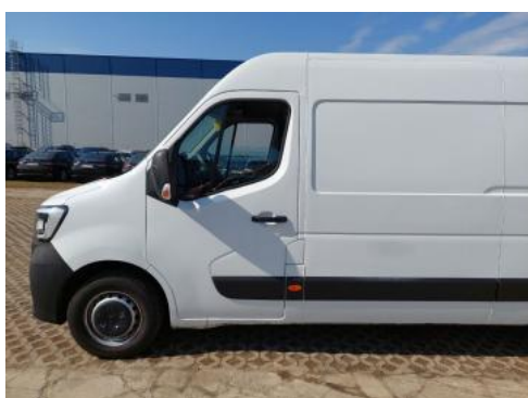
Fot. 11 Bok lewy z przodu