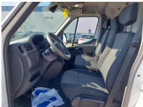
Fot. 17 Widok przez otwarte drzwi przednie lewe