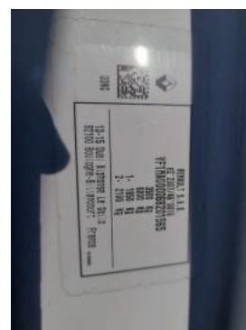
Fot. 14 Tabliczka znamionowa