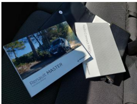
Fot. 35 Instrukcje