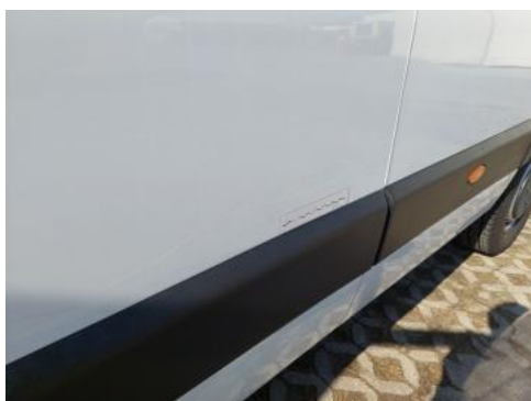
Fot. 39 Bok L - Rysa/odprysk 1