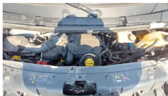
Fot. 24 Komora silnika