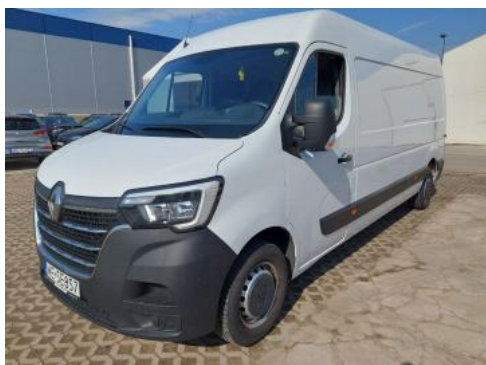
Fot. 1 Przekątna przednia lewa