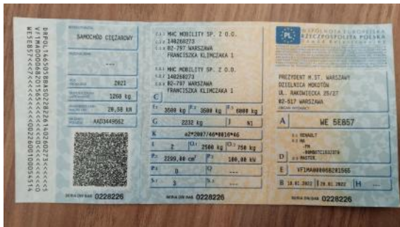
Fot. 33 Dowód rej. Str. 1