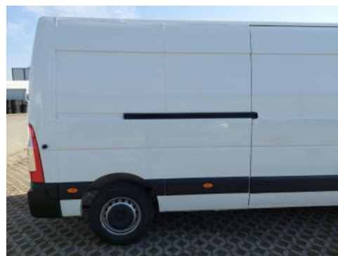
Fot. 6 Bok prawy z tyłu