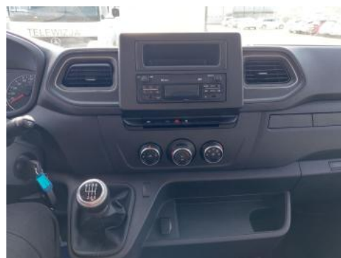
Fot. 20 Konsola środkowa