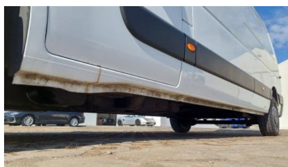
Fot. 12 Próg lewy (widok od przodu)