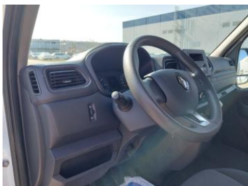
Fot. 23 Kierownica z lewej strony