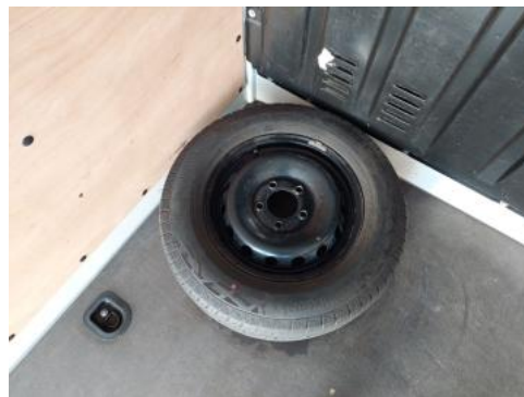
Fot. 26 Koło zapasowe