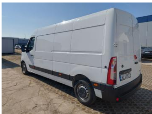
Fot. 9 Przekątna tylna lewa