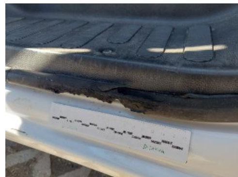
Fot. 36 uszczelka drzwi LP sparciała