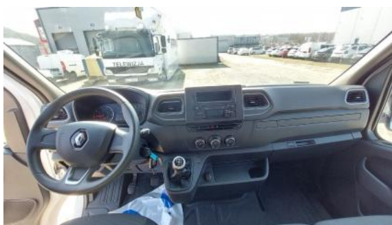
Fot. 19 Widok z tylnej kanapy na deskę rozdz.