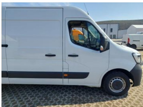
Fot. 5 Bok prawy z przodu