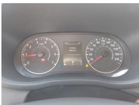
Fot. 15 Zestaw wskaźników - przebieg