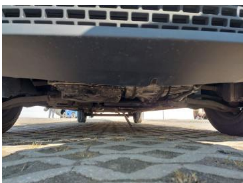
Fot. 27 Spód pojazdu przód