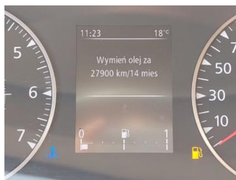
Fot. 16 Zestaw wskaźników - serwis