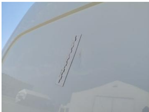
Fot. 37 Pokrywy bagażnika - Rysa/odprysk 1