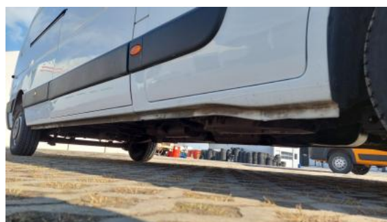
Fot. 4 Próg prawy (widok od przodu)