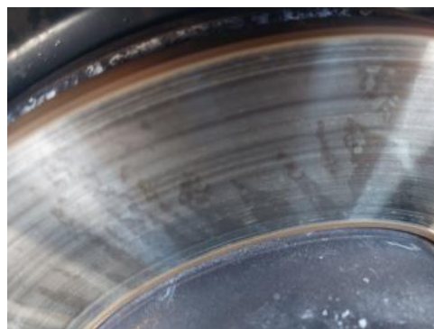
Fot. 30 Tarcza hamulcowa przednia prawa