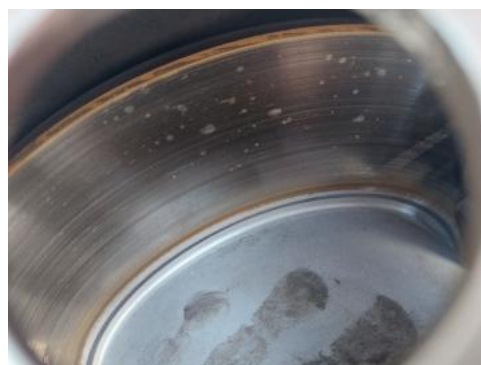
Fot. 32 Tarcza hamulcowa tylna lewa