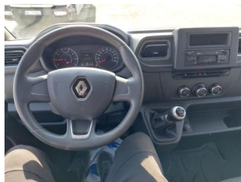
Fot. 22 Kierownica (na wprost)