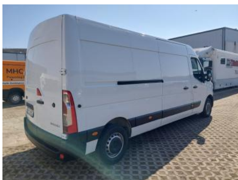
Fot. 7 Przekątna tylna prawa