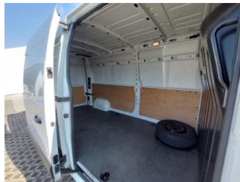
Fot. 18 Widok przez otwarte drzwi tylne lewe