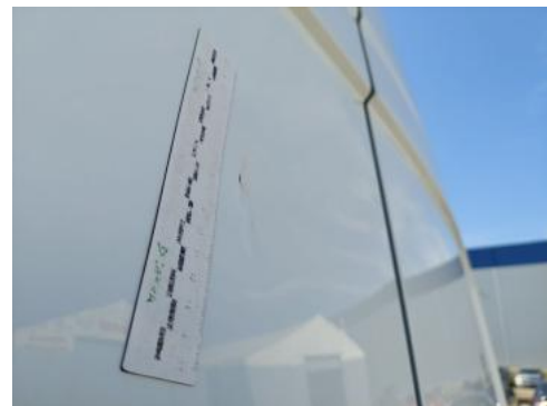
Fot. 38 Pokrywy bagażnika - Wgniecenie/odkształcenie 1