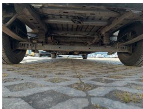
Fot. 28 Spód pojazdu tył