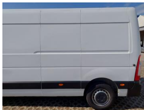
Fot. 10 Bok lewy z tyłu