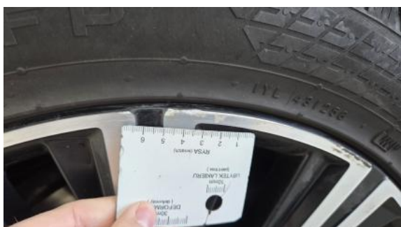
Fot. 39 Felga aluminiowa tylna P - Rysa/odprysk 1