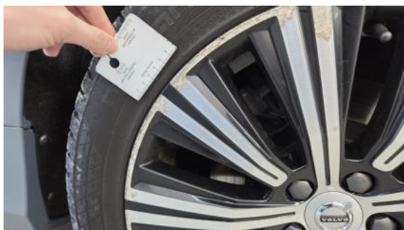
Fot. 45 Felga aluminiowa tylna L - Rysa/odprysk 2