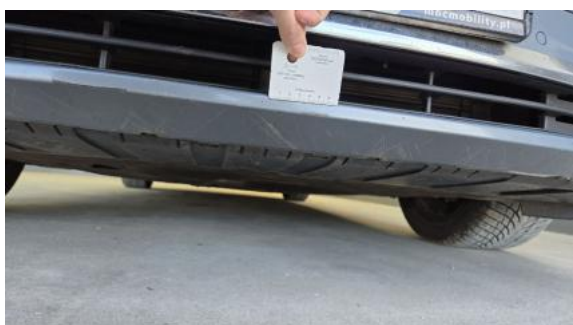
Fot. 35 Zderzak - Rysa/odprysk 1