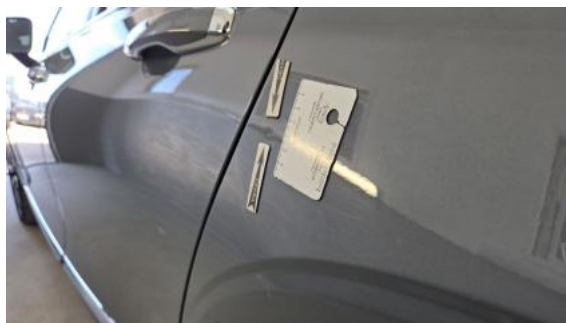
Fot. 42 Błotnik tylny L / Ściana boczna L - Wgniecenie/odkształcenie 1