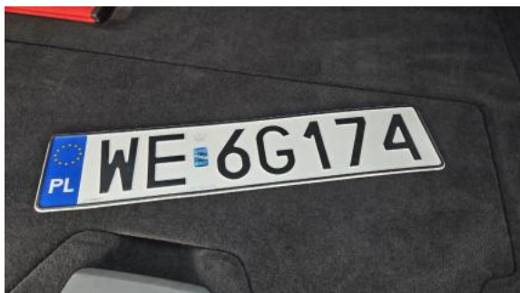
Fot. 33 Zdjęcie do protokołu