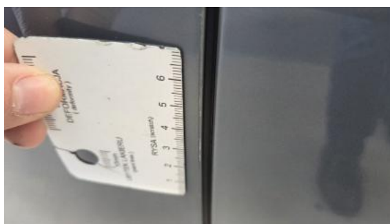
Fot. 48 Drzwi przed L - Rysa/odprysk 2