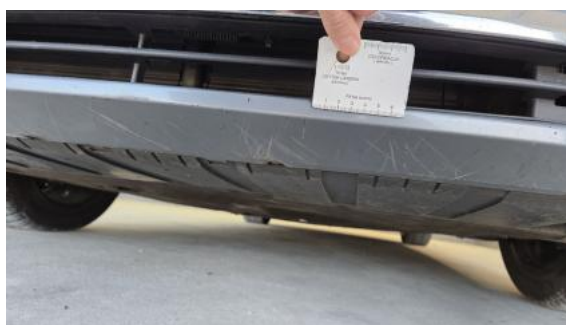
Fot. 36 Zderzak - Rysa/odprysk 2