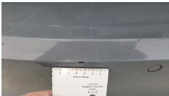
Fot. 41 Zderzak tylny - Rysa/odprysk 2