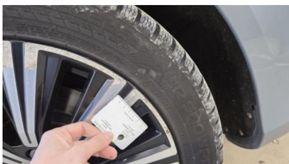
Fot. 43 Felga aluminiowa tylna L - zdjęcie poglądowe 1