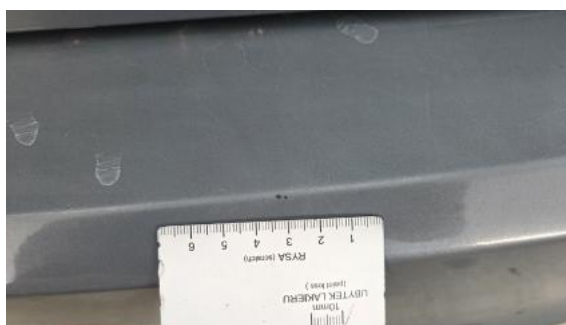
Fot. 40 Zderzak tylny - Rysa/odprysk 1