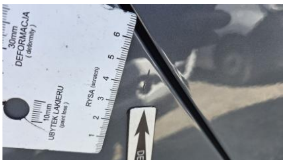
Fot. 37 Błotnik tylny P / Ściana boczna P - Rysa/odprysk 1