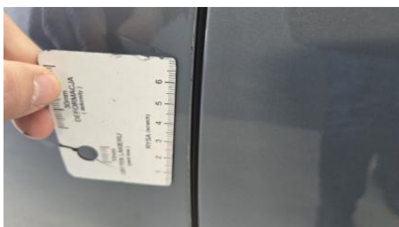
Fot. 47 Drzwi przed L - Rysa/odprysk 1