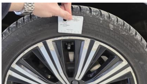
Fot. 44 Felga aluminiowa tylna L - Rysa/odprysk 1