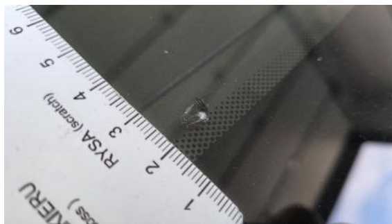
Fot. 34 Szyba czołowa - Pęknięcie/rozerwanie 1