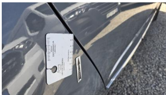
Fot. 38 Błotnik tylny P / Ściana boczna P - Wgniecenie/odkształcenie 1