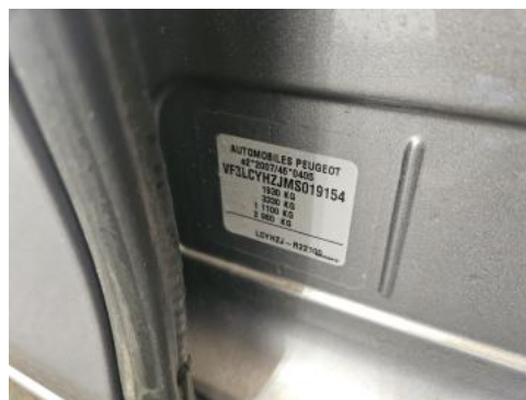
Fot. 14 Tabliczka znamionowa