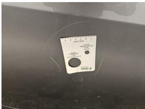
Fot. 39 Drzwi tylne P - Rysa/odprysk 1