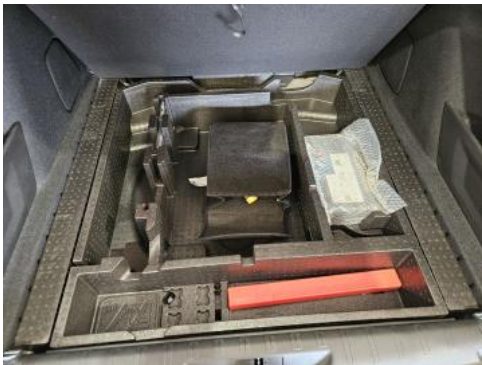
Fot. 25 Koło zapasowe