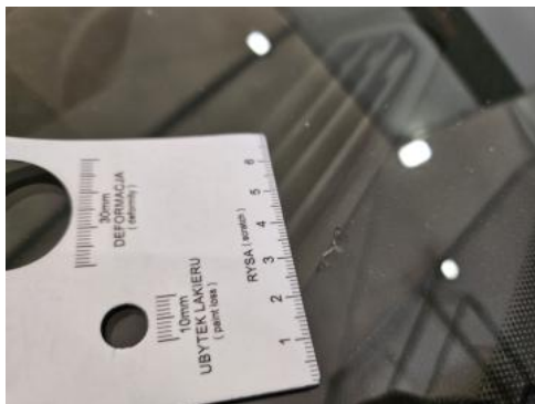
Fot. 37 Szyba czołowa - Rysa/odprysk 1