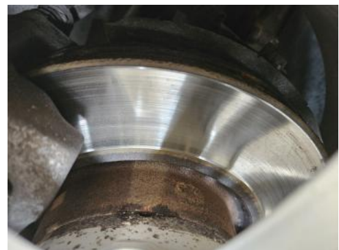
Fot. 28 Tarcza hamulcowa przednia lewa