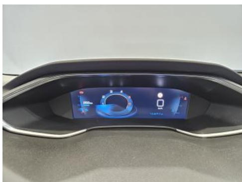
Fot. 15 Zestaw wskaźników - przebieg