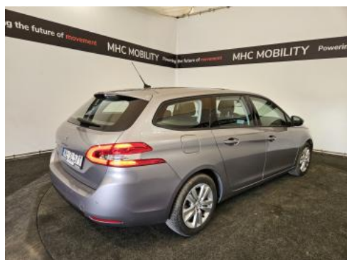
Fot. 7 Przekątna tylna prawa