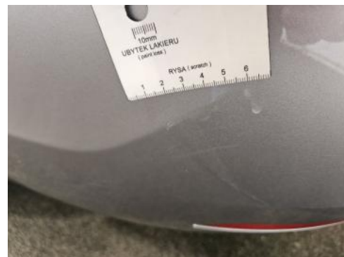
Fot. 40 Zderzak tylny - Rysa/odprysk 1