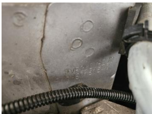
Fot. 13 Numer identyfikacyjny