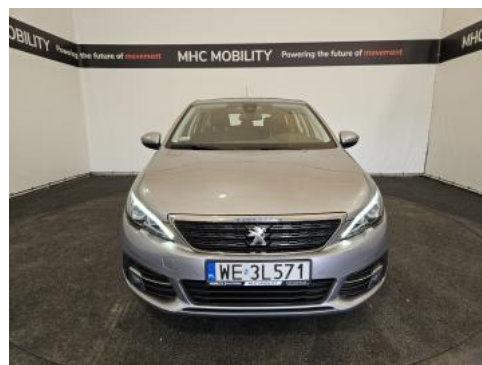
Fot. 2 Przód