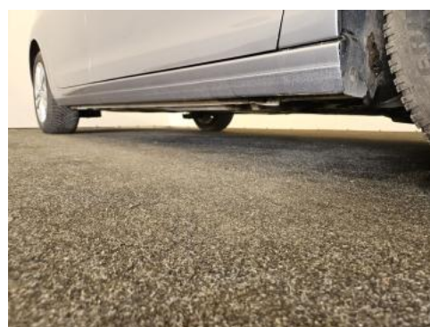
Fot. 4 Próg prawy (widok od przodu)