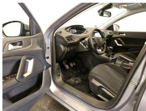
Fot. 16 Widok przez otwarte drzwi przednie lewe