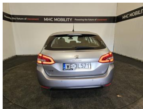
Fot. 8 Tył