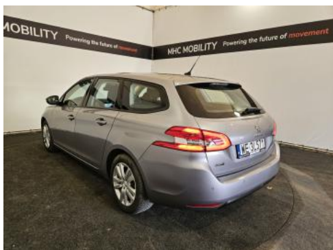
Fot. 9 Przekątna tylna lewa