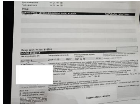
Fot. 34 Książka serwisowa – ostatni przegląd