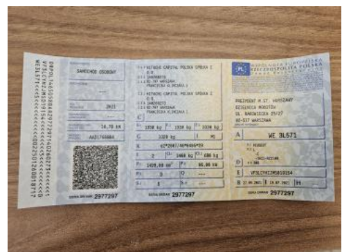
Fot. 32 Dowód rej. Str. 1