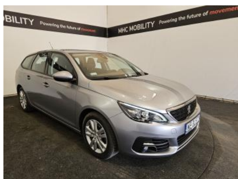
Fot. 3 Przekątna przednia prawa