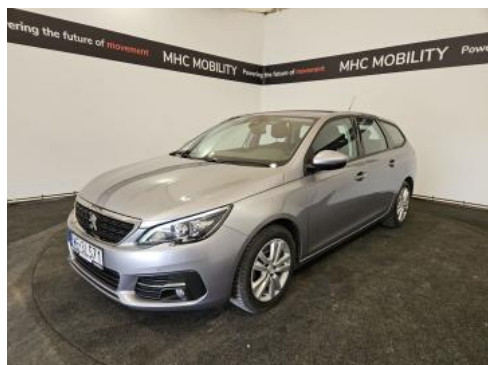
Fot. 1 Przekątna przednia lewa