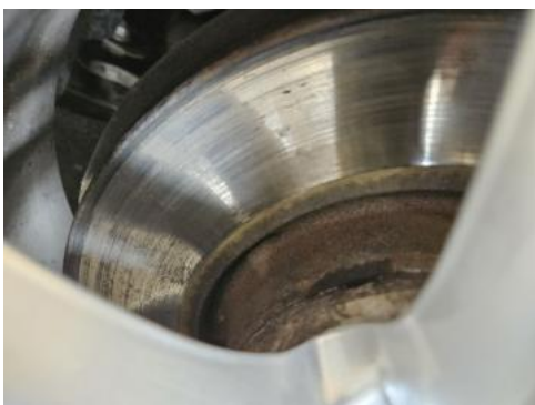
Fot. 29 Tarcza hamulcowa przednia prawa