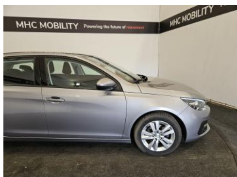
Fot. 5 Bok prawy z przodu