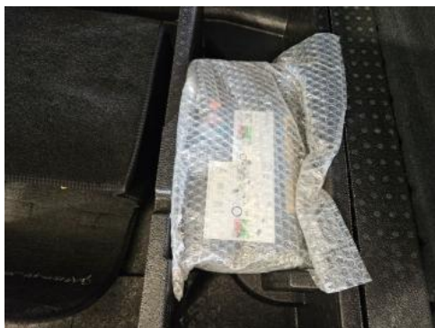
Fot. 35 Zestaw naprawczy koła