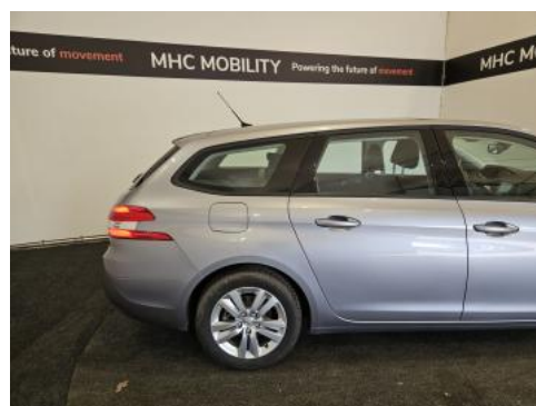
Fot. 6 Bok prawy z tyłu