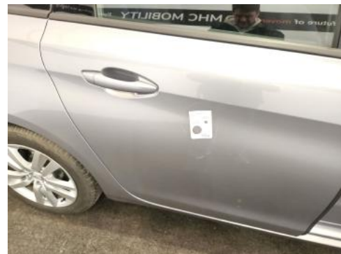
Fot. 38 Drzwi tylne P - zdjęcie poglądowe 1