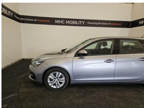
Fot. 11 Bok lewy z przodu