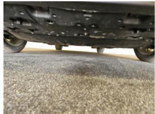
Fot. 26 Spód pojazdu przód