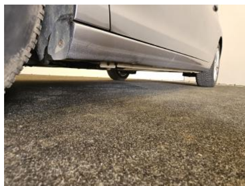
Fot. 12 Próg lewy (widok od przodu)