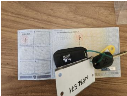
Fot. 33 Dow. Rej. Str.2 i klucze