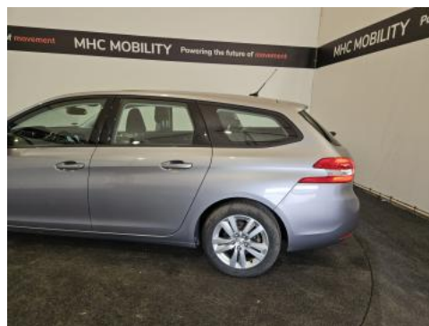
Fot. 10 Bok lewy z tyłu