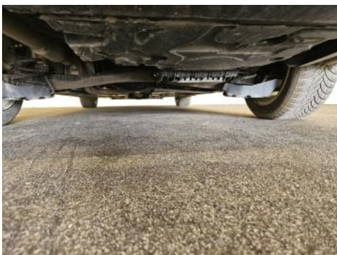
Fot. 27 Spód pojazdu tył