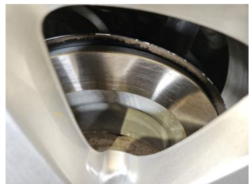
Fot. 30 Tarcza hamulcowa tylna prawa