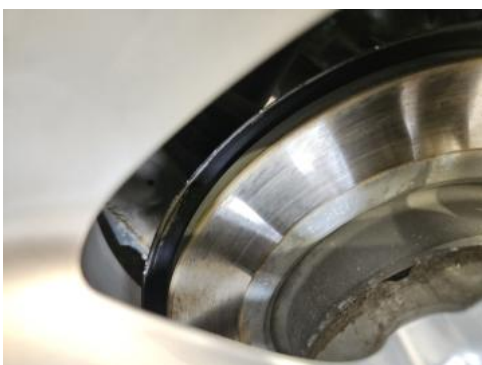
Fot. 31 Tarcza hamulcowa tylna lewa